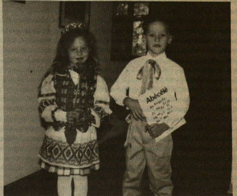
Keliausim į mokyklėlę!

demokratiją, pats laikas pereiti ne tik prie tiesioginio visų Seimo narių rinkimo, bet leisti patiems žmonėms rinkti apskričių viršininkus, merus, seniūnus. Partijos tegul kelia savo kandidatus, už juos agituoja ir juos kontroliuoja, bet jų pasirinkimo ir atšaukimo teisė turi priklausyti piliečiams.