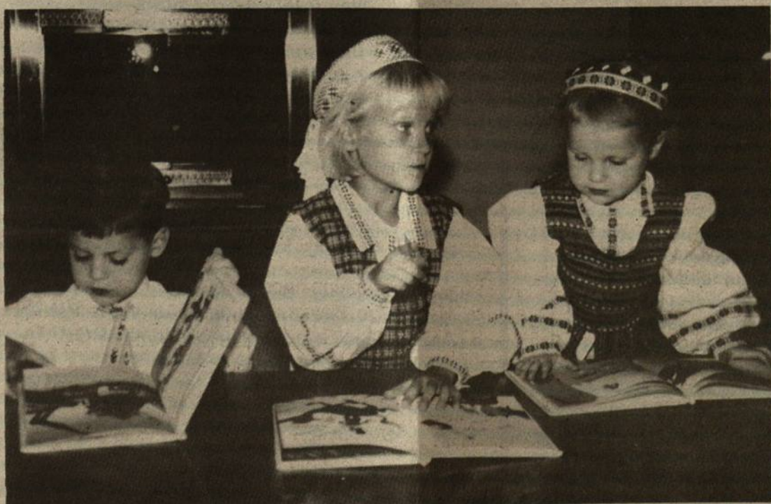
Besiruošiant į lietuvišką mokyklėlę.

Specialiai išleistą spalvotą parodos atvaizdų katalogą galima įsigyti Balzeko muziejuje. Lėšos, surinktos jį pardavus, bus skiriamos vaikų namams ir ligoninėms Baltijos šalyse.