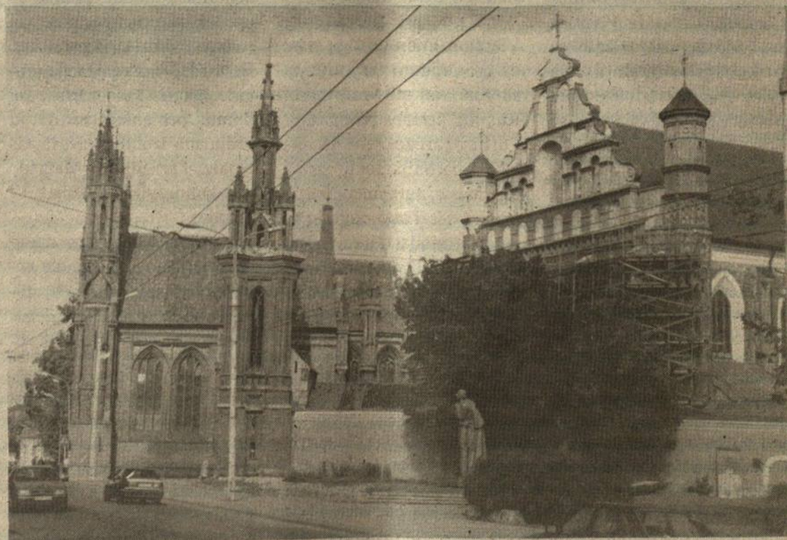
Vilniaus senamiestyje. Prie paminklo Adomui Mickevičiui 1987 metais įvyko Lietuvos laisvės lygos surengtas protesto mitingas, kurio metu pirmą kartą viešai pasmerktas 1939 m. rugpjūčio 23 d. sudarytas nacistinės Vokietijos ir komunistinės Sovietų Sąjungos paktas dėl įtakos sričių pasidalijimo Europoje.