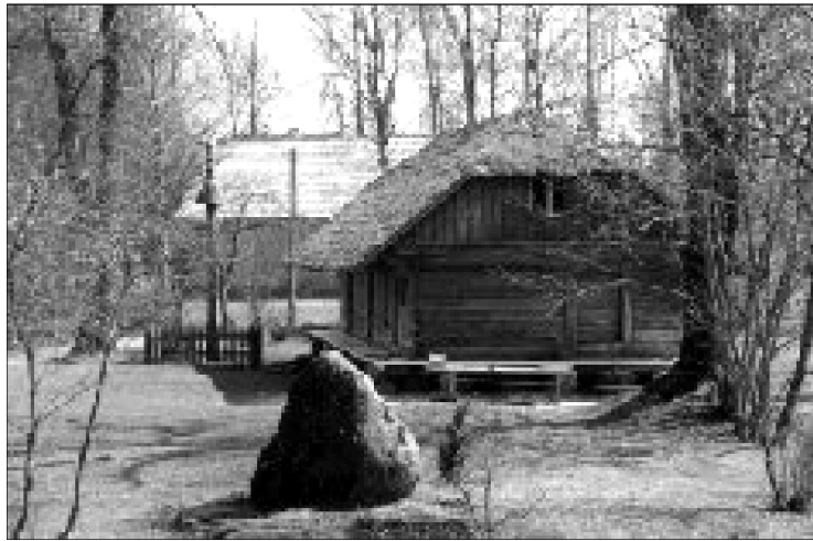
Motiejaus Valančiaus gimtinė Nasrėnuose.