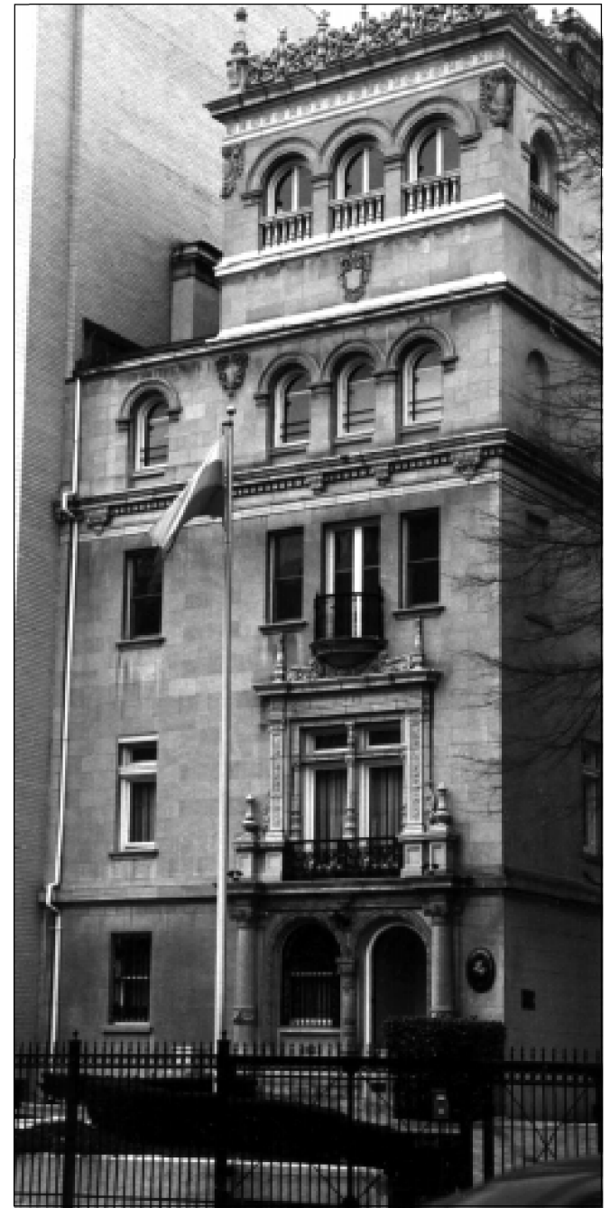
Lietuvos Respublikos ambasada Washingtone.

Žodžių - turi būti paruošta smulki valstybės administracijos schema, pagal modernių vakarų valstybių modelius, lanksti, nuolat peržiūrima, tobulinama, taisoma, nes be klaidų tokio darbo iš karto niekas nepadarys. Iš tikrųjų, tai turėjo būti padaryta dar pir-