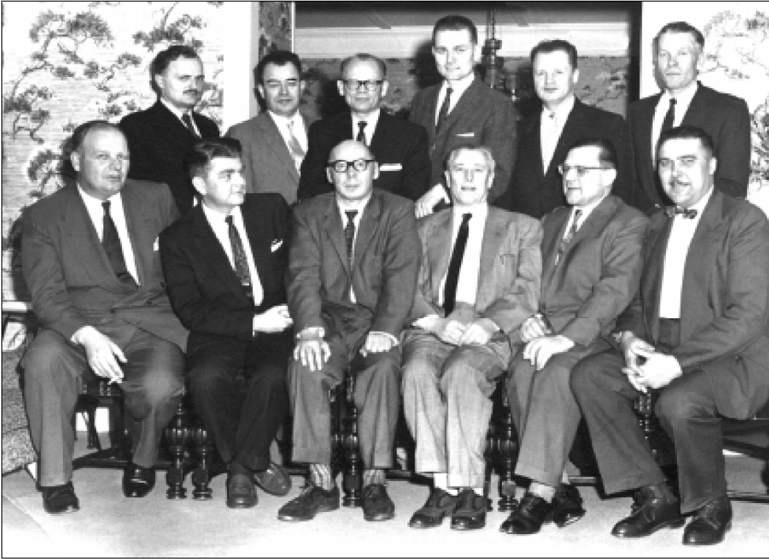
Amerikos Lietuvių Tautinės sąjungos, Korp! Noe-Lithuania, N.L. talkos ir N.L. Fondo vadovaujantieji nariai, posėdžiavę New Yorke. (Gaila, kad data yra nežinoma.)