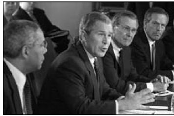
George W. Bush pasitarimo metu

Balandžio 10 d. Lenkijos laikraštis pranešė, kad JAV senatorių grupė kreipėsi į JAV prezidentą George W. Bush, ragindama įvykdyti rinkiminės kampanijos pažadą padidinti NATO narių skaičių. Demokratų ir respublikonų partijoms priklausantys senatoriai laiške ragino George W. Bush užtikrinti, kad 19 narių sąjunga kitais metais viršūnių susitikime Prahoje pradėtų antrąjį plėtros etapą.