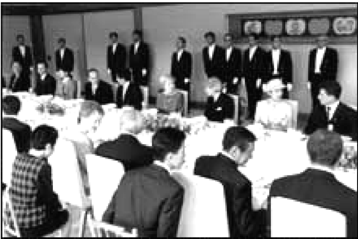
Imperatoriaus pietūs Lietuvos prezidento Valdo Adamkaus garbei: šioje stalo pusėje imperatorienė ir Valdas Adamkus, kitoje - imperatorius ir Alma Adamkienė.