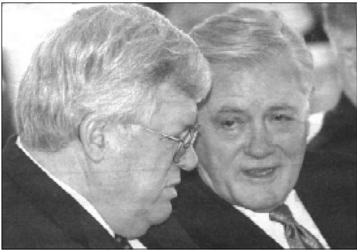
JAV Kongreso Atstovų rūmų pirmininkas Dennis Hastert su Lietuvos prezidentu Valdu Adamkumi Vilniuje, kuriam prezidentas įteikė Lietuvos Kunigaikščio Gedimino pirmojo laipsnio ordiną.

"Turime suvokti, kad tolesnės struktūrinės permainos, spartus Lietuvos modernizavimas yra neišvengiamas. Visos reformos, kurias užsibrėžėme įgyvendinti prieš stodami į Europos Sąjungą, yra daromos mūsų pačių labui, o ne dėl to, kad to reikalauja Europos Sąjunga", - sakė valstybės vadovas.