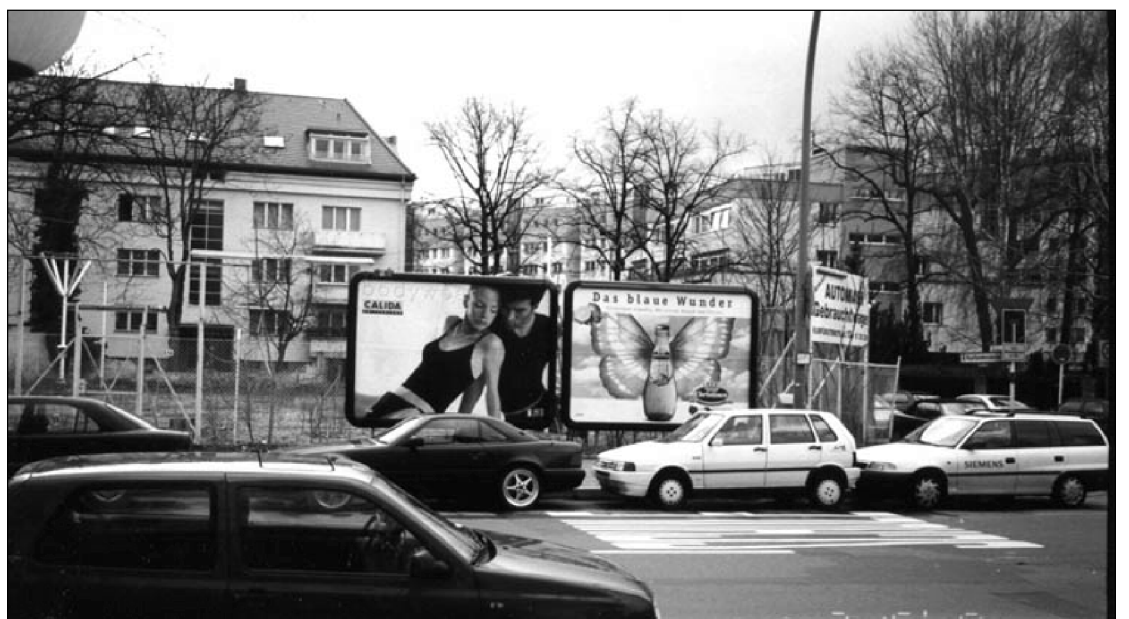
Lietuvai priklausantis sklypas Berlyne. Prieš karą ten stovėjo gražūs Pasiuntinybės rūmai, karo metu sugriauti. Po ilgoko tamposi valdžios įstaigose - vėl Lietuvos nuosavybė, čia kada nors stovės nauji ambasados rūmai.