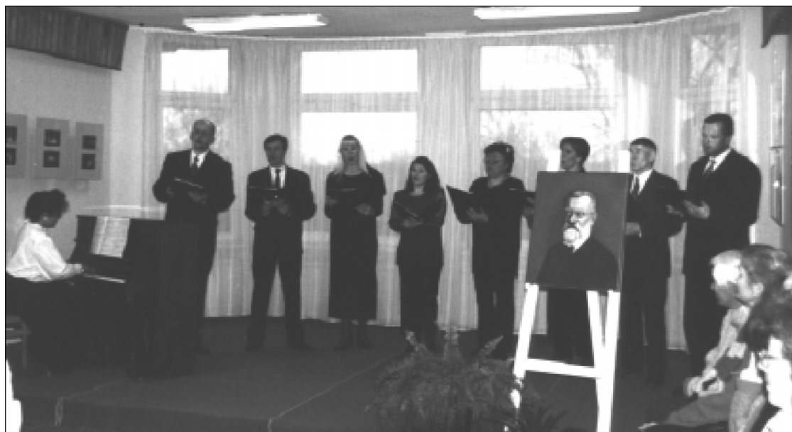
J. Šliūpo jubiliejaus minėjimas Palangos bibliotekoje. Dainuoja Palangos muzikos mokyklos oktetas.

Jono Šliūpo 140-ties metų minėjimai Lietuvoje baigėsi su žurnalisto Viliaus Kavaliausko pravestu pokalbiu jo vedamoje TV programoje Vilniuje. VS