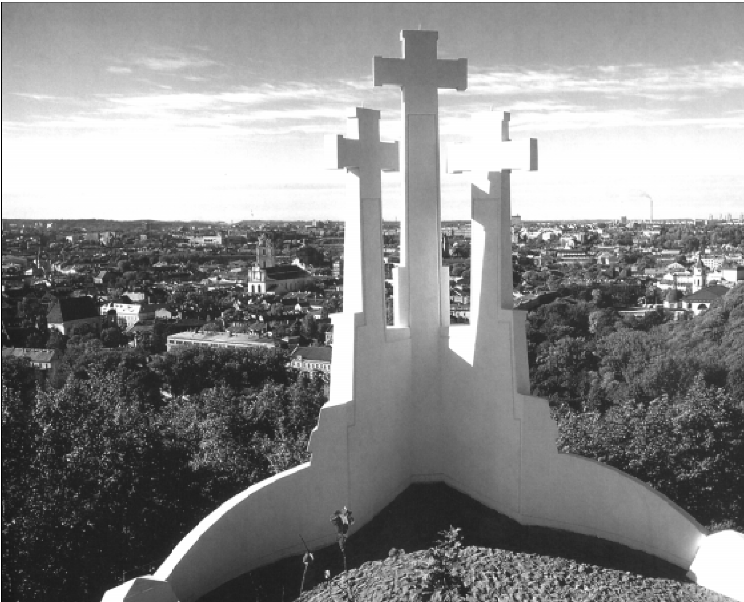
Trijų kryžių paminklas stovi ant vienos iš aukščiausių Vilniaus kalvų.