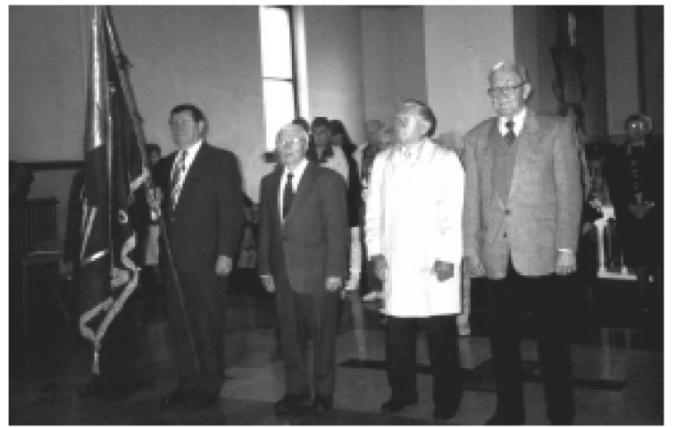
Clevelando ramovėnai su vėliava Šv. Jurgio bažnyčioje.

Su vėliavomis nužygiavus bažnyčion, prie Šv. Sebastijono statulos ir dail. V. Raulinaičio sukurtos paminklinės lentos Žuvusiems už laisvę degė žvakės. Klebonui kun. J.Bacevičiui skaitant pastaraisiais metais mirusių karių pavardes, veteranų posto