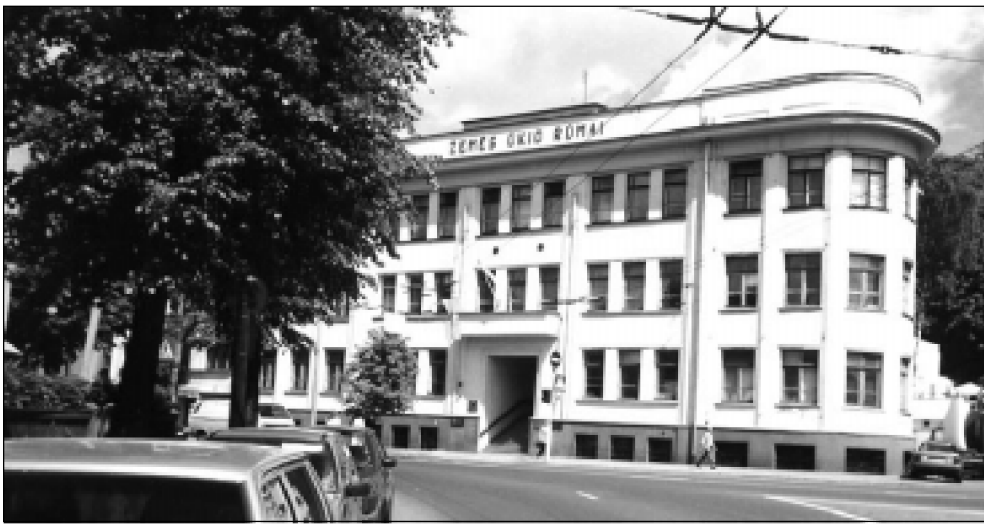
Žemės ūkio rūmai Kaune, Donelaičio gatvėje.