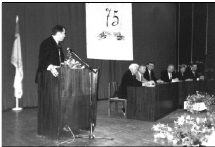
Sveikina Lietuvos Respublikos žemės ūkio ministras Kęstutis Kristinaitis.