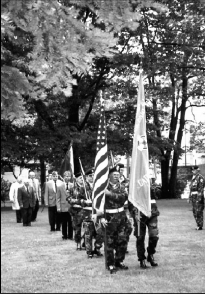
Veteranai ir ramovėnai mirusiųjų dieną Clevelande.