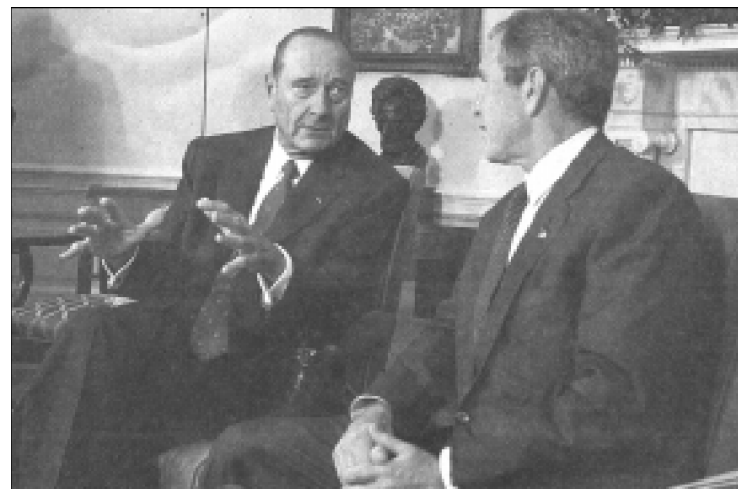
Prancūzijos prezidentas Jacques Chirac, atvykęs į Washingtoną, su prezidentu George Bush aptaria terorizmo problemas.

Nepatogioje padėtyje teroristų atžvilgiu yra ir komunistinė Kinija. Pati Kinijos vyriausybė nekartą kritikavo