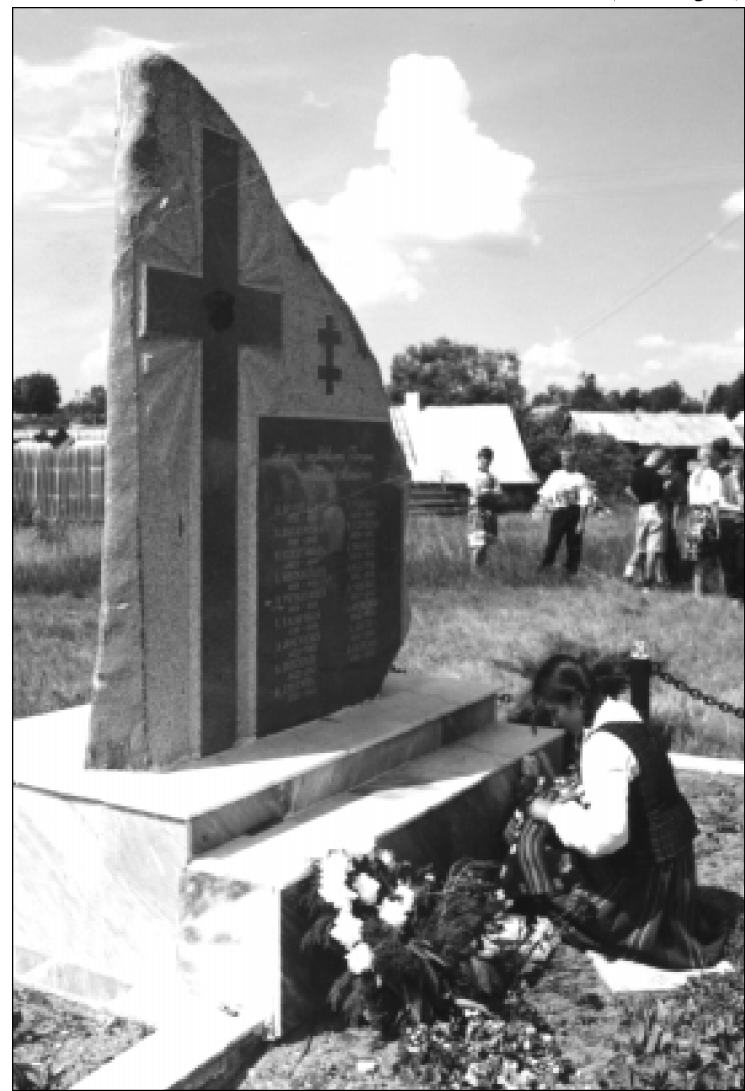
Jaunoji šaulė pagerbia partizanų paminklą Giedraičiuose.