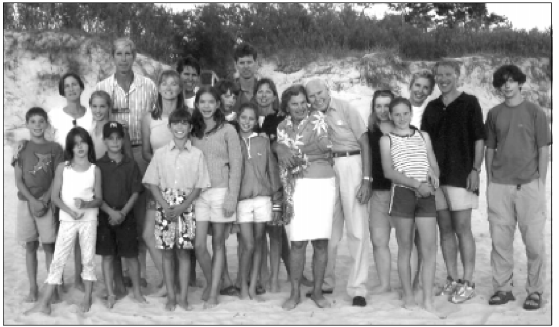
Kazickų šeima: trys sūnūs su žmonomis, duktė su vyru ir vienuolika vaikų.