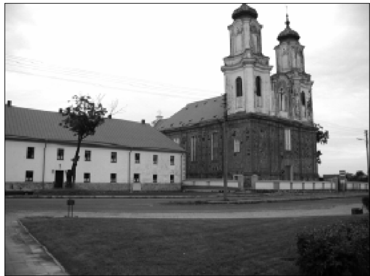
Kėdainių rajono Dotnavos vienuolynas.