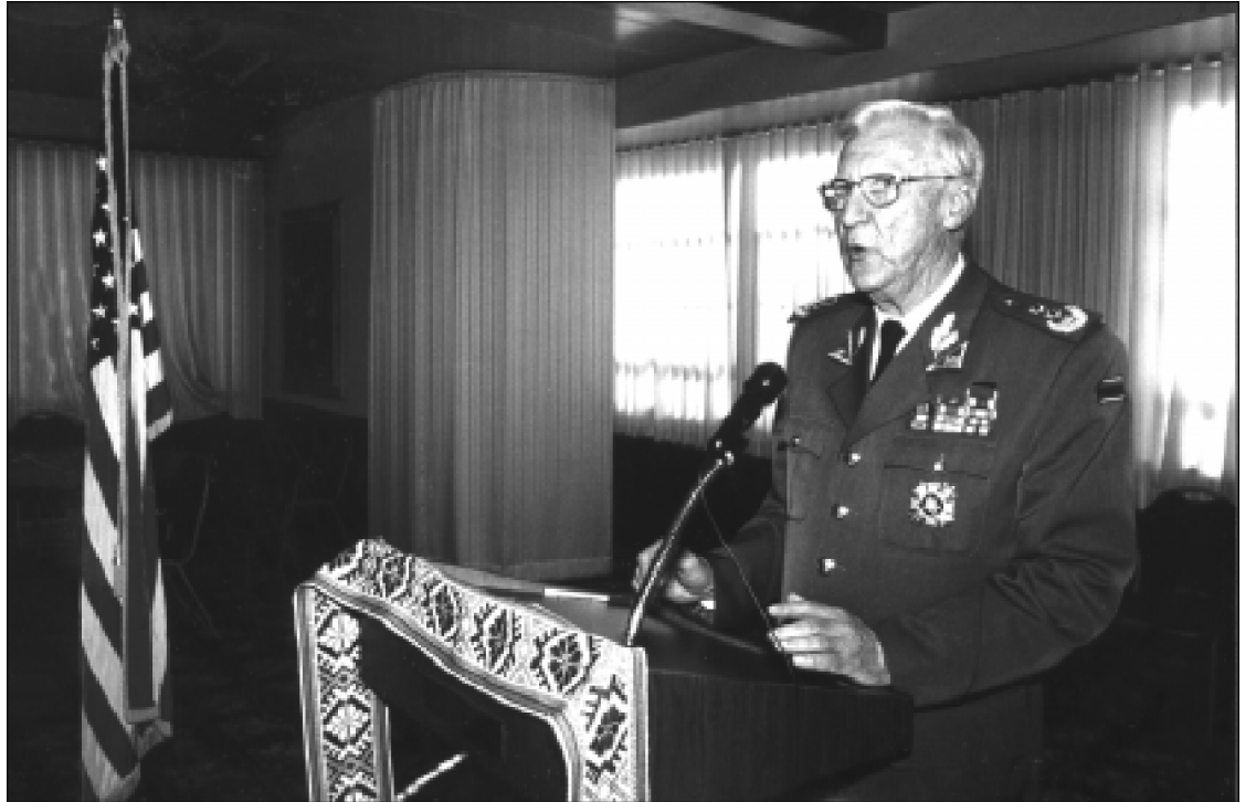
Lietuvos Respublikos Kariuomenės vadas gen. Jonas Kronkaitis kalba Čikagos lietuviams Amerikos Lietuvių tarybos suruoštoje konferencijoje Balzeko lietuvių kultūros muziejuje rugsėjo 29 d., kuriam gausiai susirinkusieji dėkojo audringais plojimais.

Akcentuodamas, jog jo vizija - saugi ir klestinti sąjunga, kurią jungia žmonių šiluma, simpatijos ir dialogas, V.Adamkus palinkėjo, kad Lietuva ir Airija prisidėtų kuriant tokią Europą.