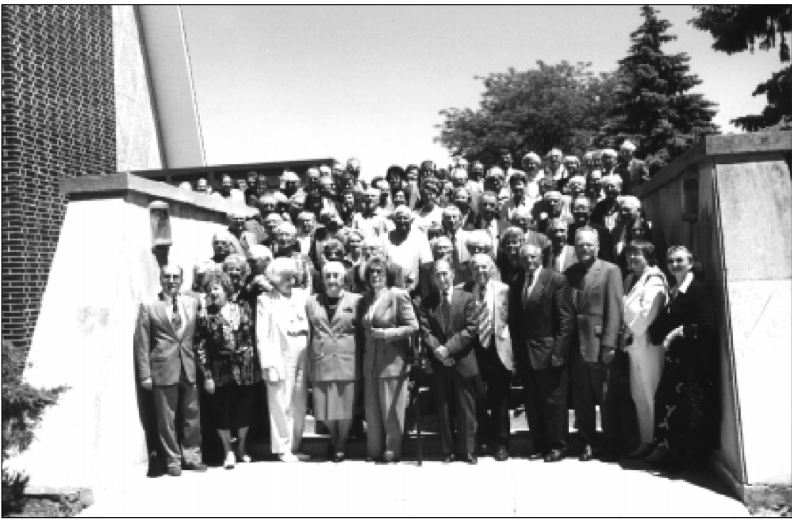
Lietuvių Fondo nariai po sėkmingo suvažiavimo Pasaulio Lietuvių centre Lemonte, Illinois valstijoje.