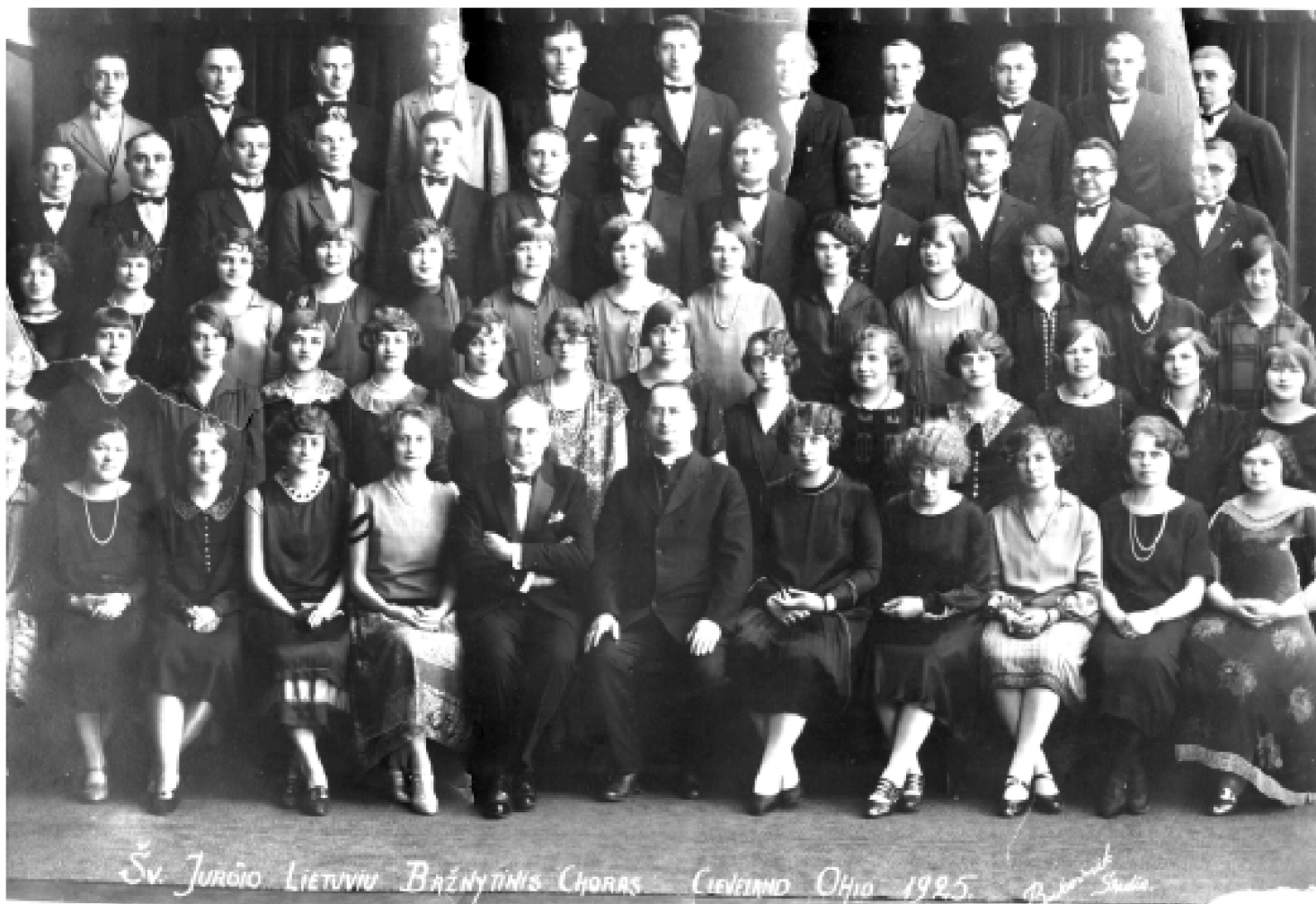
Šv. Jurgio lietuvių bažnytinis choras. Cleveland, 1925 metai.