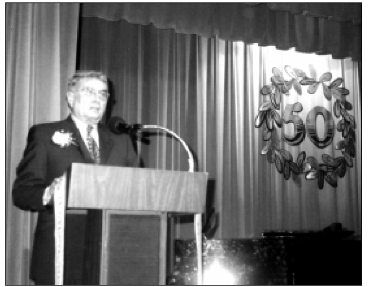
Arvydas Barzdukas apibūdina Lietuvių Bendruomenės viziją ir nueitą kelią per 50 metų.

Tad tuo bendru lietuvių tautos pagrindu ir tokiais