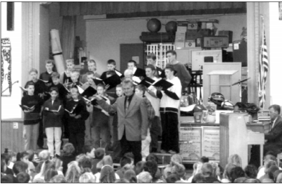
“Ažuoliukas” užbūrė Parma priemiesčio State Road Elementary mokyklos mokinius savo dainavimu. Vėliau dainavo kartu su “Ohio Boys Choir”, kurio vadovas yra Alexander Musichuk.