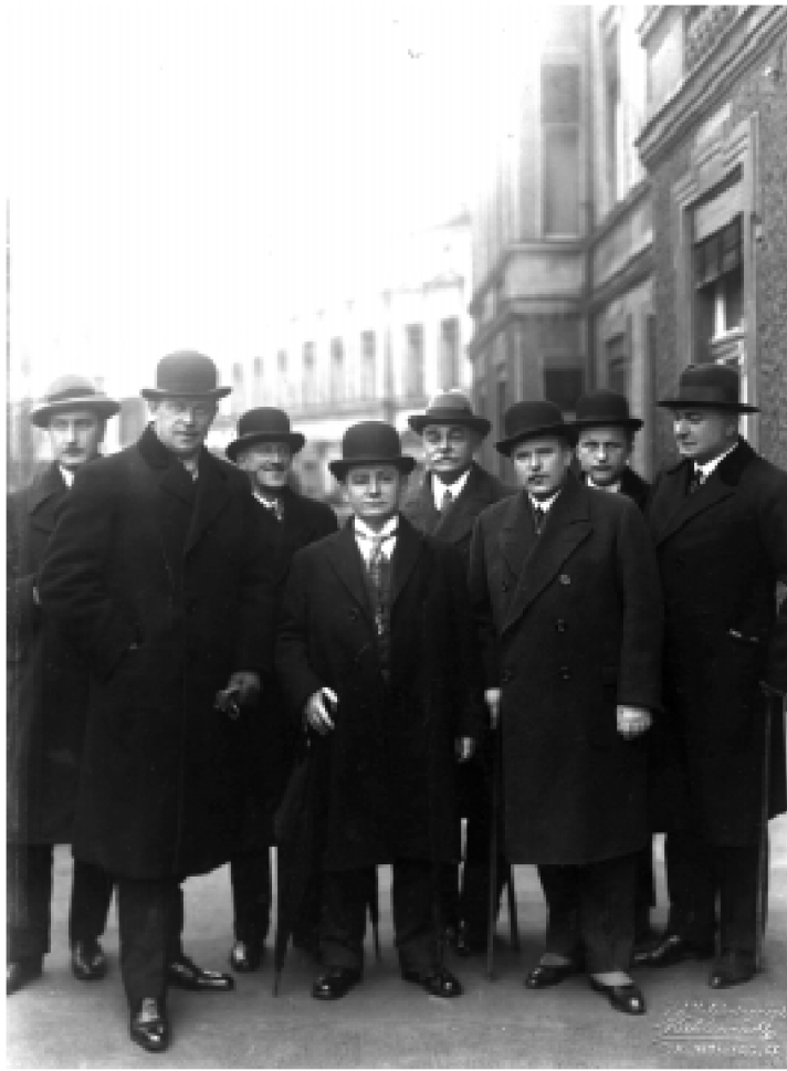
Lietuvos delegacija Lenkijos-Lietuvos deryboms Karaliaučiuje 1928 m.