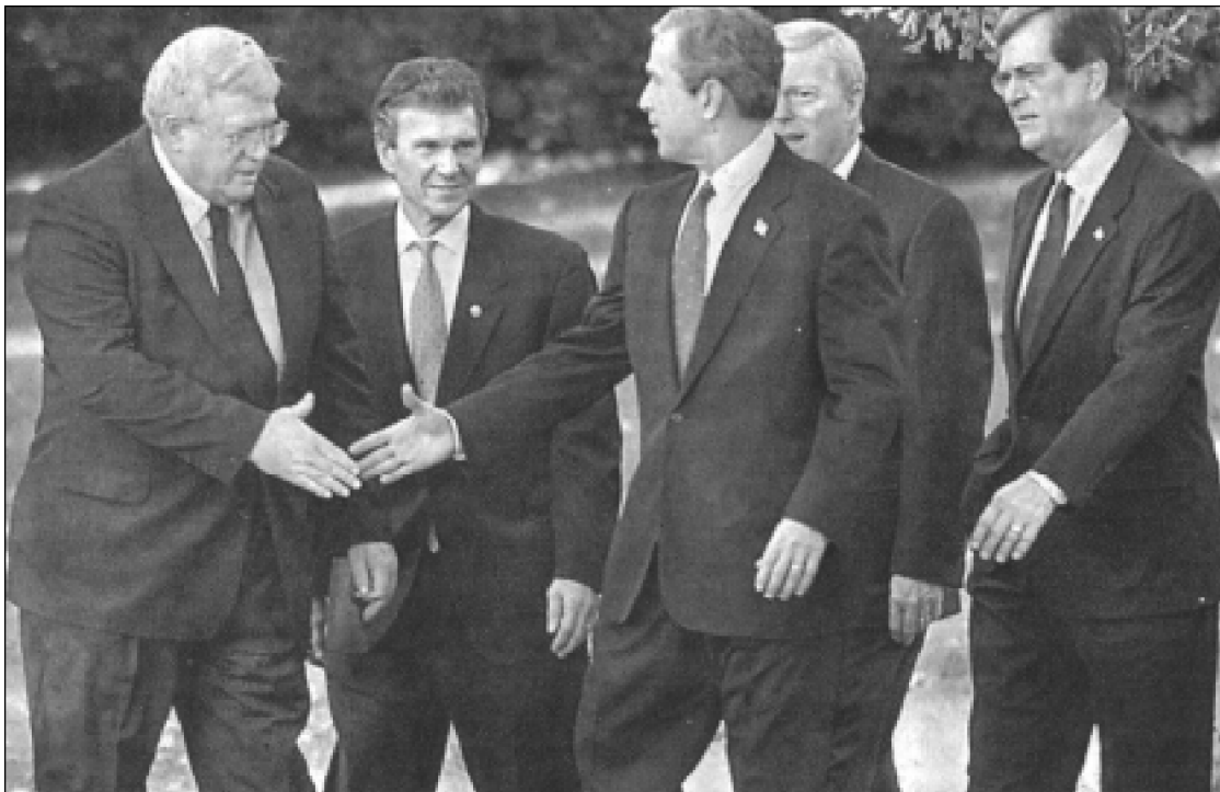
JAV prez. G. Bush sveikinasi su Atstovų rūmų pirmininku J. Dennis Hastert, kai jį pasitiko Kongreso vadai, sugižusį iš pasitarimų Kinijoje. Už jų - sen. Tom Daschle, kongr. Richard A. Gephardt ir sen. Trent Lott.

Amerikos žiniasklaidai svarstant biologinių ginklų problemas, Afganistane toliau daužomi kariniai Taliban fanatikų taikiniai. Dėl paprastų kariniu klaidų, netyčia buvo sunaikintas netoli Kabul miesto buvęs Raudonojo Kryžiaus sandėlis. Žuvo keli afganai tarnautojai. Sunaikinus Tali-