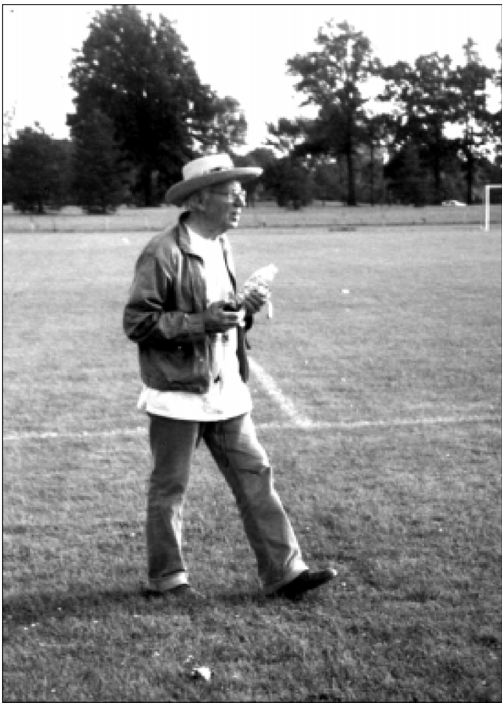
2001 m. lietuvių lengvosios atletikos varžybos jaunučiams įvyko 2001 m. rugsėjo 22 d. Cuyhoga Community College, Western Campus, Parma, Ohio.