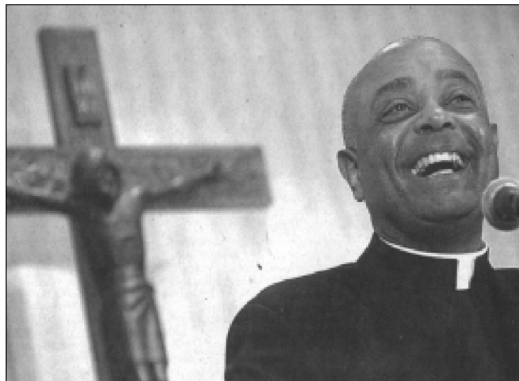
Vyskupas Wilton D. Gregory buvo išrinktas Amerikos vyskupu konferencijos prezidentu.

Rusijos prezidentas apsilankė visiškai privačiame susitikime Texas esančioje Crawford rančioje, kurios dydis 1,600 akrų. Čia JAV prezidentas pats vairavo sunkvežimėlį, parodydamas Putinui savo mėgstamas vietas, kur jis atsipalaiduoja nuo politinių rūpesčių ir įtempimų.