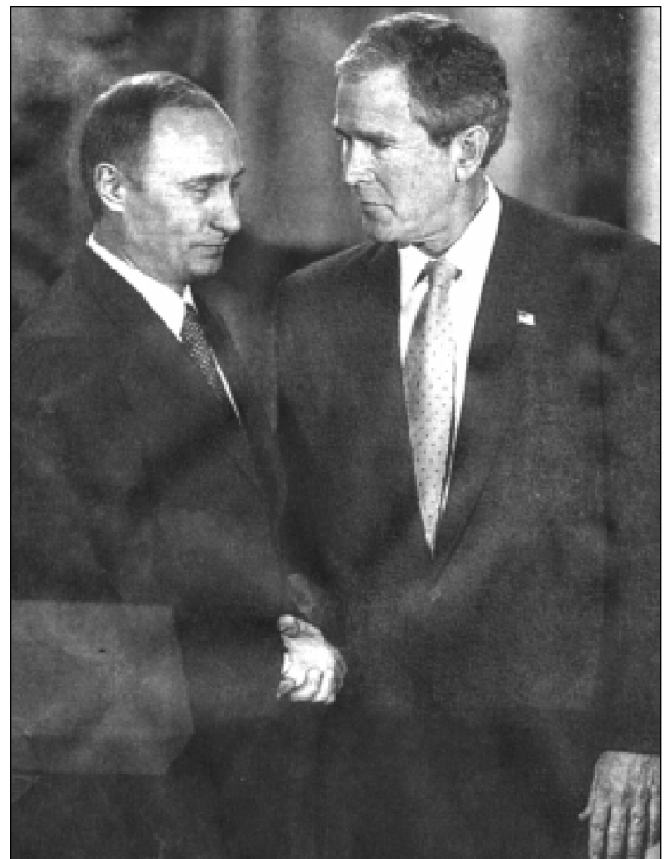
JAV prez. G. Bush ir Rusijos prez. V. Putin diskutavo Afganistano ir nusiginklavimo klausimus.

reikia išlaikant pusiausvyrą. Baltieji Rūmai po Putin vizito pabrėžė, kad šis apsilankymas įrodo, kad draugiški santykiai su Rusija yra įmanomi. Pasikalbėjimai, nors nebuvo formalūs ir protokoluojami, atnešė vilčių, kad kompromisas derybose dėl gincluotės apribojimo yra įmanomas ir bus tęsiamas ateinančių metų pirmuose mėnesiuose, kada prezidentas