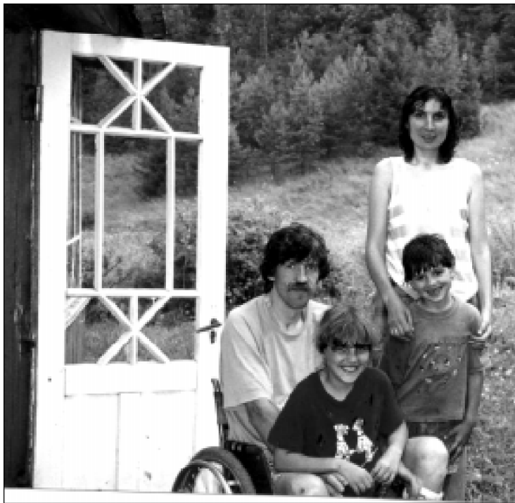
Zavadzkių šeima 2001 m.

Po pokalbio su ambasadoriumi, kitą popietę vyras policijos buvo įkalbėtas nultipti nuo varpinės. Jis nugabentas į ligoninę, nustatinėjama jo asmens tapatybė.