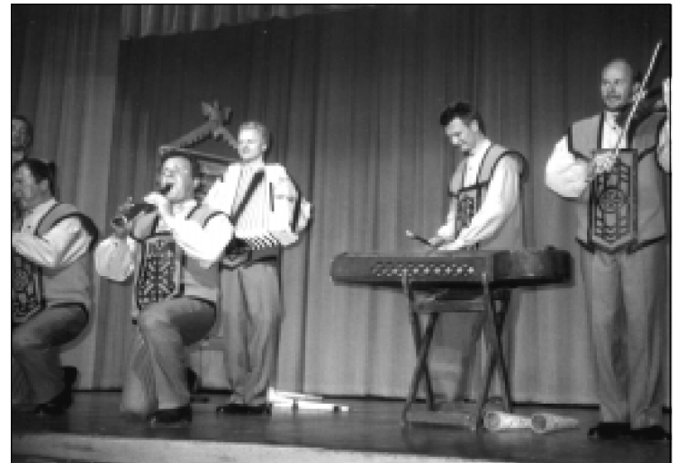
Ansamblis "Ainiai" Clevelande.

Po ilgokos pertraukos prasidėjo antroji programos dalis, kurioje buvo atliekamos senos kaimiškos liaudies dainos su