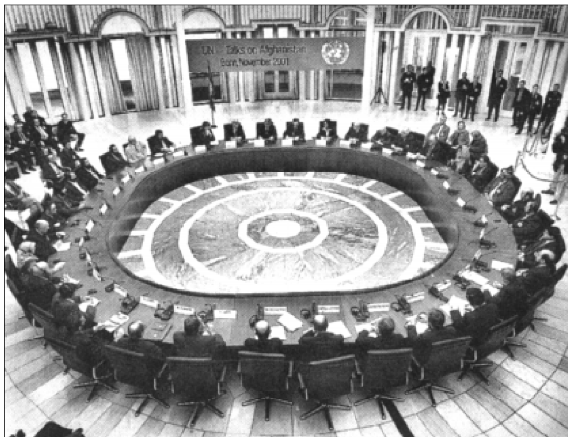
Keturių afganų grupių atstovai tariasi Bonoje dėl vyriausybės sudarymo, kai visas Afganistanas bus išlaisvintas iš talibanų gausos.