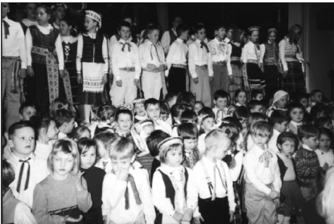
Jungtinės mokyklos choras pasirošęs dainavimui Čikagos lituanistinėje mokykloje.

Kita negerovė, sparčiai besibraunanti į mūsų kalbą, yra neveikiamųjų dalyvių vartojimas ten, kur reikia veikiamųjų arba dar gražiau