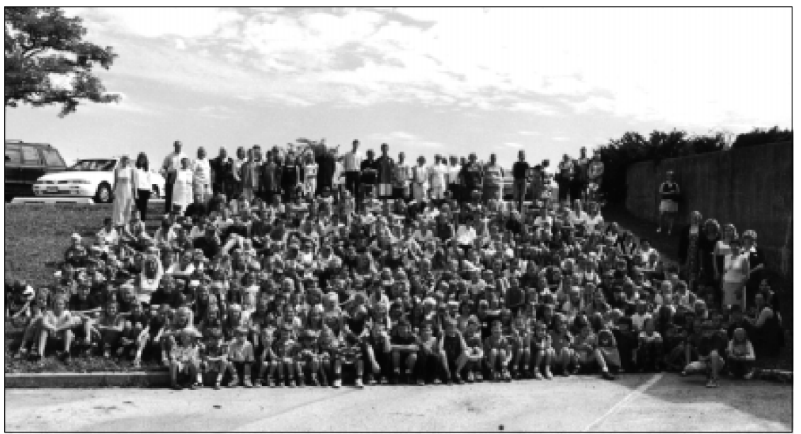
Maironio vardo liuanistinė mokykla Pasaulio lietuvių centre Lemonte 2002-02 mokslo metų pirmąją dieną.

Ryški angļu kalbos prielinksnio for įtaka lietuvių kalbai. For lietuviškai gali būti verčiamas dėl, į nuo, iš, už, kaip, o su linksniuojamu žodžiu dažniausiai nurodo