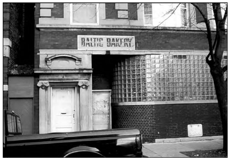
Čikagoje labai populiarūs yra lietuvių kepykla “Baltic Bakery”. Ji kepa įvairių rūšių duoną, jų tarpe ir “Bočių duoną”, primenančią Lietuvos duonų skonį.

Key negalvojo, kad fortas galės išlaikyti tą baisų bombardavimą. Ir koks buvo jo džiaugsmas, kai pakilus ryto miglai, jis rytiniame horizonte, kartu su tekančios saulės spinduliais, išvydo ne “Union Jack” (Anglijos vėliavą), bet virš forto išdidžiai plazdančią didžiulę Amerikos vėliavą (“gave proof that our flag was