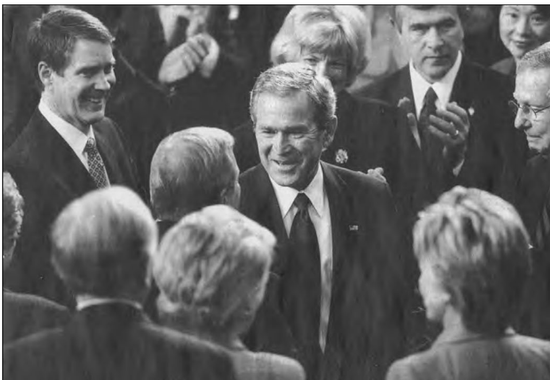
JAV prez. G. Bush, baigęs savo "State of the Union" kalbą, sveikina su Illinois valstijos senatoriumi Dick Durbin, kuris sako, kad yra dalykų, kuriuose demokratai gali sutarti su respublikonais.