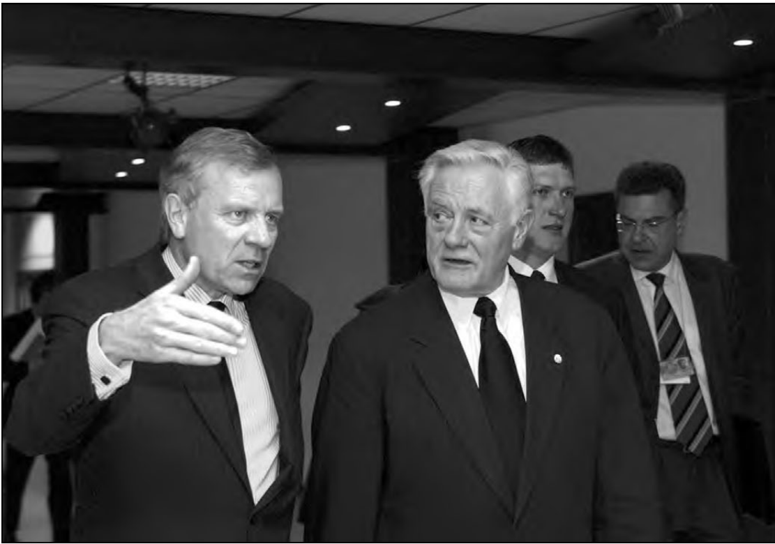
Kai Lietuvos Respublikos prezidentas Valdas Adamkus lankėsi NATO centre, buvo NATO vyriausiojo viršininko Jaap de Hoop Scheffer svečias ir turėjo su juo svarbius pasitarimus.