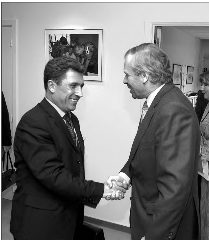
Lietuvos Užsienio reikalų ministrą Antaną Valionį sveikina NATO vyriausiasis viršininkas Jaap de Hoop Scheffer.

Rusija paskyrė tarpvyriausybines komisijas su Lietuva pirmininką - juo tapo susisiekimo ministras Igor Levitin. Po 2004 metų kovo mėnesį vykusio Rusijos vyriausybės reorganizavimo iš pareigų buvo atleistas ankstesnis šios komisijos pirmininkas susisiekimo ministras Sergej Frank ir beveik metus komisija neturėjo bendrapirmininkio. Iš Lietuvos pusės komisijai vadovauja užsienio reikalų ministras Antanas Valionis.