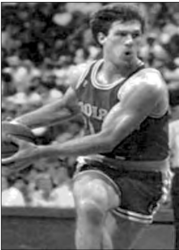
Šarūnas Marčiulionis – pirmasis Lietuvos krepšininkas, žaidęs NBA krepšinio lygoje.