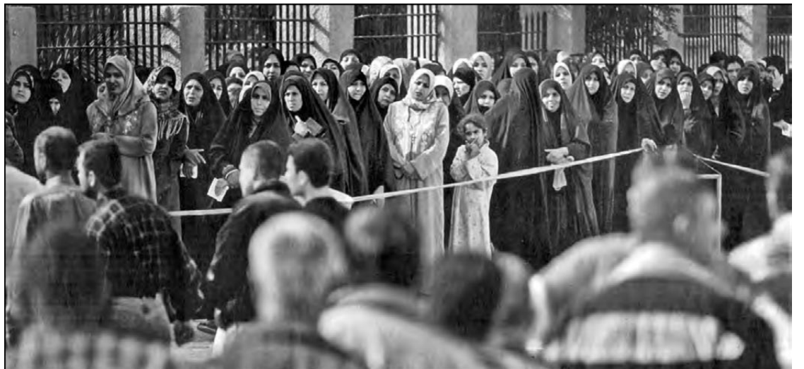
Irako moterys ir vyrai sausio 30 d. skirtingose eilėse pirmą kartą balsavo Basra mieste.

Sausio 25 dieną Irake prasidėjo demokratinis balsavimas. Jo uždavinys išrinkti Nacionalinę Asamblėją iš 275 žmonių. Jie sudarys 18 provincijų parlamentą. Tas parlamentas išrinks Irako prezidentą ir du jo pavaduotojus. Parlamentas parinks vyriausybės narius. Svarbiausias parlamento uždavinys bus sukurti valstybės Konstituciją. Jei viskas eis sklandžiai, valstybės konstitucija bus pasiūlyta visiems balsuotojams, kurie praves lyg referendumą, kuris tvirtins visą santvarką. Lig šiol jau susitarta, kad įvairios politinės partijos sudarė politinių vadovų 111 sąrašą, kurie tapo dabartinių veikėjų kandidatai į parlamentą. Sąrašų vadovai nustatė, kad dabar renkamų partijų dalis, visas ketvirtadalis visų narių privalo būti moterys. Šitas klausimas buvo išspręstas dalyvaujant amerikiečiui diplomatiui Paul Bremer. Svarbiausi balsavimai vyks ne visose provincijose, bet keturiose: Anwar, Bagdade, Ninevah ir Salahadin. Jau susitarta, kad tarp kandidatų svarbiausi sąrašai turėtų būti: šiitų 228 žmonės, kuriems vadovauja Didysis Ajatola Ali al Sistani. Tai vyriausioji Isla-