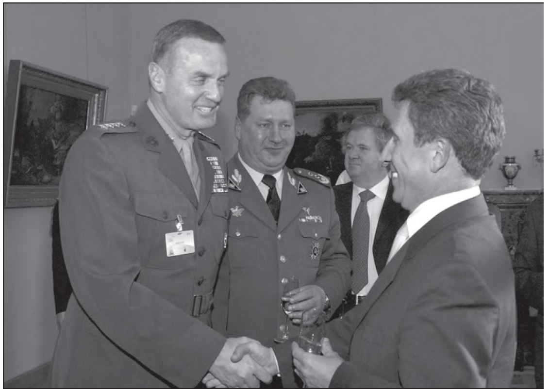
Generolas James Jones, vyriausiasis NATO karinių pajėgų viršininkas, ir Lietuvos Užsienio reikalų ministras Valionis NATO konferencijos metu Vilniuje.

Prezidentas Vladas Adamkus viliasi, kad Vilniuje vykęs NATO valstybių užsienio reikalų ministrų susitikimas sustiprins transatlantinius ir europinės vienybės jausmus Lietuvos visuomenėje. Vilniuje pasibaigus neformaliam NATO užsienio reikalų ministrų susitikimui, Prezidentas V. Adamkus priėmė NATO generalinį sekretorių Jaap de Hoop Scheffer. Pasak V. Adamkaus, Lietuvai buvo didelė garbė ir atsakomybė būti šio svarbaus NATO renginio šeiminke.