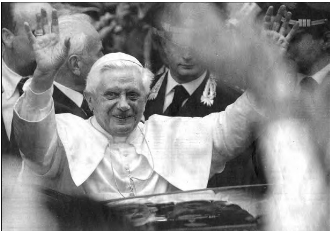
Popiežius Benediktas XVI pirmą kartą aikštėje pasirodo miniai ir dėkoja už sveikinimus.

Lietuvių grįžimo į tėvynę informacijos centras