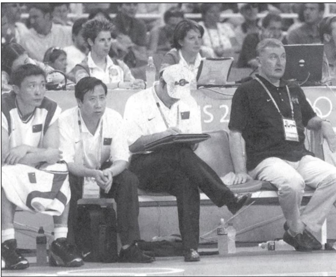
Jonas Kazlauskas (dešinėje) pasirašė sutartį treniruoti Kinijos krepšinio rinktinę 2008 metų olimpiadai Pekine.