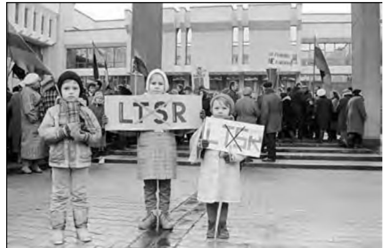
1990 m. kovo 11-ąją pritarti Lietuvos Nepriklausomos valstybės atkūrimo aktui vilniečiai susirinko į mitingą Nepriklausomybės aikštelėje.