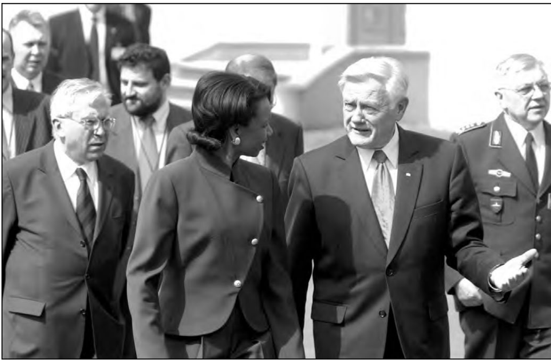
JAV Valstybės sekretorė Condoleezza Rice ir Lietuvos prezidentas Valdas Adamkus NATO ministrų suvažiavimo metu Vilniuje.