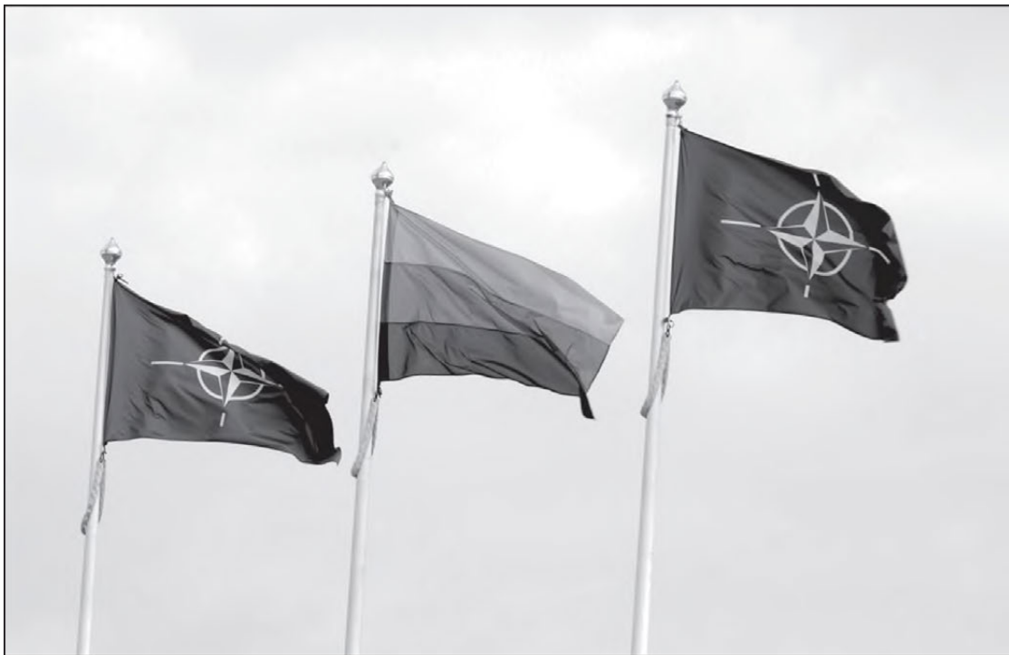
NATO ir Lietuvos Respublikos vėliavos plėvesuoja Vilniuje.