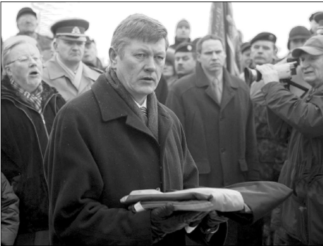
Lietuvos Seimo pirmininkas Artūras Paulauskas Vėliavų pakėlimo iškilinėse Gedimino kalno pilies bokšte: Naujieji metai - Laisvės gynėjų atminimo šventė.