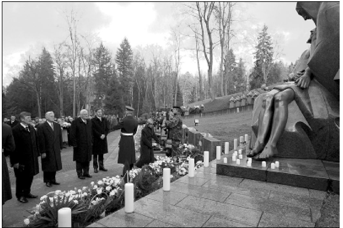
Sausio 13-osios aukų pagerbimas Antakalnio kapinėse 2005 m. sausio 13 d.

Lietuva aktyviai remia naujosios Ukrainos politinės vadovybės tikslus integruoti šalį į vakarietiškas euroatlantines struktūras ir sumažinti priklausomybę nuo Maskvos. LGITIC