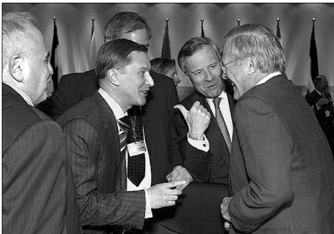
Rusijos Gynybos ministras Sergey Ivanov kalbasi su NATO Generaliniu sekretoriumi Jaap de Hoop Scheffer ir JAV Gynybos sekretoriumi Donald Rumsfeld NATO-Rusijos gynybos ministrų pasitarime Niroje, Prancūzijoje.