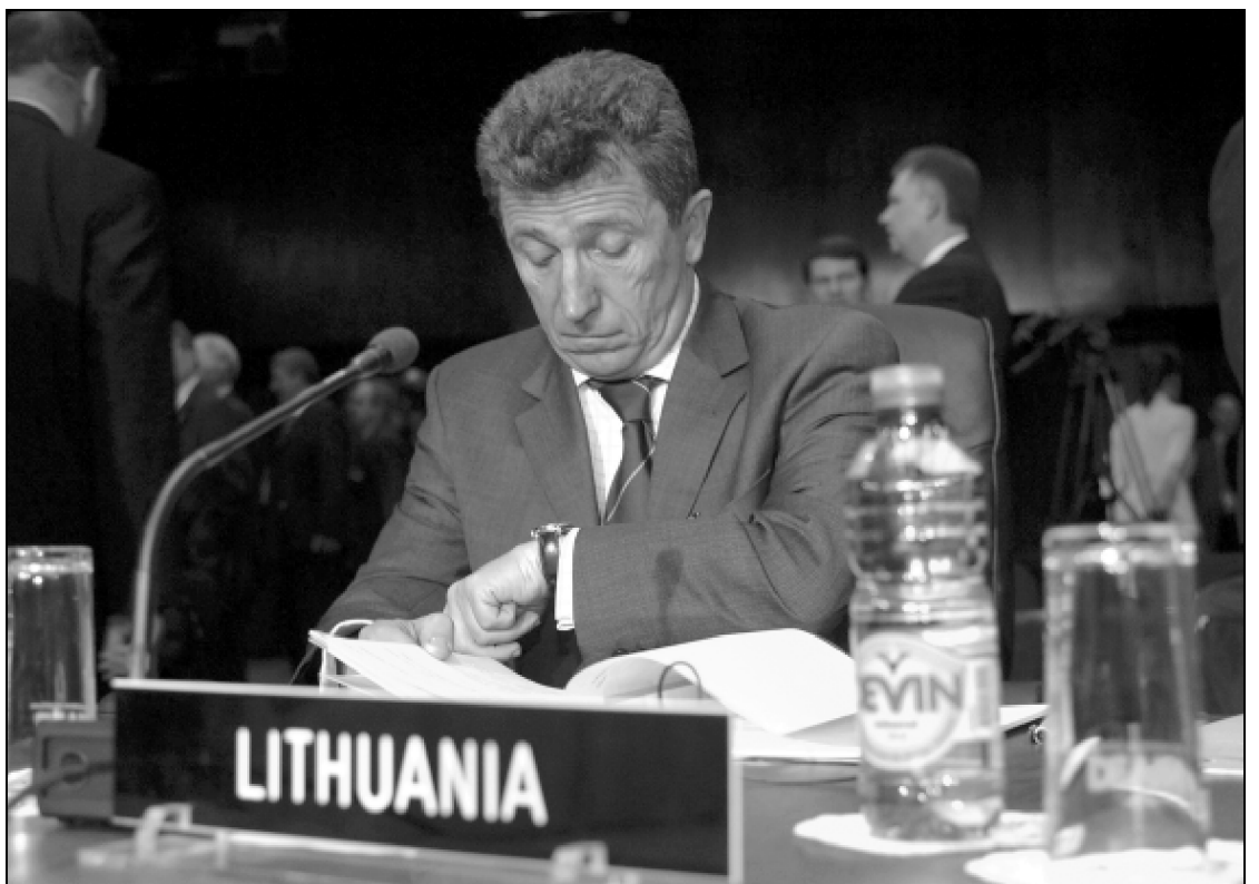
Lietuvos Respublikos I. užsienio reikalų ministras Antanas Valionis.

Ši citata iš vieno 2005-ųjų balandį įvykusio Seimo plena-rinio posėdžio – bene labiausiai apibūdinanti A. Brazausko - premjero credo. Ir tuo pat metu – didžiausia mįslė. Kas tai