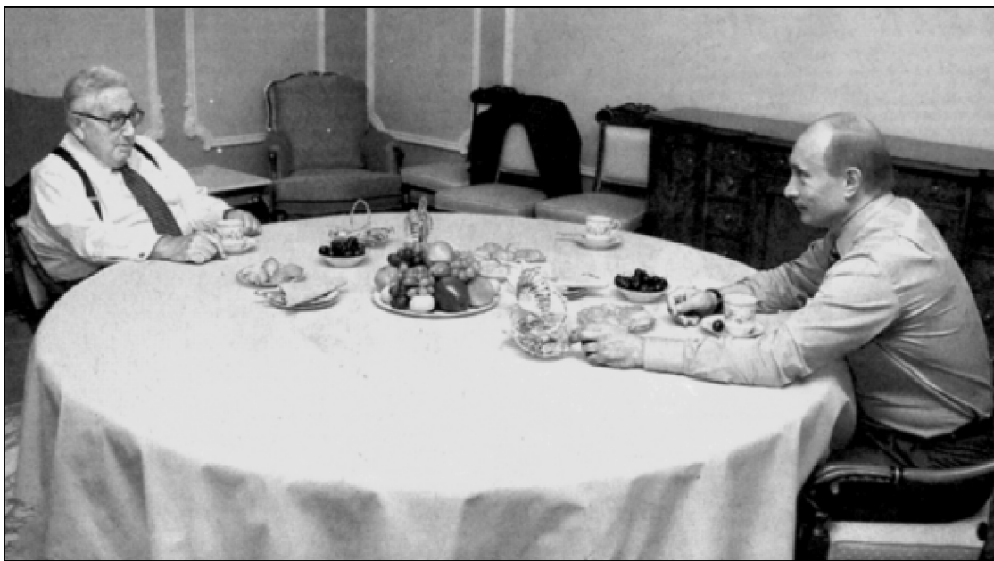
Rusijos prez. Vladimir Putin savo vasaros namuose kalbėjosi su buvusiu JAV sekretoriumi Henry A. Kissinger (kairėje) įvairiais užsienio politikos klausimais. Nepaisant skirtingų nuomonių dėl Irano branduolinės sistemos, Rusijos prezidentas pareiškė, kad su JAV gali bendradarbiauti ir pasiekti kompromisų.

Lietuvių grįžimo į tėvynę informacijos centras