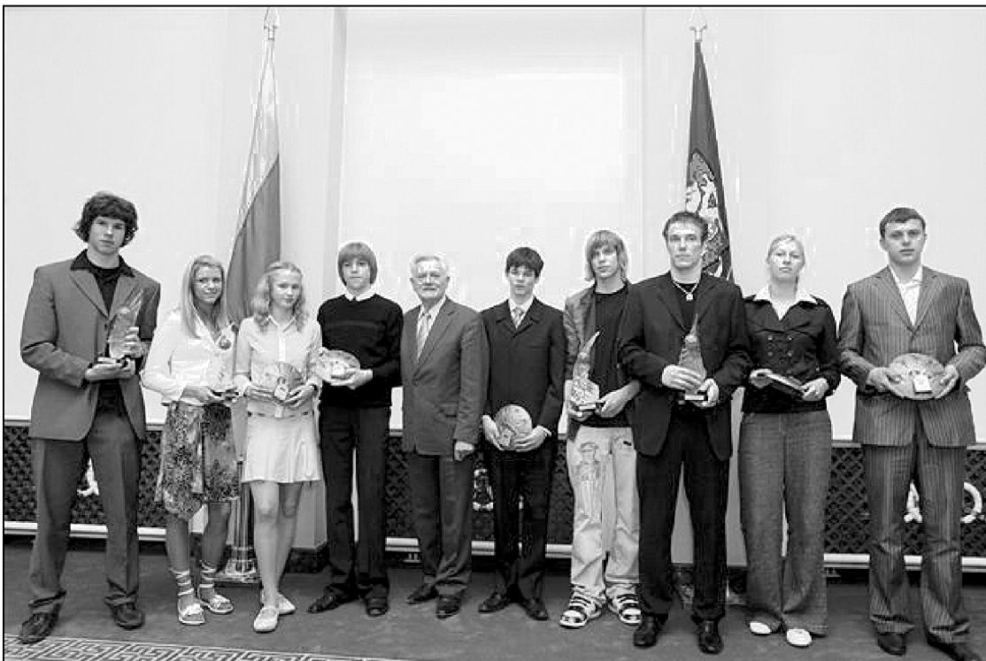
Lietuvos prez. Valdas Adamkus dalyvavo Lietuvos moksleivių krepšinio lygos (MKL) čempionų pagerbimo ceremonijoje. www.president.lt