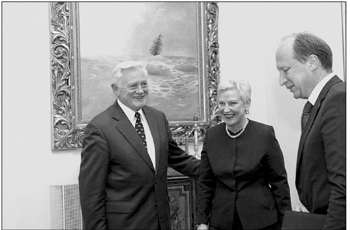
Tėvynės sąjungos partijos vadovai – Andrius Kubilius (dešinėje) ir Gražina Degutienė pas prezidentą Valdą Adamkų aptarė Vyriausybės krizę.

Prieš 65 metus Sovietų Sąjunga įvykdė pirmąjį masinį žmonių trėmimą iš Lietuvos. Trėmimai prasidėjo 1941 m. birželio 14 d., 3 val. ryto. Birželio 14-18 d. iš Lietuvos išvežtų žmonių skaičius maždaug buvo 18,500, o iš viso 1941-1952 m. buvo ištremta maždaug 132,000 žmonių, iš kurių 28,000 žuvo. Į GULAG'o lagerius 1944-1952 m. išvežta maždaug 143,000. Per 50 sovietinės okupacijos metų lietuvių tautą okupantas sužalojo taip žiauriai, kad ir šiandien daugelis negalvoja, kaip sustiprinti savo valstybę, bet kaip iš jos sau daugiau gauti – pasiglemžti. Gal reikės biblijinio keturiasdešimties metų, kai nebeliks okupacijos sužalotų kartų, kad mūsų tautoje sumažėtų liūdesys dėl tautos genocido.