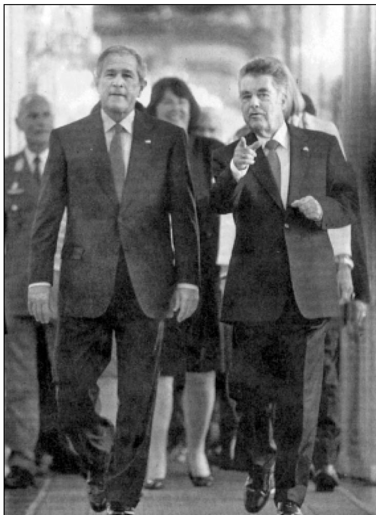
JAV prez. George Bush su Austrijos prez. Heinz Fischer Vienoje, kurioje dalyvavo Europos Sąjungos vadovų konferencijoje, norėdamas išaiškinti Amerikos užsienio politikos tikslus.

JAV kariuomenė birželio 23 d. pranešė per patikrinimus Irake sulaikiusi svarbų "al Qaeda" padalinio šioje šalyje narį ir dešimtį kitų įtariamų "teroristų". Pasak jos, "al Qaeda" narys ir dar trys kovotojai buvo suimti į pietvakarius nuo Baakubos.