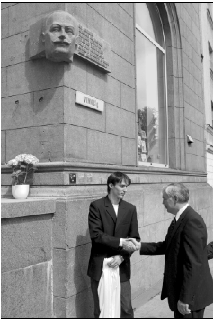
Birželio 12 d., Vilniuje, buvusioje Vyriausybės rezidencijos vietoje atidengtas bareljefinis paminklas valstybininkui Mykolui Slezevičiui, Lietuvos II Vyriausybės (1918–1919) vadovui įamžinti.