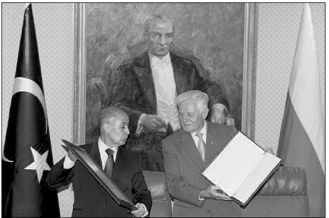
Birželio 20 d. Turkijoje Lietuvos Respublikos prezidentas Valdas Adamkus ir Turkijos Respublikos prezidentas Ahmet Necdet Sezer.

Šengeno sutarties grupei priklauso dauguma ES senbuvų. Prieš du dešimtmečius pasirašytas susitarimas numato, kad Šengeno zonai priklausančios šalys atsisako piliečių, kertančių šių valstybių sienas, imigracinės kontrolės.