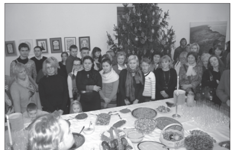
Kalėdos Sankt Petersburg, Rusijoje.