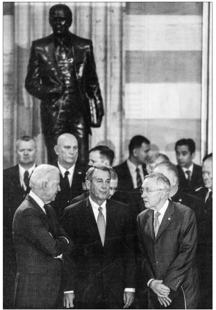
Demokratų partijos vadai - JAV viceprezidentas Joseph R. Biden, Jr., kairėje, Senato daugumos pirmininkas sen. Harry Reid, dešinėje, bando įtikinti Atstovų rūmų pirmininką respublikoną John A. Boehner, centre, kad sutiktų su jų programa didinti mokesčius ir nemažinti išlaidų.

JAV prezidentas jiems skambino prieš išvykdamas iš Havajų, kur šventė Kalėdas, į Washington. Šie pokalbiai vyko tuo metu, kai nesimaitė pažangos iki gruodžio 31-osios siekiant išvengti vadinamojo „fiskalinio skardžio“. Amerikiečiams nuo sausio 1 dienos gresia didelis mokesčių didinimas ir išlaidų apkarpymas, jeigu Kongresas ir Baltieji rūmai iki metų pabaigos neras kompromiso.