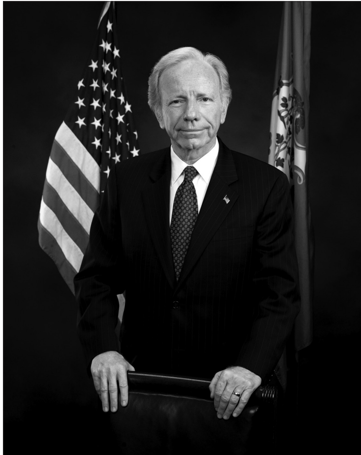
JAV senatorius Joseph I. Lieberman, atstovavęs Connecticut valstijos gyventojams 24 metus, pasitraukė iš Senato gruodžio 12 d. Atsisveikinimo kalboje pareiškė: „Aš nesakau, kad aš neklydau, bet visada buvau už JAV gerovę, o apie mano darbus tereprendžia Dievas ir istorija“. Mums telieka prisiminti, kad jis Senate dažnai pasisakydavo už Lietuvos laisvės reikalus.

JAV vyriausybė pasiekė Kongreso numatytą didžiausią 16,39 trln. dolerių skolinimosi ribą 2012 m. gruodžio 31 d., paskelbė išdo sekretorius Timothy Geithner.