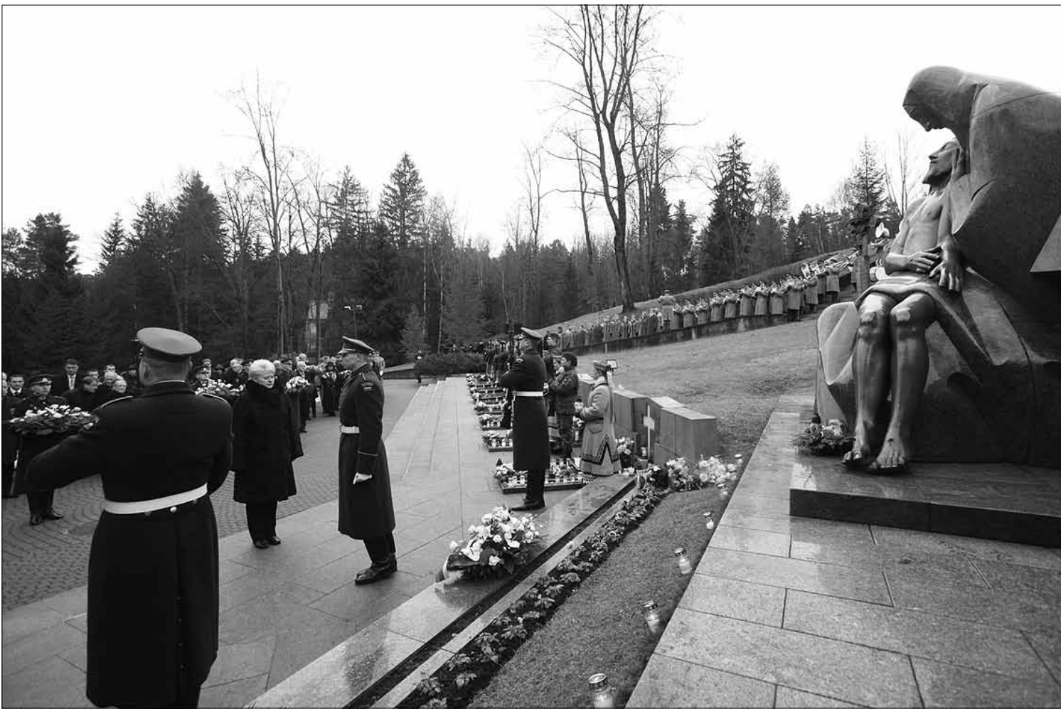
Lietuvoje minimos kruvinųjų Sausio 13-osios įvykių 21-osios metinės. Žuvusiųjų pagerbimas Antakalnio kapinėse.