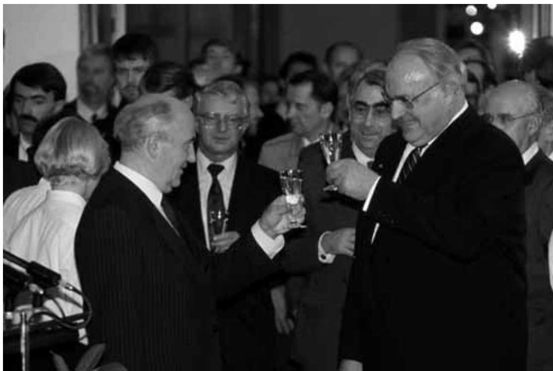
Sovietų Sąjungos vadovas Michail Gorbačiov (k.) apie galimą jėgos panaudojimą Vilniuje 1990 metų sausį iš anksto kalbėjosi su Vokietijos kancleriu Helmut Kohl.

Taigi lakoniškai, lyg kalbėtų apie orą, N.Gorbačiovas ir H.Kohlis be jokio jaudulio