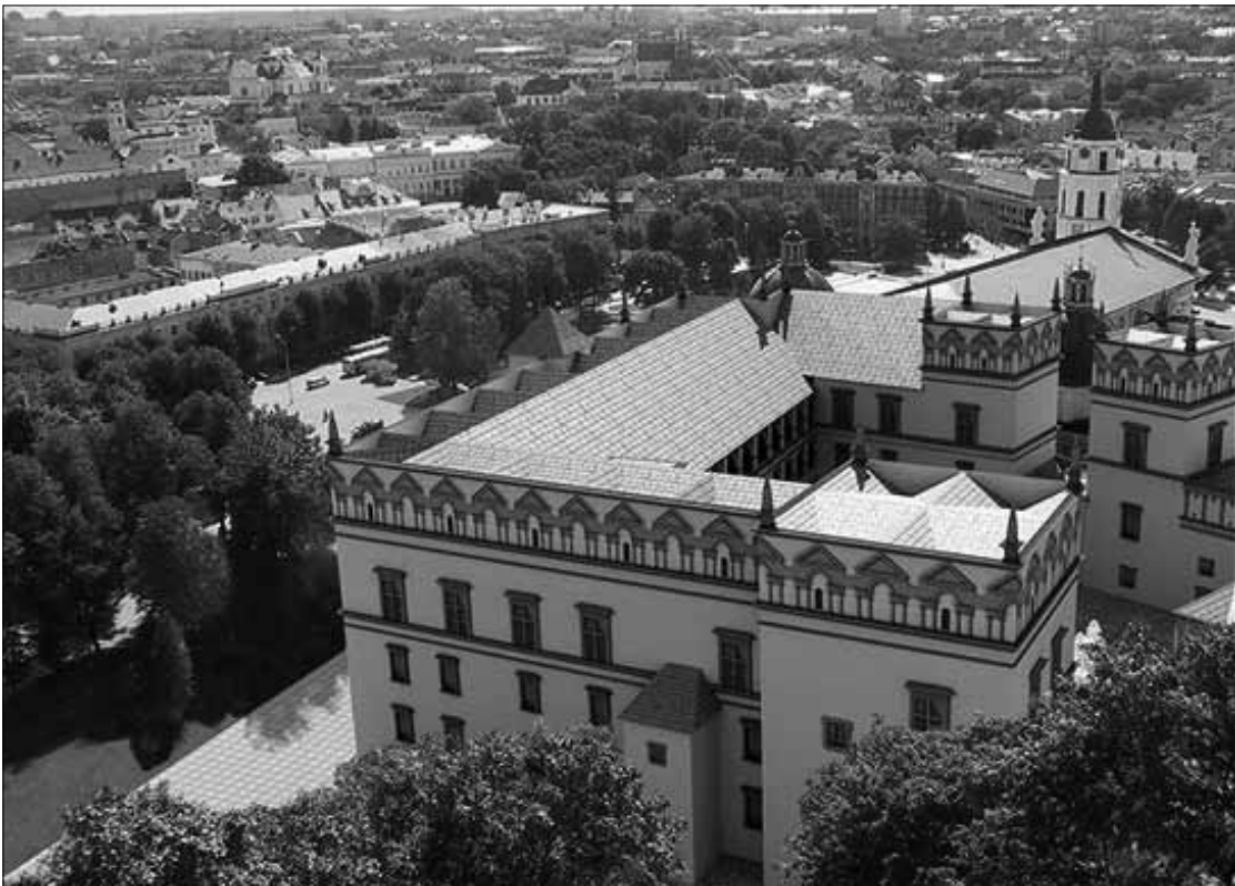
Lietuvos Didžiosios Kunigaikštystės valdovų rūmai Vilniuje.