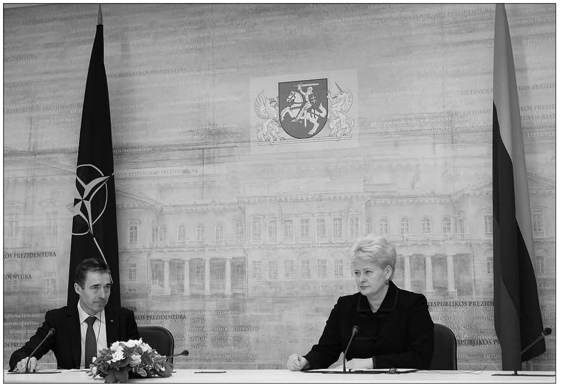
Lietuvos Respublikos Prezidentė Dalia Grybauskaitė tarėsi su Lietuvoje viešiniu NATO generaliniu sekretoriumi Anders Fogh Rasmussen. Po pasitarimo įvyko bendra Lietuvos ir NATO vadovų spaudos konferencija.