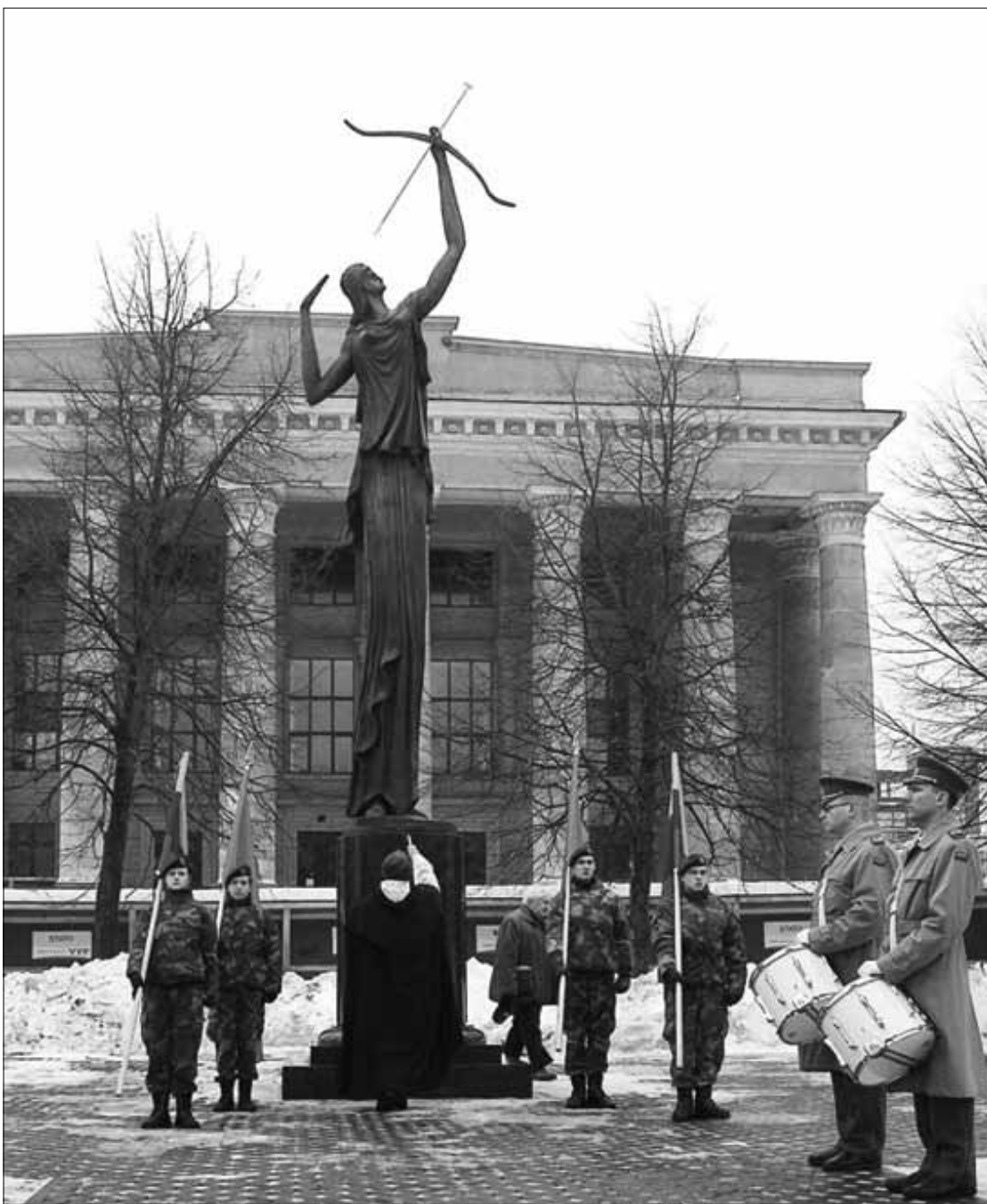
Kovo 11-ajai skirto paminklo „Žinia“ atidengimas 2011 m. sausio 8 d.