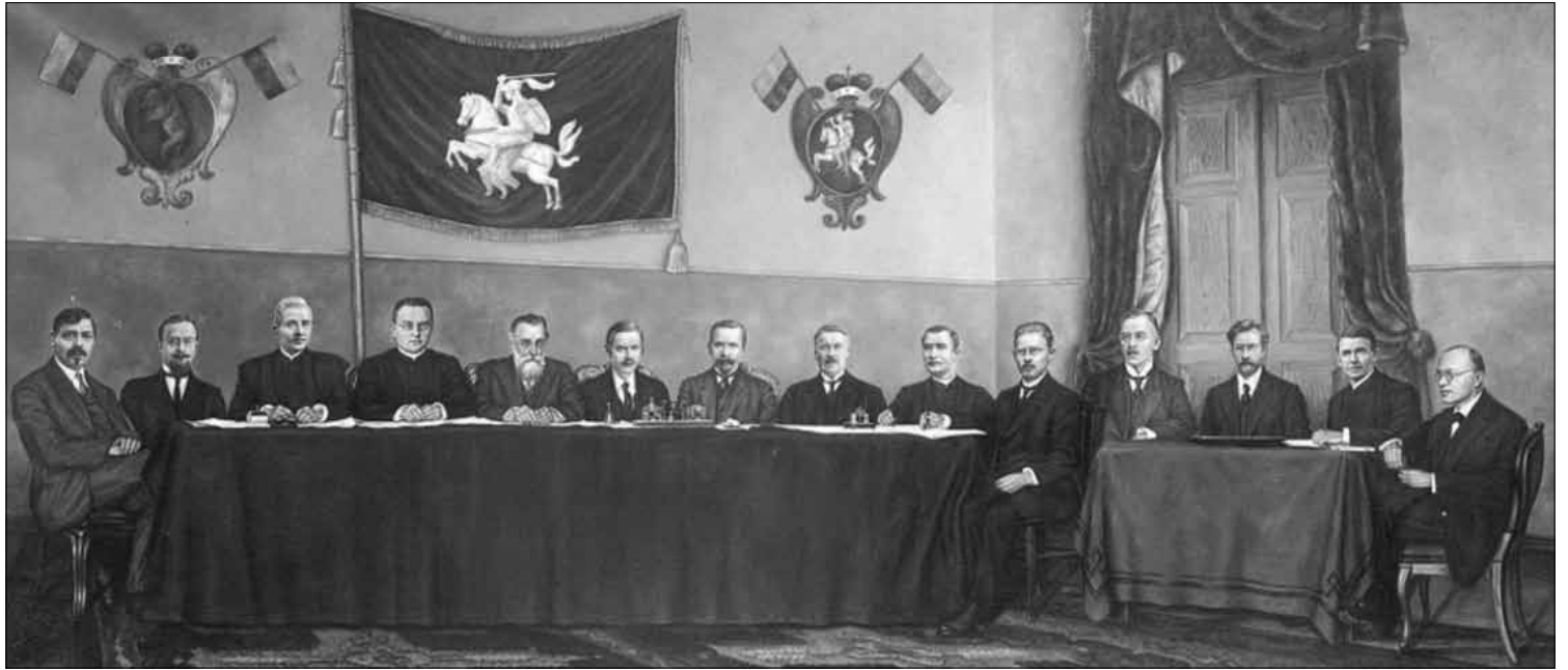
Lietuvių konferencijos, 1917 m. rugsėjo 18-22 d. Vilniuje išrinkusios Lietuvos Tarybą, prezidiumas ir sekretoriatas. Iš kairės: Feliksas Bugailiškis, Kazimieras Bizauskas, Kazimieras Šaulys, Justinas Staugaitis, Jonas Basanavičius, Steponas Kairys, Antanas Smetona, Jonas Vileišis, Povilas Dogelis, Juozas Paknys, Jurgis Šaulys, Mykolas Biržiška, Juozas Stankevičius, Petras Klimas.

1917 metų gruodžio 11 dieną, Lietuvoje dar tebešeimininkaujant okupacinei Vokietijos kariuomenei, šeši Lietuvos Tarybos nariai: Antanas Smetona, Jurgis Šaulys, Stanislovas Narutavičius, Jonas Vileišis, Jonas Smilgevičius ir Aleksandras Stulginskis atvyko į Kauną su ypatinga misija - įteikti okupacinės valdžios atstovams dokumentą, dėl kurio išvakarėse beveik iki pusiaunakčio virė įnirtingos diskusijos. S.Narutavičius ir J.Vileišis į Kauną tikriausiai keliavo sunkia širdimi - jie, kaip ir socialdemokratas Steponas Kairys, vakarykščiame posėdyje kiek įmanydami priešinosi tokio dokumento priėmimui, tačiau liko mažuma. Galima sakyti, kad šio dokumento rengimas ir svarstymas, o ir viskas, kas vyko iki pat vasario 16-osios, jau tuomet išryškino dvi lietuviškos politikos tendencijas, išlikusias ir iki šių dienų. Viena jų - „realistinė“ arba „pragmatiška“, atsižvelgianti į to momento naudą ir konjunktūrą. Antroji - „romantišnė“, kuriai svarbesnė idėja ir moralinis pamatas.