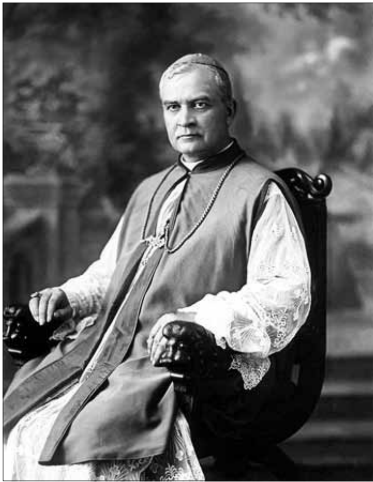
Palaimintasis arkivyskupas Jurgis Matulaitis. 2012-iejį paskelbti Palaimintojo Jurgio Matulaičio metais.