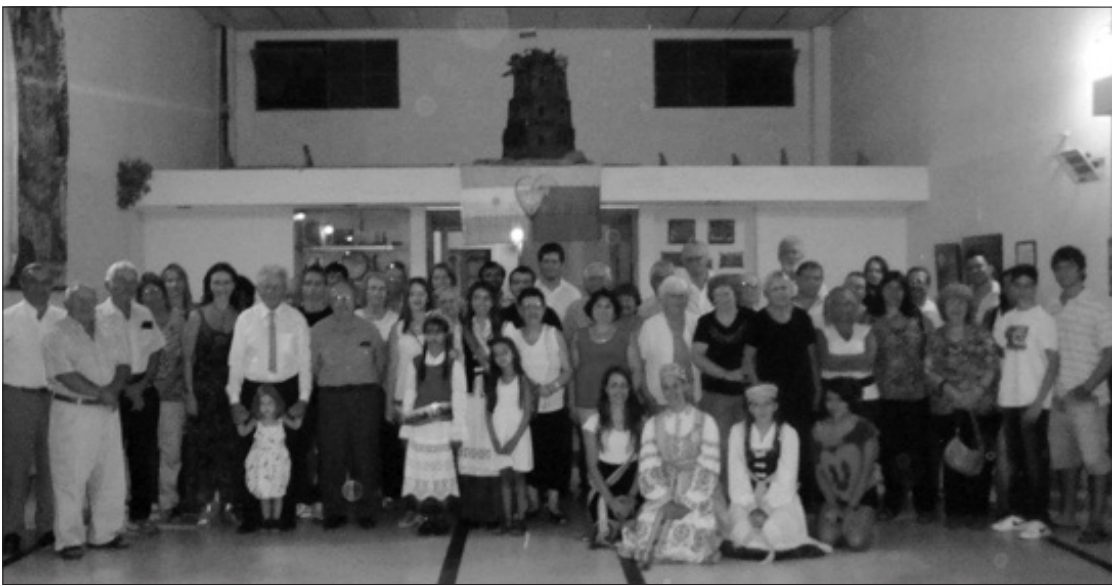
Argentinios lietuvių bendruomenė šventė Vasario 16-ąją.