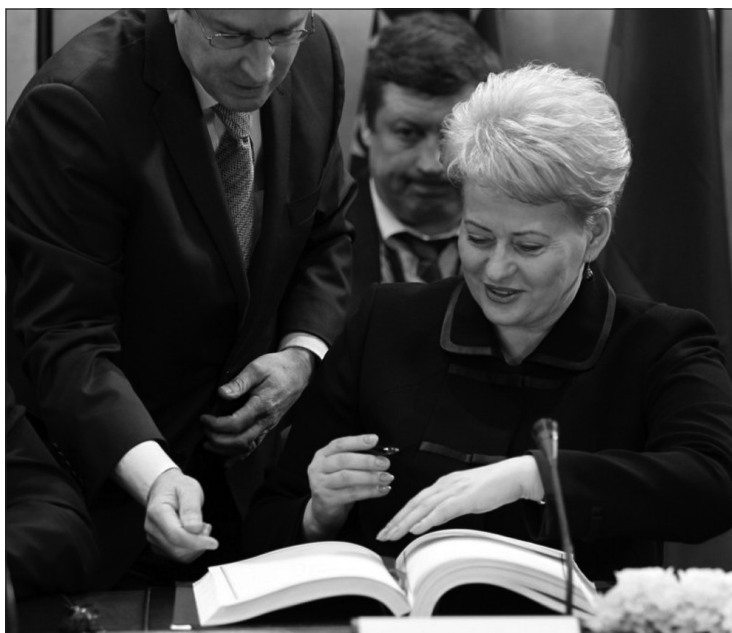
Lietuvos Respublikos prezidentė Dalia Grybauskaitė.

Vokietija taip pat sutiko mokėti pensijas ir tiems asmenims, kuriems šiuo metu yra ne mažiau nei 75 m., ir kurie ne mažiau nei tris mėnesius gyveno getuose, tokiuose kaip Budapešte, Vengrijoje nuo 1944 m. iki 1945 m. veikęs getas.