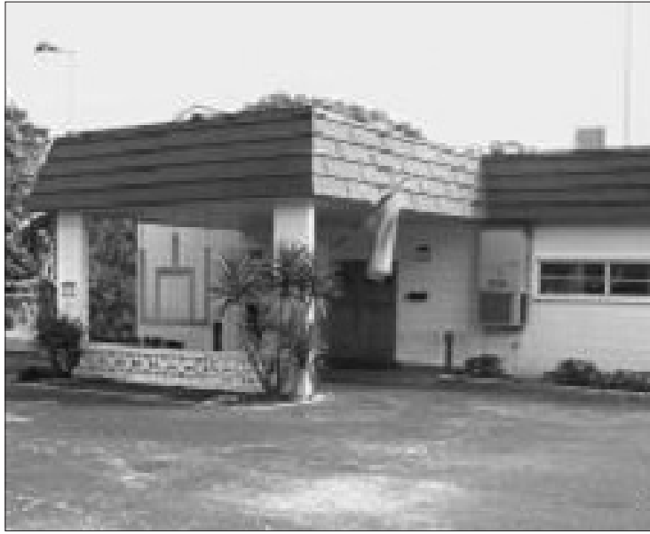
Lietuvių klubas, 4880 46th Ave North St., Petersburg, FL.