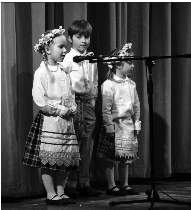
Deklamuoja Šv. Kazimiero lituanistinės mokyklos mokiniai.

LR Generalinis konsultas Čikagoje bendradarbiaudamas su Čikagos laisvalaikio ir pramogų centru Navy Pier rengia Lietuvos nepriklausomybės atkūrimo šventę „Celebrate Lithuanian Independence“. Renginys vyks 2012 m. kovo 11 d., sekmadienį, nuo 12:00 val. iki 5:00 val. popiet Navy Pier centro „Crystal Gardens“ salėje (600 E Grand Ave., Chicago, IL 60611).