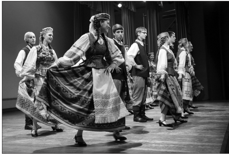
„Švyturys“ atlieka viena šokių rinkinį.