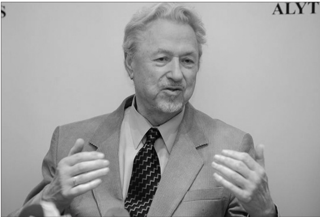
Maestro Virgilijus Noreika.