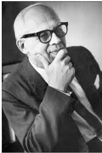
Juozas Brazaitis (Ambrazevičius)

1941 metų Lietuvos laikinosios Vyriausybės vadovas Juozas Brazaitis (Ambrazevičius) šį mėnesį bus perlaidotas Kauno Kristaus prisikėlimo bažnyčios šventoriuje, patvirtino Kauno meras.