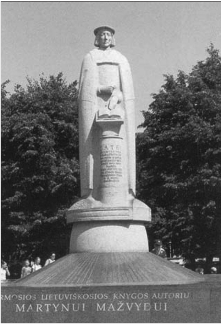
1904 m. gegužės 7 d. atgauta lietuviška spauda. Paminklas pirmosios spausdintos lietuviškos knygos autoriui Martynui Mažvydui Klaipėdoje.