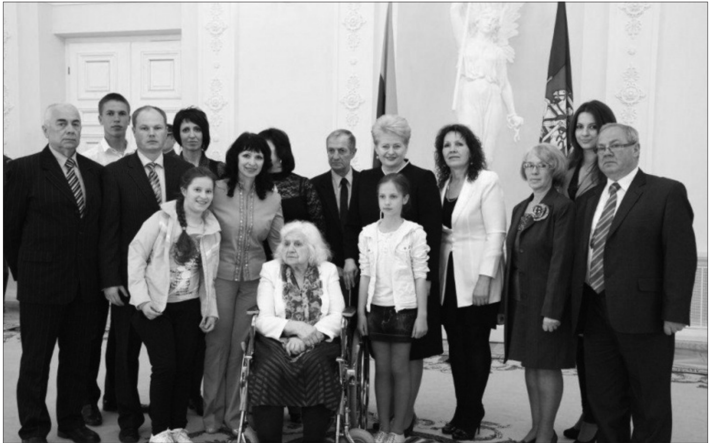
Prezidentė Dalia Grybauskaitė Motinos dienos proga įteikė valstybinius apdovanojimus daugiavaikėms motinoms.