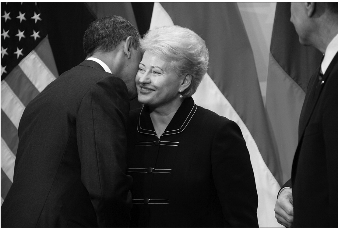
JAV prez. Barack Obama ir Lietuvos Respublikos prez. Dalia Grybauskaitė.