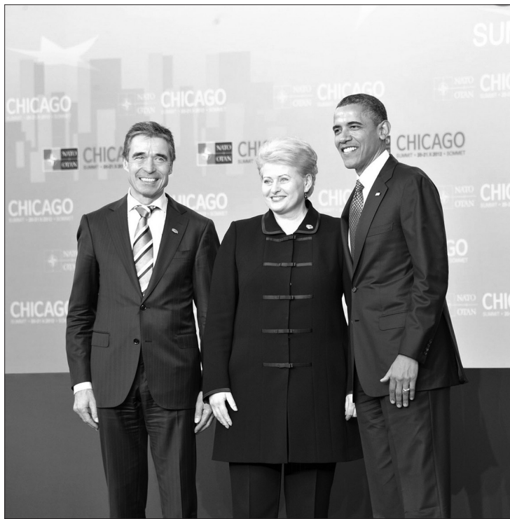
NATO generalinis sekretorius Anders Fogh Rasmussen ir JAV prezidentas Barack Obama kartu su Lietuvos Respublikos prezidente Dalia Grybauskaite.

„Tačiau pastaruosius pusantrų metų stebėjome įvykius Kaliningrado srityje, Baltijos valstybių pašonėje, kurie yra nesuderinami su minėtais įsipareigojimais, įskaitant nepateisintą pažangiausių „žemė-oras“ ir „žemė-žemė“ tipo raketinių sistemų dislokavimą šiame regione. NATO privalo žinoti, kad dislokuotos raketinės sistemos galės pasiekti Vilnių, Rygą, Taliną, Varšuvą, Berlyną ir kitas NATO sostines“, - kalbėjo Lietuvos vadovė. ELTA