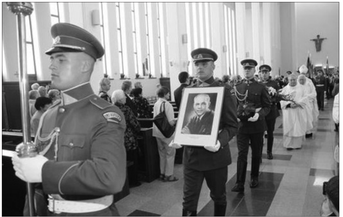
Iškilmingai perlaidota iš JAV parskraidinta urna su literatūrologo, pedagogo, žurnalisto ir publicisto, 1941 metų Lietuvos Laikinosios Vyriausybės vadovo J.Ambrazevičiaus-Brazaičio palaikais.

Tačiau istorikų liudijimu, tiek J.Ambrazevičiaus-Brazaičio vadovauta Vyriausybė, tiek ir jis pats atsiribojo nuo prieš žydus nukreiptos agresijos ir net bandė įtikinti į kraštą įsiveržusius vokiečių kariuomenės vadus nutraukti žydų persekiojimą. Ministrų kabinetas, nesutikęs tapti nacistų kolaborantais, 1941 metų rugpjūčio 5 dieną su-