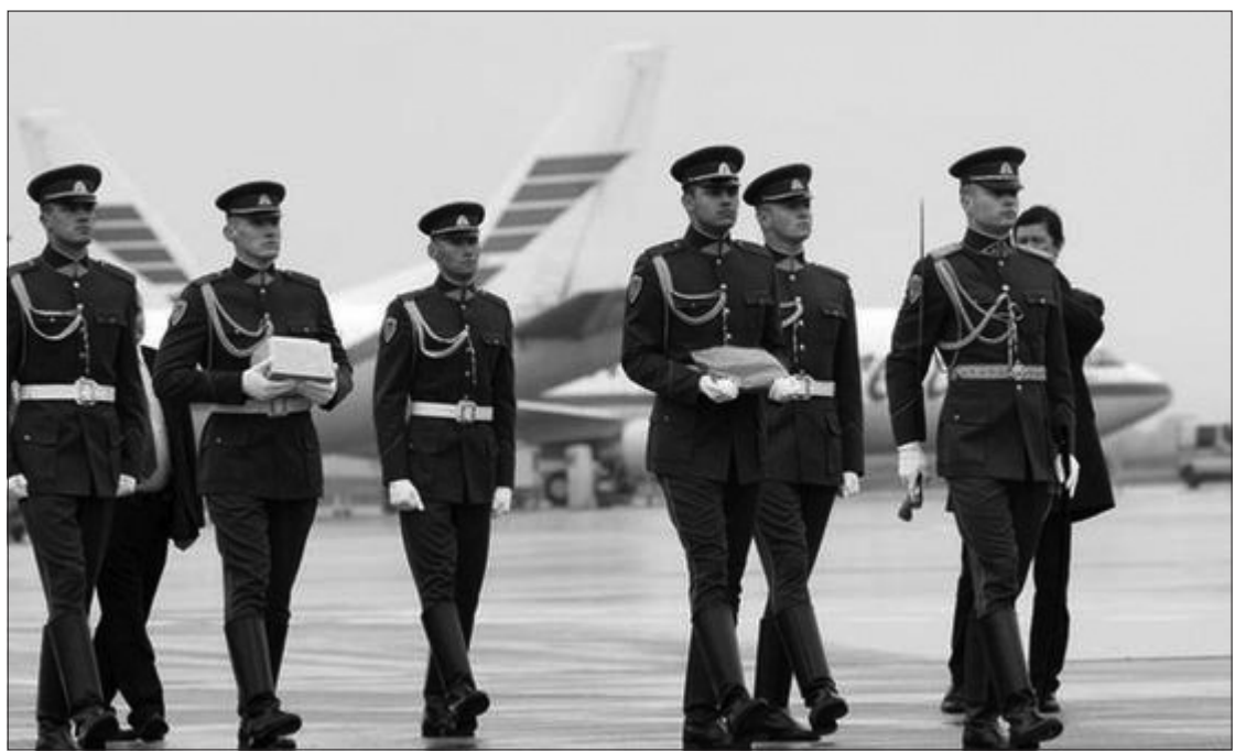
J. Brazaičio palaikai buvo pargabenti iš JAV. Urną ir žymenis neša kariai.

Kalba perlaidojant Lietuvos Laikinosios Vyriausybės ministro pirmininko Juozo Brazaičio (Ambrazevičiaus) palaikus, Kaunas, 2012 05 20