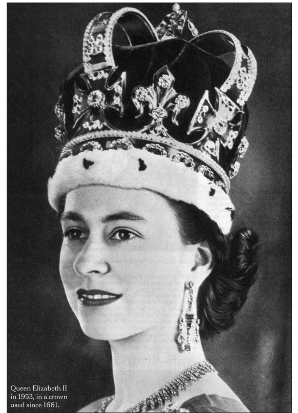
Queen Elizabeth II in 1953, in a crown used since 1661.

Didžiosios Britanijos karalienė Elžbieta II abiems parlamento rūmams pasakė kalbą vasario 6-ąją, bet jos 60 metų karaliavimo jubiliejų britai švenčia kelis mėnesius. Pastarosios birželio 4 dienos buvo Anglijoje iškilmingai švenčiamos, dalyvaujant minioms žmonių ir stebint karalienės parodą ir giedant pakeistą himną. Vietoj žodžių „Dieve, saugok karalių“, britai giedojo „Dieve, saugok karalienę“. Į himno tekstą dar įrašyti žodžiai – „karalienės, vienybės, tarnystės ir tinkamumo simbolio“. Nuo šiol ji skambės per svarbias šventes ir futbolo rungtynėse. Nuotraukoje karalienė vainikavimo metu 1953 m. su karūna, kuria karūnuojama nuo 1661 metų.