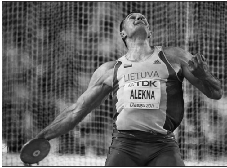
Disko metikas Virgilijus Alekna.

„Visų pirma, tai labai didelė garbė. Jei tik pasiūlys – būtinai sutiksiu. Džiaugiuosi ir tuo, kad pirmą kartą atidarymo ceremoniją matysiu gyvai –