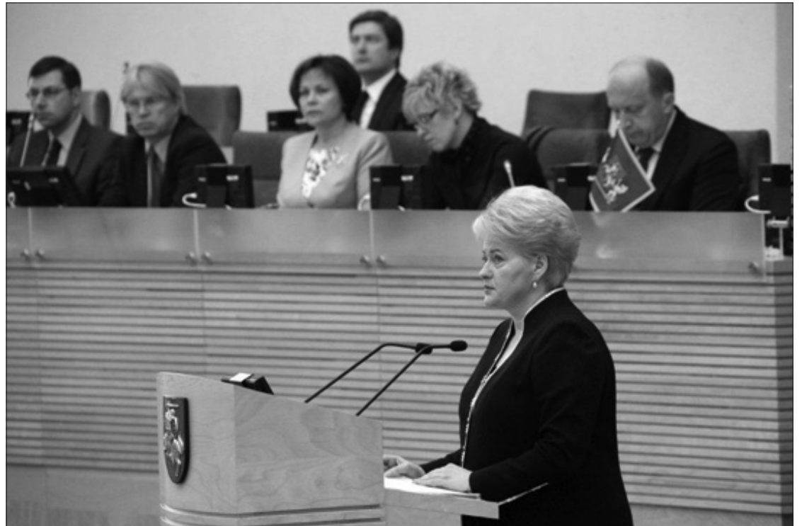
Lietuvos prezidentė Dalia Grybauskaitė Seime skaitė metinį pranešimą.