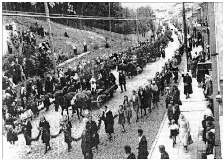
Rainių kankinių laidotuvės.