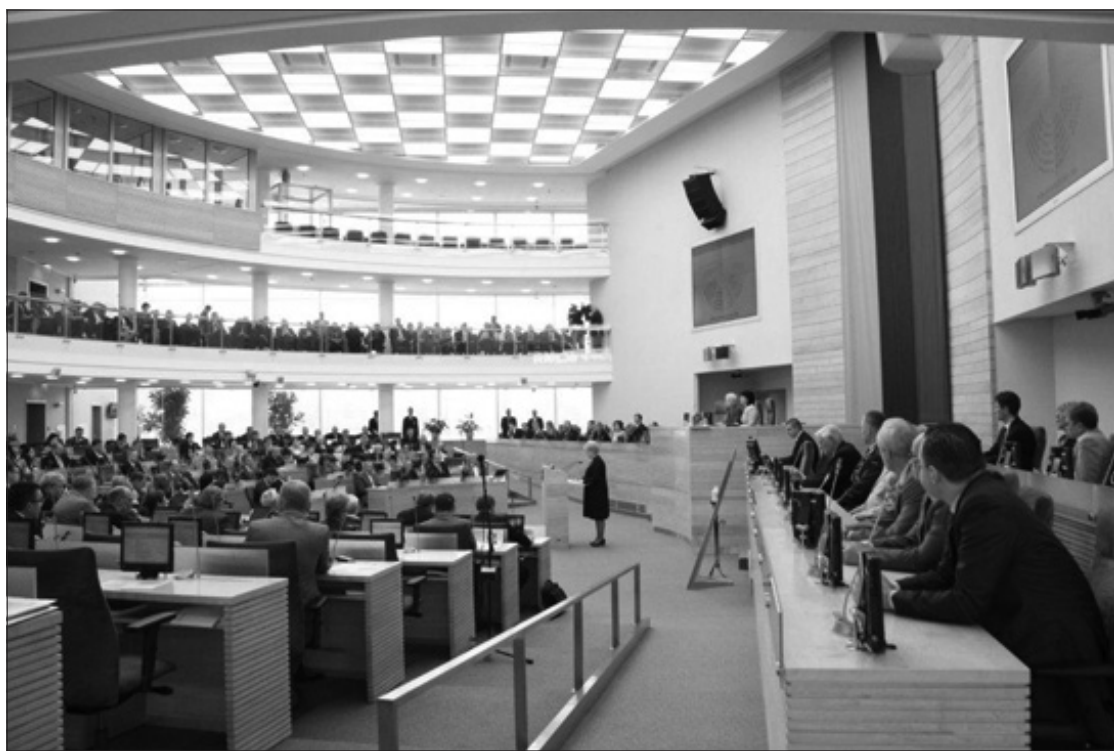
Lietuvos prezidentė Dalia Grybauskaitė Seime skaitė metinį pranešimą.