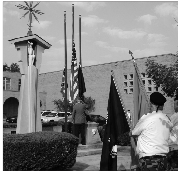
613-to posto nariai saliuoja JAV vėliava.