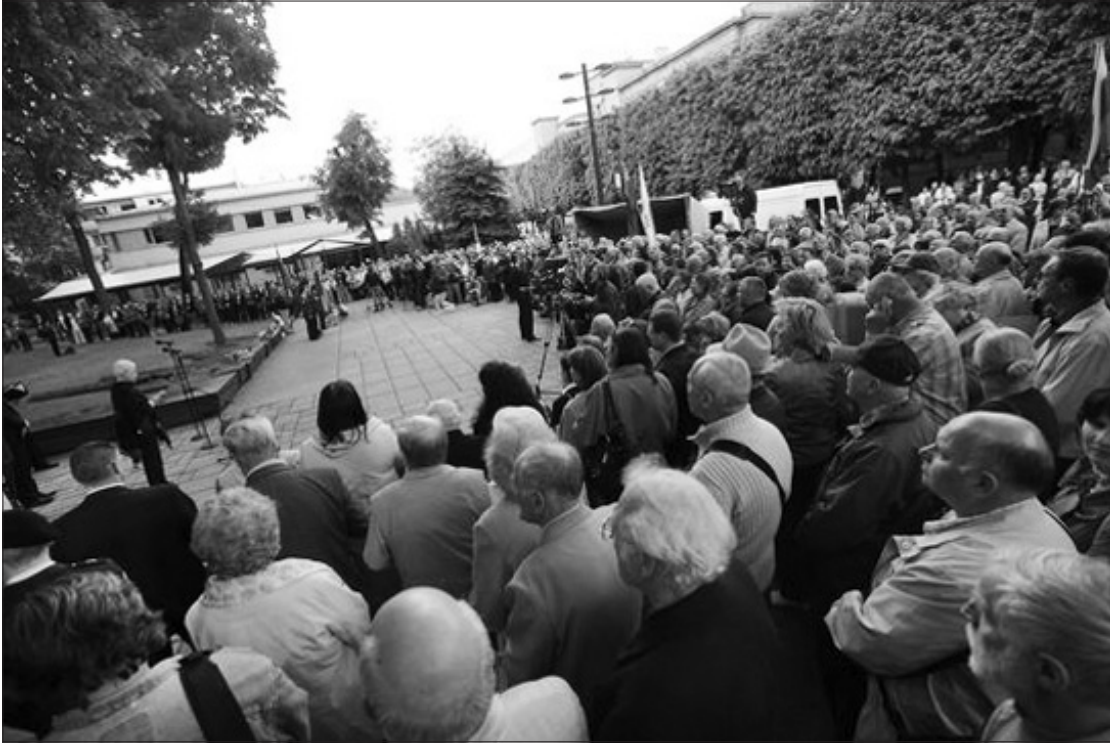
Gegužės 14 d. Kauno muzikinio teatro sodelyje susirinkę žmonės pagerbė Romą Kalantą prieš 40 metų savo poelgiu sudrebinusį Sovietų Sąjungą.

Prieš 40 metų Kauno muzikinio teatro sodelyje susideginęs 19 metų jaunuolis Romas Kalanta artimiesiems paliko ranka rašytą raštelį: „Dėl mano mirties kalta tik santvarka.“ Regis, virsti gyvu fakelu už Lietuvos nepriklausomybę ryžęsis jaunuolis trumpai ir aiškiai apibūdino drąsiai bei beprotišku vėliau vadintą poelgį.