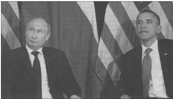
G-20 viršūnių pasitarimų metu San Jose Los Kabos vasarvietėje, Meksikoje, JAV ir Rusijos prezidentų pokalbiai buvo labai šalti, nes į B. Obamos klausimą, kodėl Rusija siunčia ginklus Sirijai, V. Putin visiškai neatsakė.

„Rusija ir Kinija pripažįsta, kad padėtis rimta, kad ji neatitinka mūsų siekių ir sirų tautos