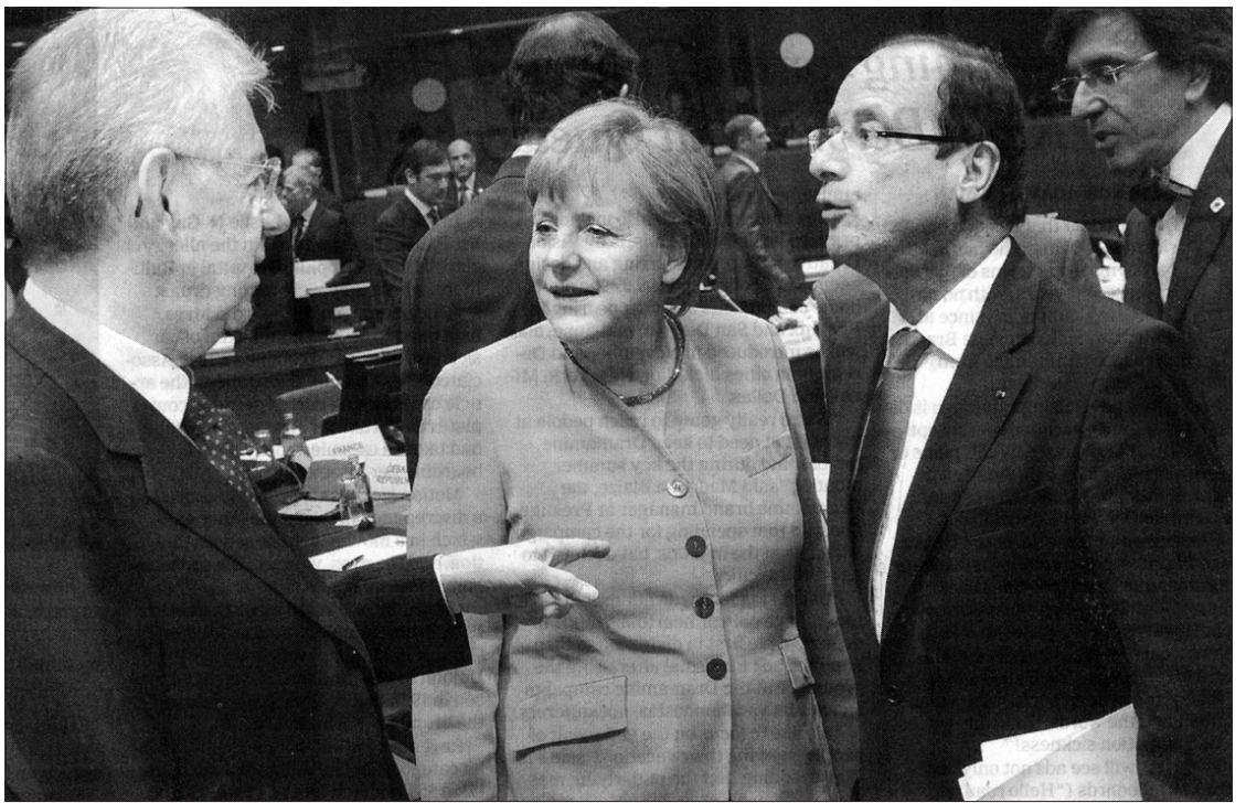
Italijos premjeras Mario Monti, Vokietijos kanclerė Angela Merkel ir Prancūzijos prez. Francois Hollande vėl tarėsi, kaip teikti euro paramą Graikijai, Ispanijai ir Italijai.

Tėvynės apsaugos departamento sekretorė Janet Napolitano teigė, kad įstatymai dėl deportacijos buvo sukurti ne tam, kad „aklai būtų vykdomi, neatsižvelgiant į kiekvieno atvejo išskirtines aplinkybes”.