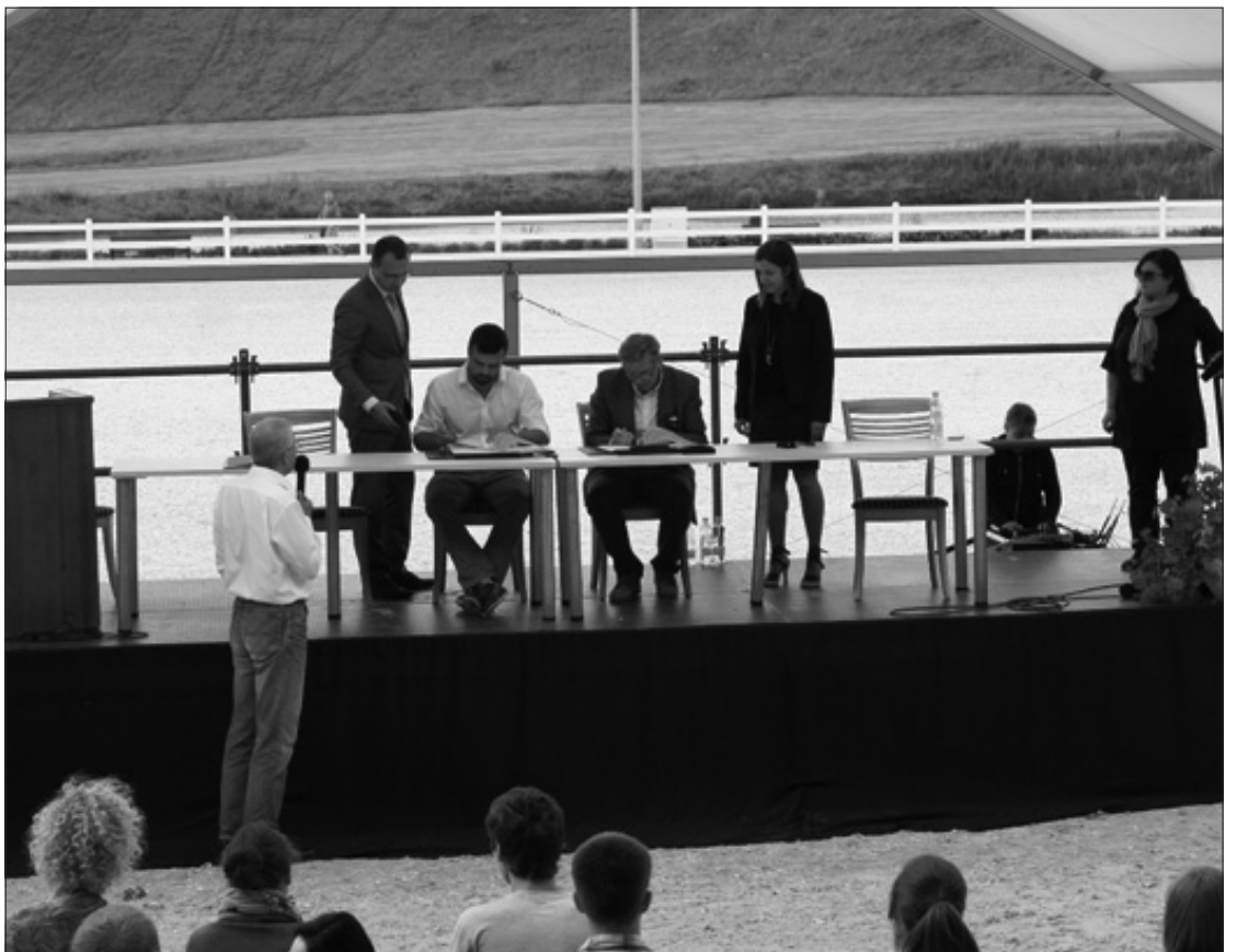
LR užsienio reikalų ministras Audronius Ažubalis ir Pasaulio lietuvių jaunimo sąjungos pirmininkas Kęstas Pikūnas liepos 13 dieną Vazgaikiemyje, Prienų rajone, pasirašė memorandumą dėl Užsienio reikalų ministerijos ir sąjungos bendradarbiavimo stiprinant užsienyje gyvenančio Lietuvos jaunimo tautinį tapatumą, pilietiškumą ir bendrą veiklą.