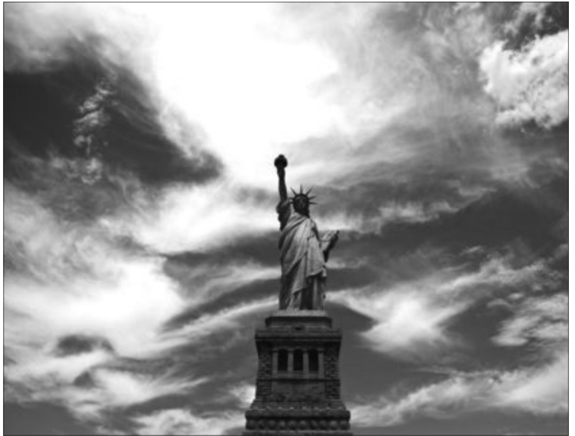
Prieš 236 metus paskelbta Jungtinių Amerikos 13-kos Valstijų nepriklausomybė. Šis Laisvės simbolis pasitinka tūkstančius įvairių tautybių imigrantų, kurie sukūrė demokratinę 50 valstijų Ameriką.