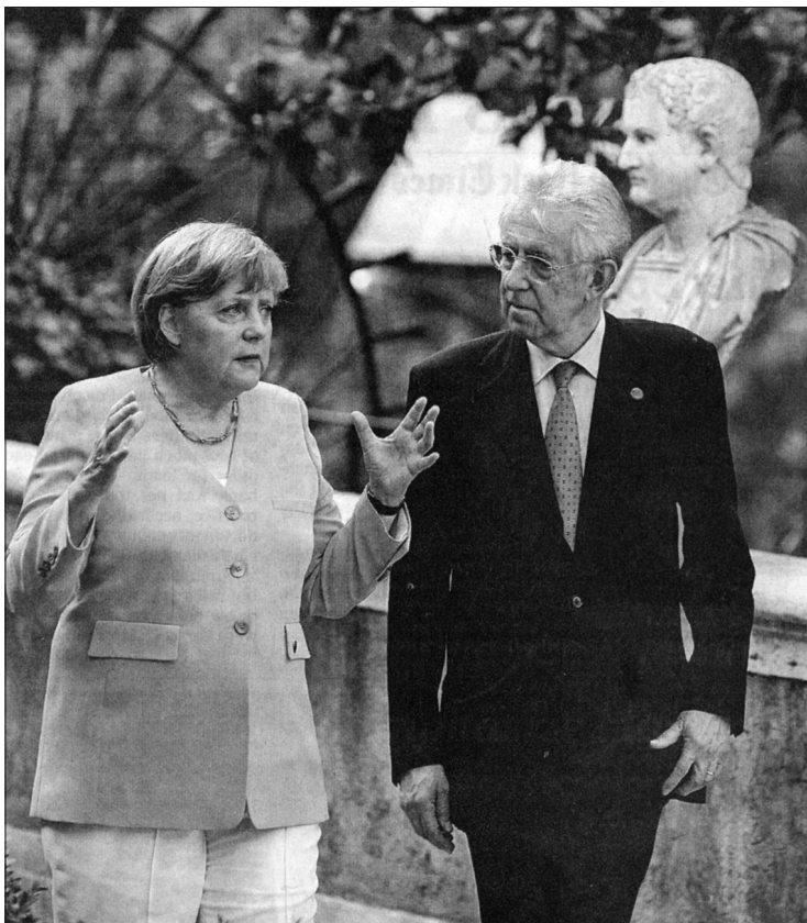
Vokietijos kanclerė Angela Merkel dažniau tarsis Europos ekonominės krizės reikalais su Italijos ministru Mario Monti negu su Prancūzijos prezidentu.