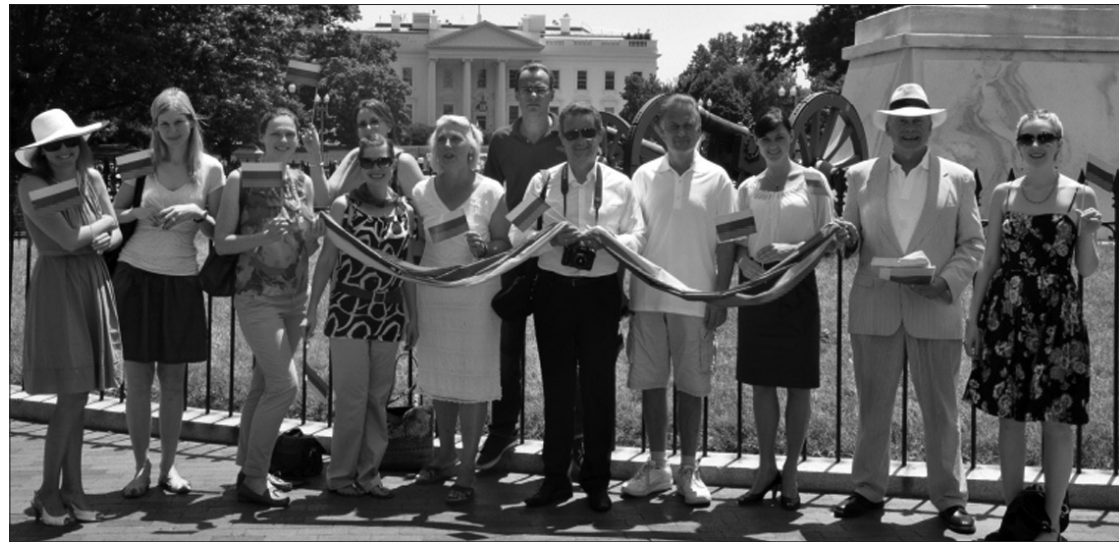
Lietuviai Washington D.C.

su Valstybės diena ir perdavė užsienio reikalų ministro Audroniaus Ažubalio sveikinimą pasaulio lietuviams liepos 6-osios proga. „Tautiška giesmė“ kartu su Lietuvos ambasados Maskvoje darbuotojais giedojo lietuvių bendruomenės nariai, verslininkai, Rusijos sostinėje tuo metu besilankę svečiai iš Lietuvos. Valstybės dienos renginiai Lietuvos ambasadoje buvo tęsiami ir liepos 9-ąją, kai buvo rodomas filmas apie iškilų lietuvių poetą ir diplomata Jurgį Baltrušaitį, vyko Lietuvos ir Norvegijos klasikinės muzikos atlikėjų „Trio De’HaPy“ koncertas.