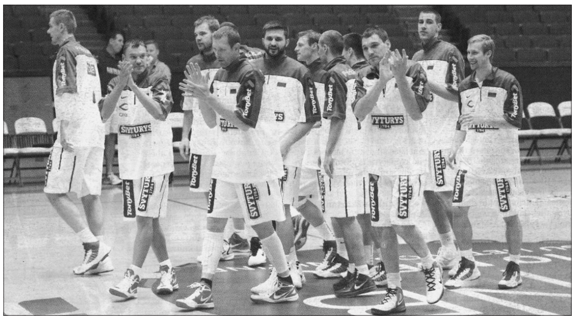
Renngiantis atrankai į Londoną kontrolinėse rungtynėse Lietuvos krepšinininkai darė klaidų ir gindamiesi, puldami.

Londono olimpinės žaidynės vyks liepos 27 - rugpjūčio 12 dienomis.