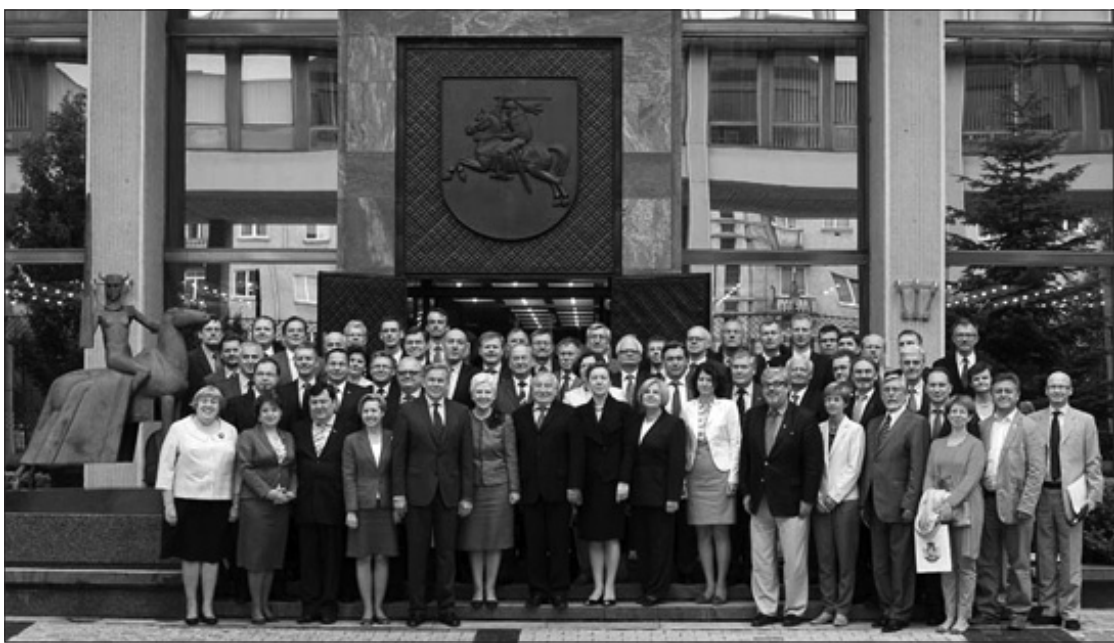
Lietuvos Seimo pirmininkė Irena Degutienė su Lietuvos diplomatinė atstovybių vadovų suvažiavimo dalyviais.