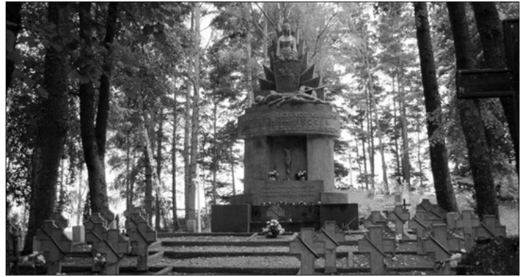
1919 metais per kovas su bolševikais žuvusių lietuvių karių kapavietė Latvijoje, Červonkos kaimelyje.