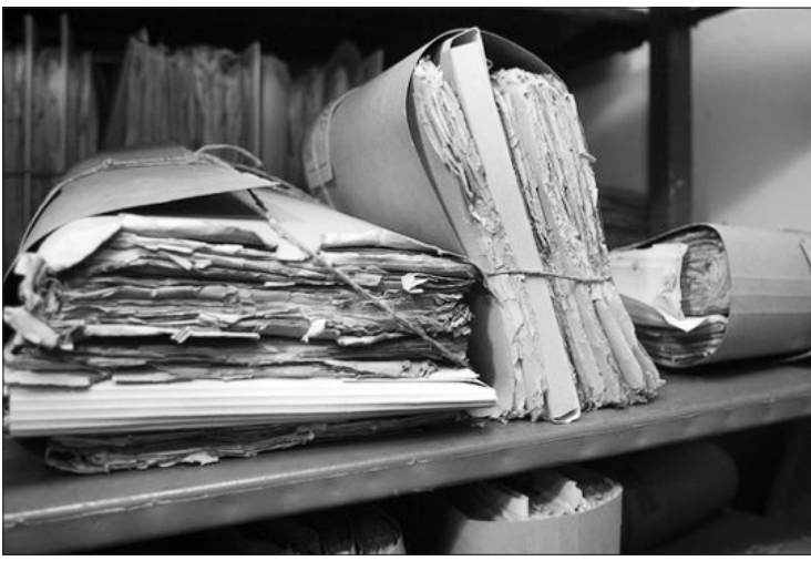
Skaitmeninės archyvinių dokumentų kopijos padėtų išsaugoti jų originalus. LŽ