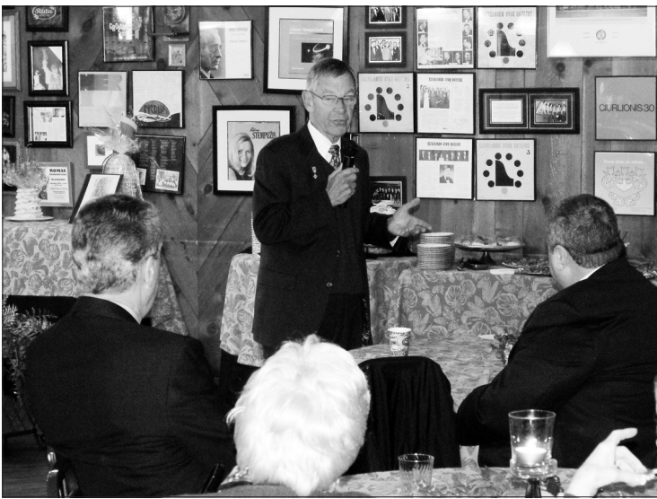
Buvęs sen. G. Voinovich.