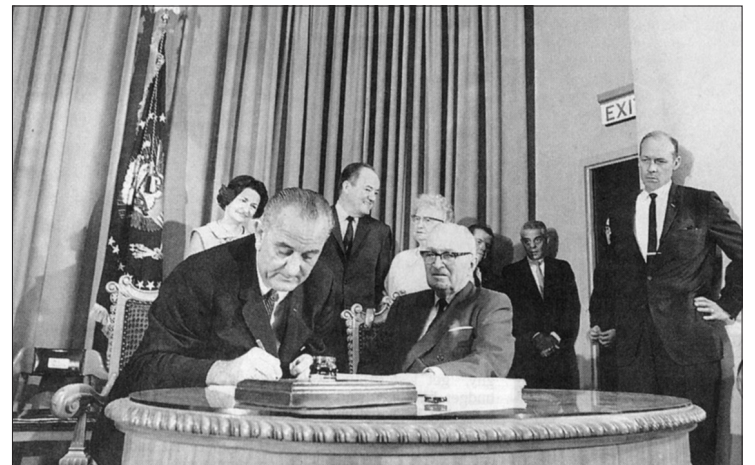
Daug ginčų vyksta JAV prezidento rinkimo debatuose dėl Medicare įstatymo, kurį demokratai nori pakeisti. Nuotraukoje JAV prezidentas Lyndon B. Johnson pasirašo Medicare įstatymą, dalyvaujant buvusiam prezidentui Harry S. Truman.

Šio susitikimo metu vadovai turėtų pradėti diskusijas apie eurozonos biudžeto įsteigimo galimybę. Tai yra tiesioginis atsakas į Vokietijos reikalavimą steigti fiskalinę sąjungą. ELTA