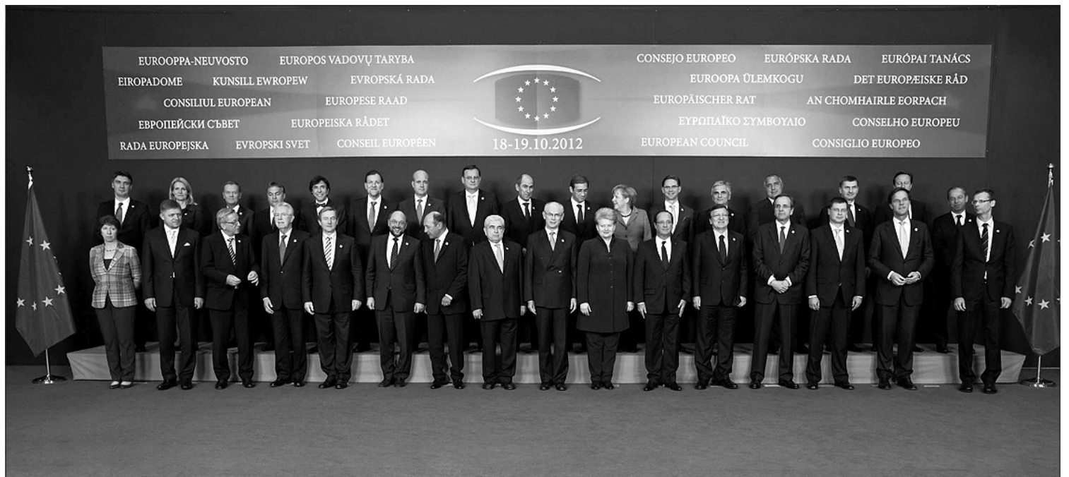
ES viršūnių taryboje dalyvauja ir prezidentė Dalia Grybauskaitė.

„Netikrumsu metu šis pagerbimas už praeities pasiekimus yra įtaigus kreipimasis (raginantis) saugoti ir stiprinti Europą kitai kartai, – sakoma pareiškime. – Suprasdami, kad šios taikių interesų bendrijos pažangai reikia nuolatinio rūpinimosi ir tvirtos valios, Europos Vadovų Tarybos nariai savo asmenine atsakomybe laiko užtikrinimą, kad Europa išliktų pažangos ir klestėjimo