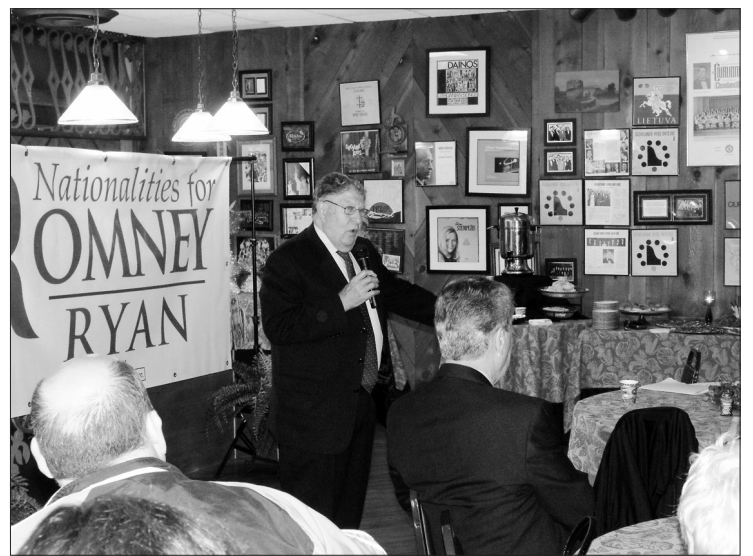
Buvęs New Hampshire gubernatorius John H. Sununu