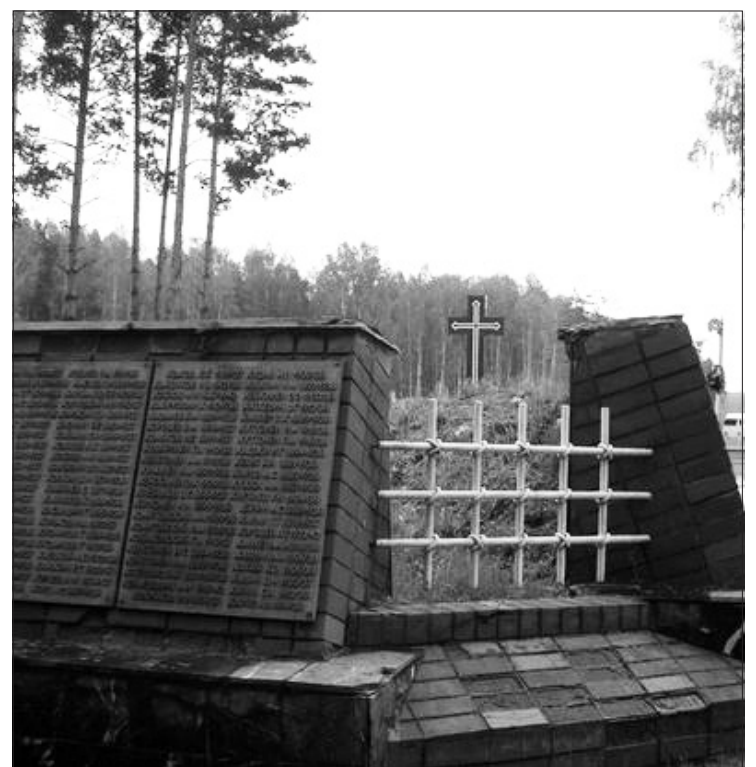
Jekaterinburgo politinių represijų aukų memorialas. Lietuviškų pavardžių čia nėra...