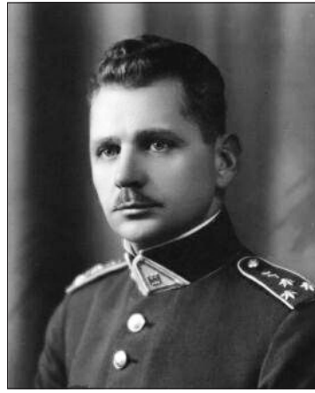
Krašto apsaugos ministras J. Papečkys