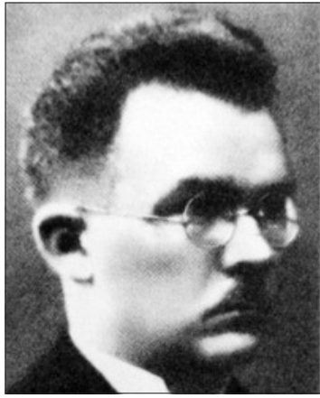
Vidaus reikalų ministras Z. Starkus