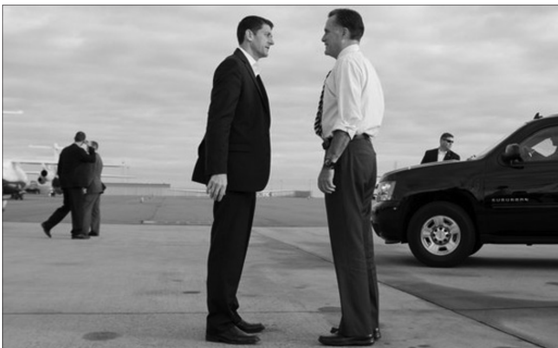
Šiandien Jungtinių Amerikos Valstijų prezidento rinkimai. Respublikonų partijos kandidatai: Atstovų rūmų narys Paul D. Ryan ir buvęs Massachusetts gubernatorius Mitt Romney (d.) rinkiminės kelionės metu Colorado valstijoje. NY