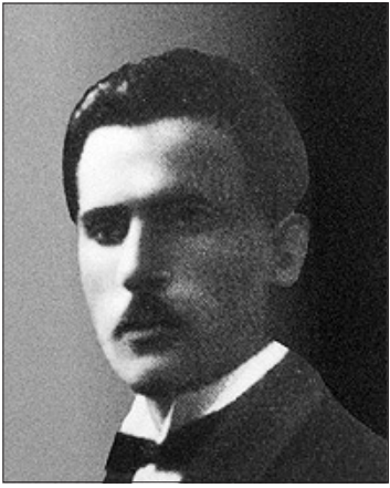
Vidaus reikalų ministras A. Endziulaitis