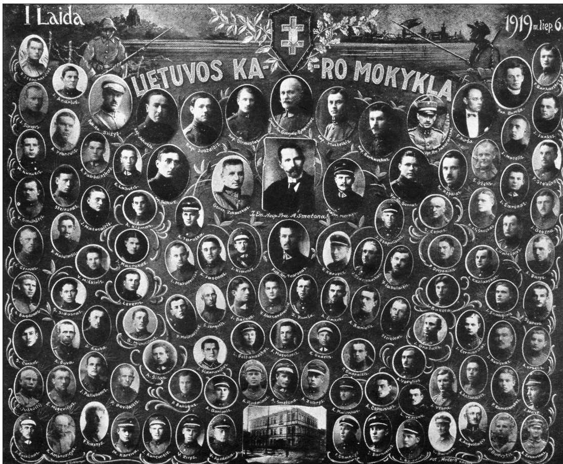
Pirmoji Lietuvos karininkų laida.