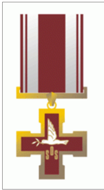
Žūvančiųjų gelbėjimo kryžius

Žinoma, negalima beabodairiškai pasiduoti A.