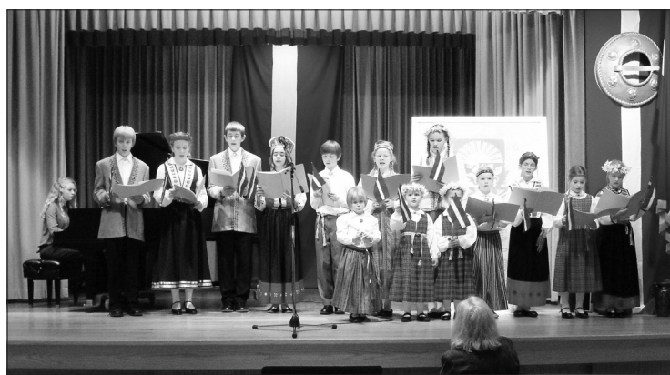
Latvių sekmadieninės mokyklos mokiniai Latvijos nepriklausomybės šventėje.