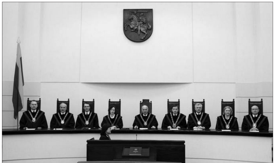
Lietuvos Respublikos Konstitucinio Teismo kolegija.

Komisija darbą turėtų pabaigti iki gruodžio 21 d. ELTA