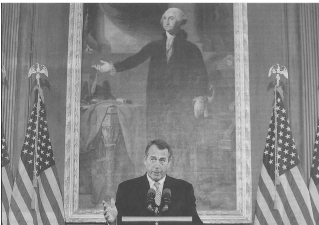
JAV Atstovų rūmų pirmininkas (angl. House Speaker) John A. Boehner po pasitarimų su prezidentu B. Obama dėl biudžeto ir naujų mokesčių, pareiškė: „Mes esame pasiruošę veikti ne kaip demokratai ar respublikonai, bet kaip amerikiečiai“.