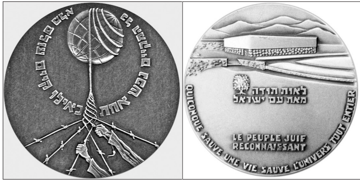
Pasaulio tautų teisuolio medalis.

Be tradicinio holokausto aukų pagerbimo, kuris tą dieną vyko Panerių memoriale dalyvaujant oficialiems asmenims, šį kartą įvyko dar vienas labai jaudinantis dalykas - jaunuomenė, moksleivių organizacijos, Vilniaus mokytojų namai, vilniečiai rugsėjo 22 d. Šv. Kotrynos bažnyčioje surengė Vilniaus gete gyvenusių žydų, kurie buvo nužudyti nacių ir jų vietinių talkininkų, pavardžių skaitymus. Jie prasidėjo septintą valandą ryto ir truko iki pusės dešimtos vakaro. Vienas skaitovas penkias minutes skaitė žuvusiųjų pavardes, paskui sąrašą perduodavo tęsti kitam šios pilietinės akcijos dalyviui. Susirinkusieji ir bažnyčios skliautai sugerdavę skaitomų pavardžių aidą, trumpas pauzės tarp vienos ir kitos pavardės neleido geriau