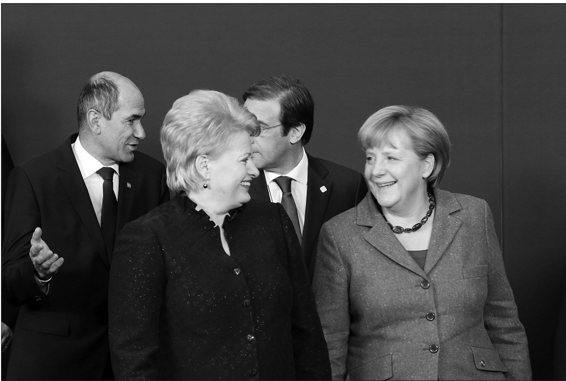
Briuselis, 2012 m. lapkričio 23 d. Briuselyje vyko Europos Sąjungos (ES) viršūnių pasitarimas, kuriame vadovai tariasi dėl naujo biudžeto. Nuotraukoje: Lietuvos prezidentė Dalia Grybauskaitė ir Vokietijos kanclerė Angela Merkel.