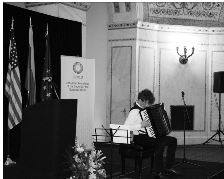
Koncertuoja akordeonistas Martynas Levickis.