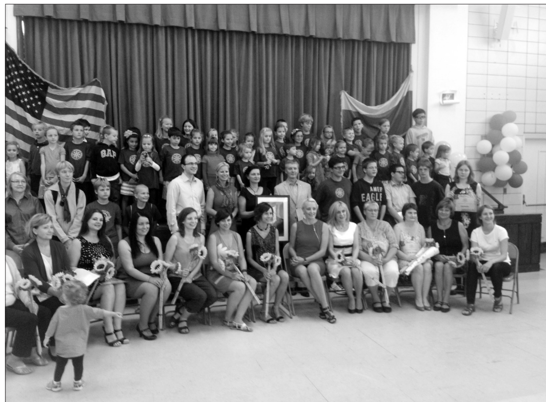
Bendra Maironio lituanistinės mokyklos šventės dalyvių nuotrauka.

Lietuvos ambasada mokyklai teikia visokeriopą paramą, aprūpina mokymosi priemonėmis bei vadovėliais. LR URM inf.