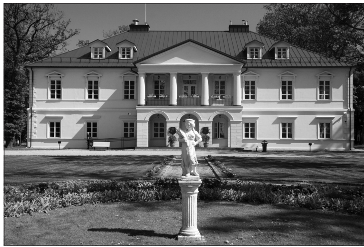
Lietuvos kultūros paveldo objektas Bistrampolio dvaras, turintis archeologinę, istorinę, kraštovaizdinę vertę yra 14 kilometrų nuo Panevėžio, netoli Uliūnų gyvenvietės.

Šiais metais sutvarkytos Panevėžio rajone esančios sukilėlių kapavietės. Bistrampolio festivalį baigė pirmą kartą lietuviškai atliktas Brodvėjaus miuziklas „Mirtinas bučinyš“. LRT