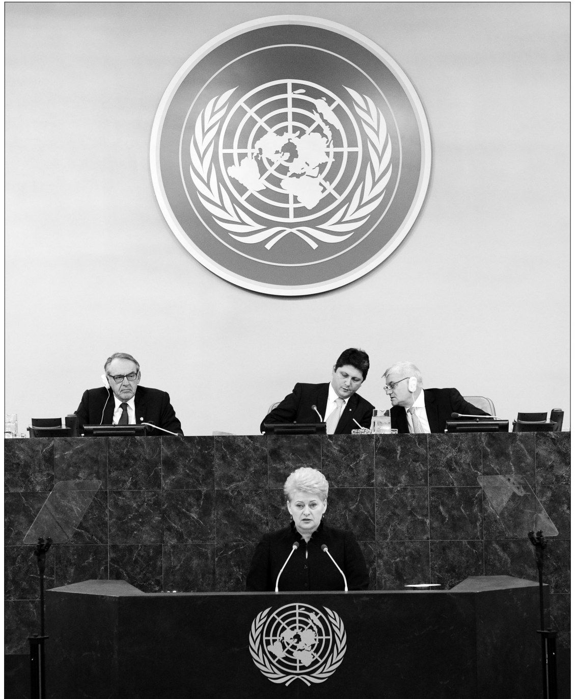
Kiekviena šalis turi pasirinkti savąjį vystymosi kelią, galios demonstravimo ar buferinių zonų kūrimo laikas jau baigėsi, pasaulio vadovams pabrėžė Lietuvos Respublikos Prezidentė Dalia Grybauskaitė, sakiusi kalbą 68-uosiuose Jungtinių Tautų (JT) Generalinės Asamblėjos debatuose.