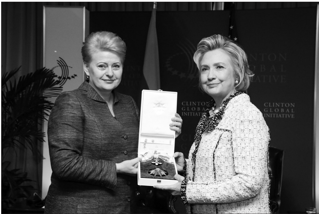
Lietuvos Respublikos Prezidentė Dalia Grybauskaitė rugšėjo 25 d. buvusiai JAV valstybės sekretorei Hillary Rodham Clinton įteikė valstybės apdovanojimą.