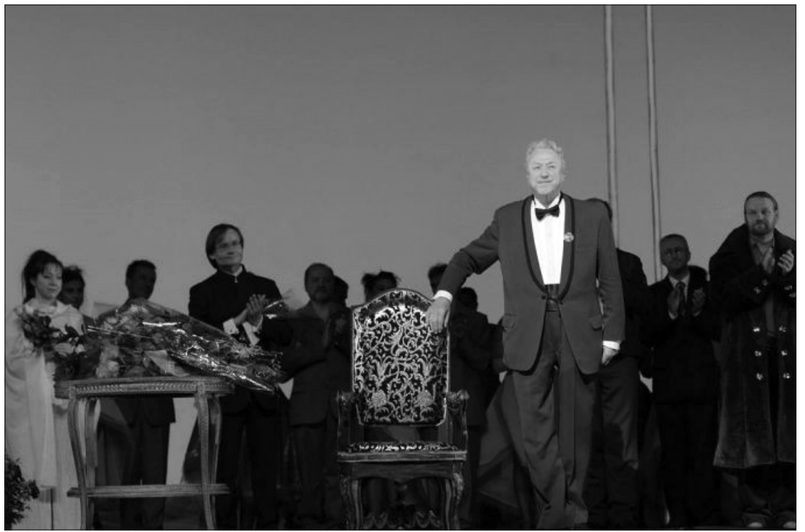
Operos solistas Virgilijus Noreika.