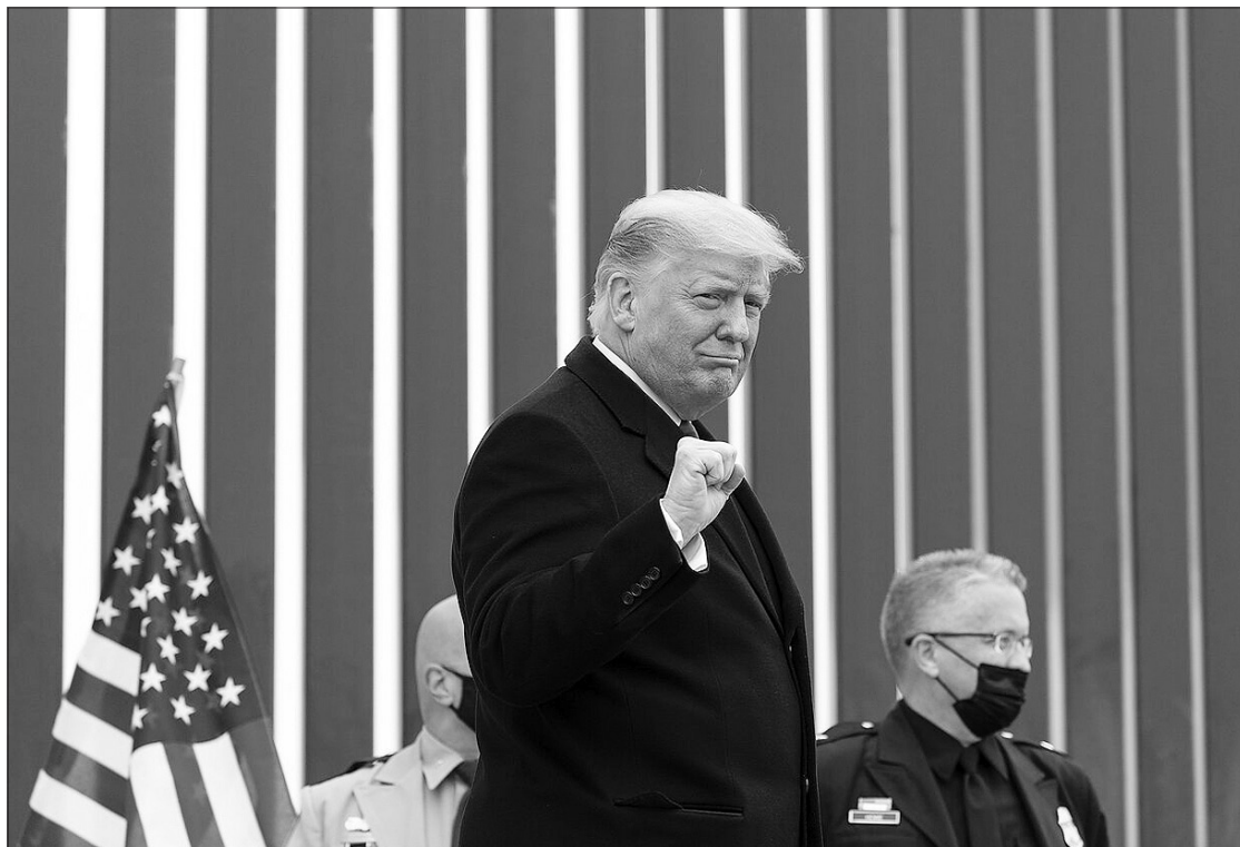
Donaldas Trampas (Donald Trump).