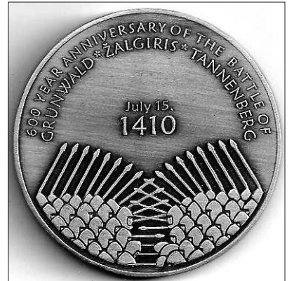
Žalgirio mūšiu atminti skirtas medalis.