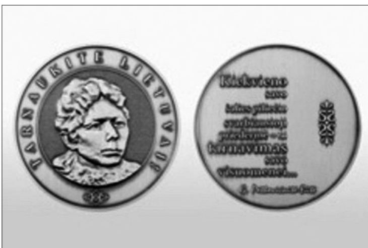
Gabrielės Petkevičaitės-Bitės atminimo medalis „Tarnaukite Lietuvai“.