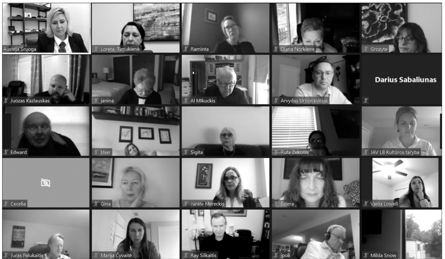
Š.m. sausio 24 d. JAV lietuvių bendruomenės Krašto valdybos organizuota apylinkių ir apygardų atstovų nuotolinė konferencija.