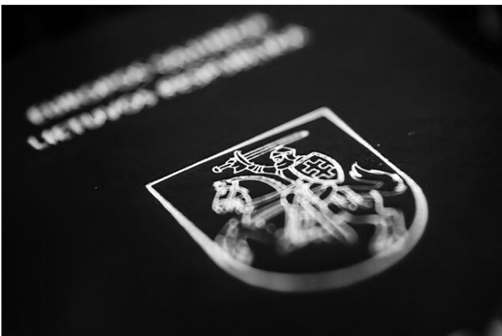
Lietuvos Respublikos piliečio pasas.

Jeigu kalbame apie finansavimą, noriu pasidžiaugti PLB ateities fondu, kuris buvo įkurtas prieš metus. JAV lietuvių administruojamame fonde šiuo metu sukaupta 13 100 JAV dolerių. Jau šiais metais buvo uždirbta daugiau kaip 300 dolerių pa-