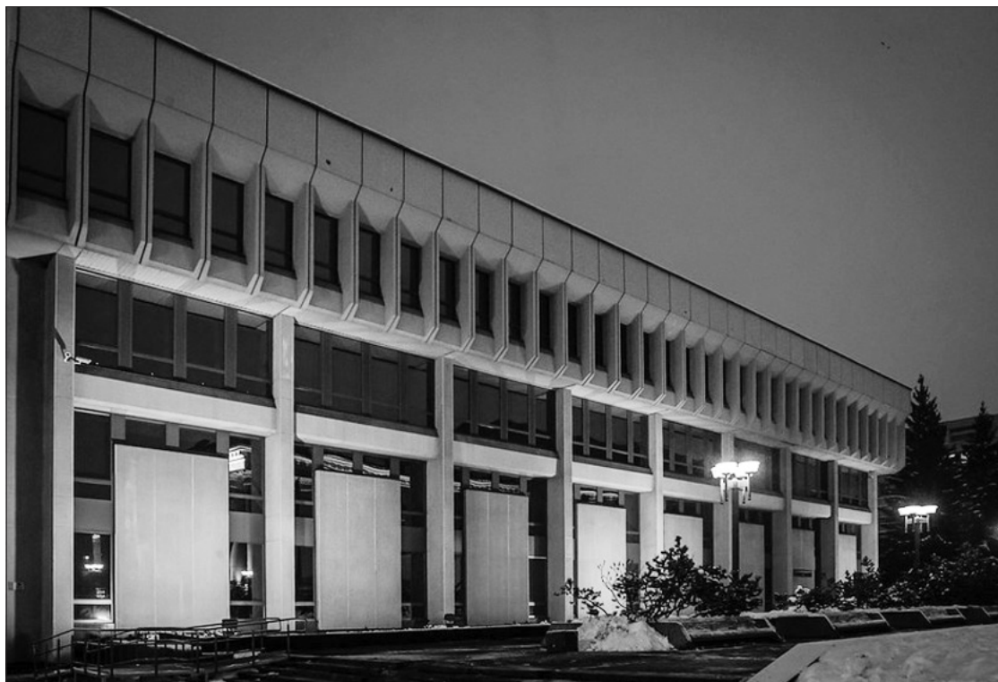
Lietuvos Respublikos Seimas.

„Po Lietuvos nepriklausomybės atkūrimo paskelbimo nebuvo praėję nė metai, per tuos metus didelis pasaulis, jo lyderiai garbino sovietų kompartijos lyderį M. Gorbačiovą ir jo perestroiką. Mes gi Lietuvoje išgyvenome tragiškus 1991-ųjų sausio įvykius, kurie daugeliui pasaulyje atvėrė akis. O tų pačių metų vasario 9-ąją Lietuvoje įvyko plebiscitas, kurio metu Lietuvos gyventojai turėjo atsakyti į klausimą: „Ar Jūs už tai, kad Lietuvos valstybė būtų nepriklausoma demokratinė respublika?” Žmonių aktyvumas buvo stebėtinai – 2,25 mln. iš 2,6 mln. balso teisę turinčių piliečių dalyvavo balsavime, 90 proc. balsavusiųjų pasisakė už nepriklausomą ir demokratinę Lietuvą. Kelias tarptautiniam Lietuvos pripažinimui bu-