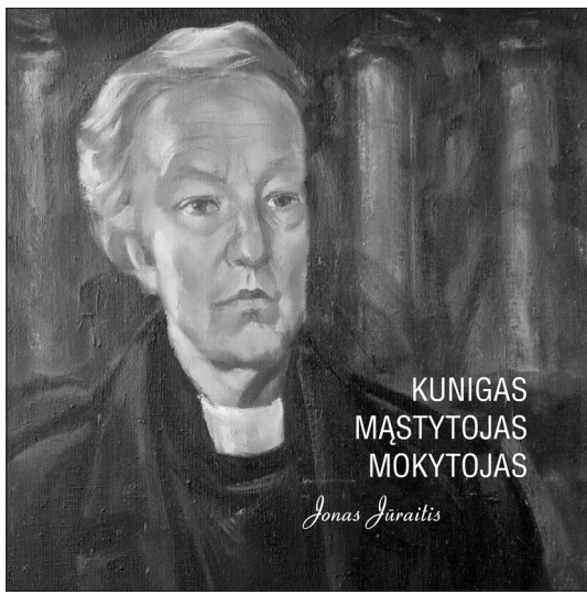
KUNIGAS MĄSTYTOJAS MOKYTOJAS