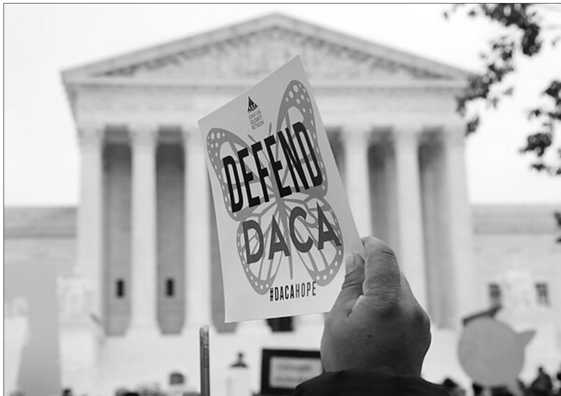
Protestuotojai, palaikantys „svajotojų“ (DACA) programą

Jungtinių Amerikos Valstijų teismas liepos 16 d. pareiškė, kad imigracijos programa, sauganti į šalį vaikystėje atvežtus migrantus be dokumentų, yra neteisėta, taip blokuodamas naujų pareiškėjų priėmimą.