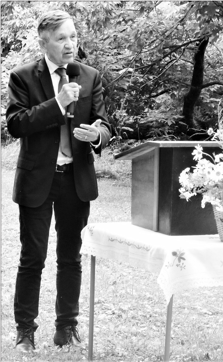
Prelegentas Dennis Kucinich kalbėjo apie svarbius patriotizmo dalykus.