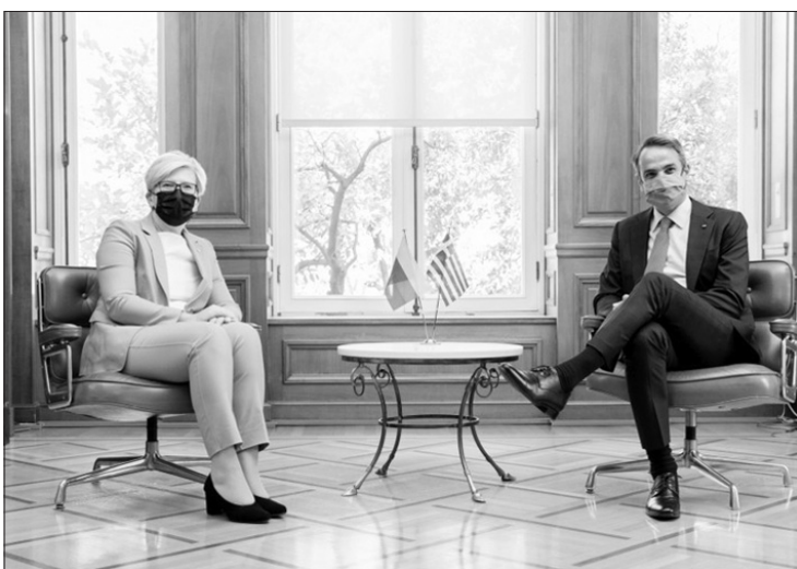
Lietuvos Respublikos Ministrė Pirmininkė Ingrida Šimonytė ir Graikijos premjeras Kyriakas Mitsotakis Atėnuose.

Lietuvos Respublikos Ministrė Pirmininkė Ingrida Šimonytė Atėnuose susitiko su Graikijos premjeru Kyriaku Mitsotakiu, Parlamento Pirmininku Constantinu An. Tassoulu, apsilankė Jūrų reikalų ir salų politikos ministerijoje, Graikijos pakrančių apsaugos operacijų centre ir Jungtiniame gelbėjimo koordinavimo centre. Atskirus susitikimus Atėnuose turėjo ir premjerę lydintys Valstybės