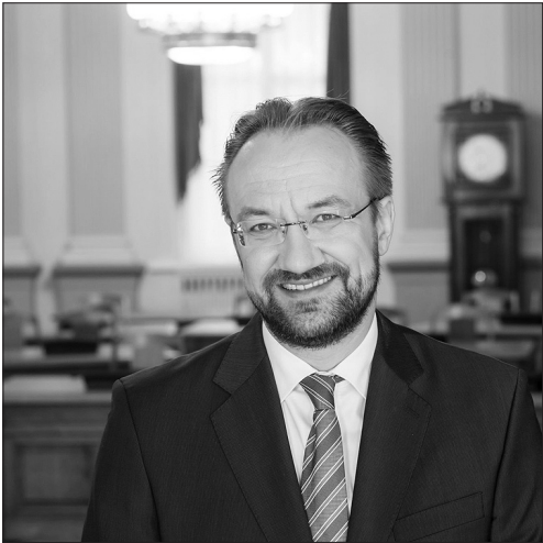
Naujasis Lietuvos banko valdybos pirmininkas Gediminas Šimkus.

Prezidento Seimui pateiktas kandidatas į Lietuvos banko valdybos pirmininko postą Gediminas Šimkus pastebėjo, kad šiuo metu valstybės skola yra išaugusi iki neįprasto lygio, tačiau sako, jog nereikėtų tuo gąsdintis. Lietuvos banko duomenimis, 2020 m. pabaigoje valstybės skola siekė 24,8 mlrd. Eurų, arba beveik 51% bendrojo vidaus produkto (BVP). G. Šimkus pastebėjo, kad net ir dabar Lietuvos skolos lygis nesiekia taip vadinamojo Mastroichto kriterijaus (60% BVP). Be to, anot jo, Lietuvos skola „mažesnė nei yra kitose euro zonos valstybėse“ 1 . Įdomu ir tai, kad 2019 m. Lietuvos skola siekė 35,9% BVP (Latvija – 36,9%, Estija – 8,4%, Lenkija – 45,7%, Suomija – 59,3%) 2 . Vadinas, per metus Lietuvos skola išaugo net 15% (!). Tai aiškinama neišvengiama pandemijos pasėkme. Taigi, kaip bekalbėsime, Lietuvos skola kasmet auga, o jos apčiuopiamam sumažinimui galimybių nematyti. Milijardiniai procentai, kuriuos mokame visi, iškeliauja kažkam iš Lietuvos. O kaip buvo praeityje?