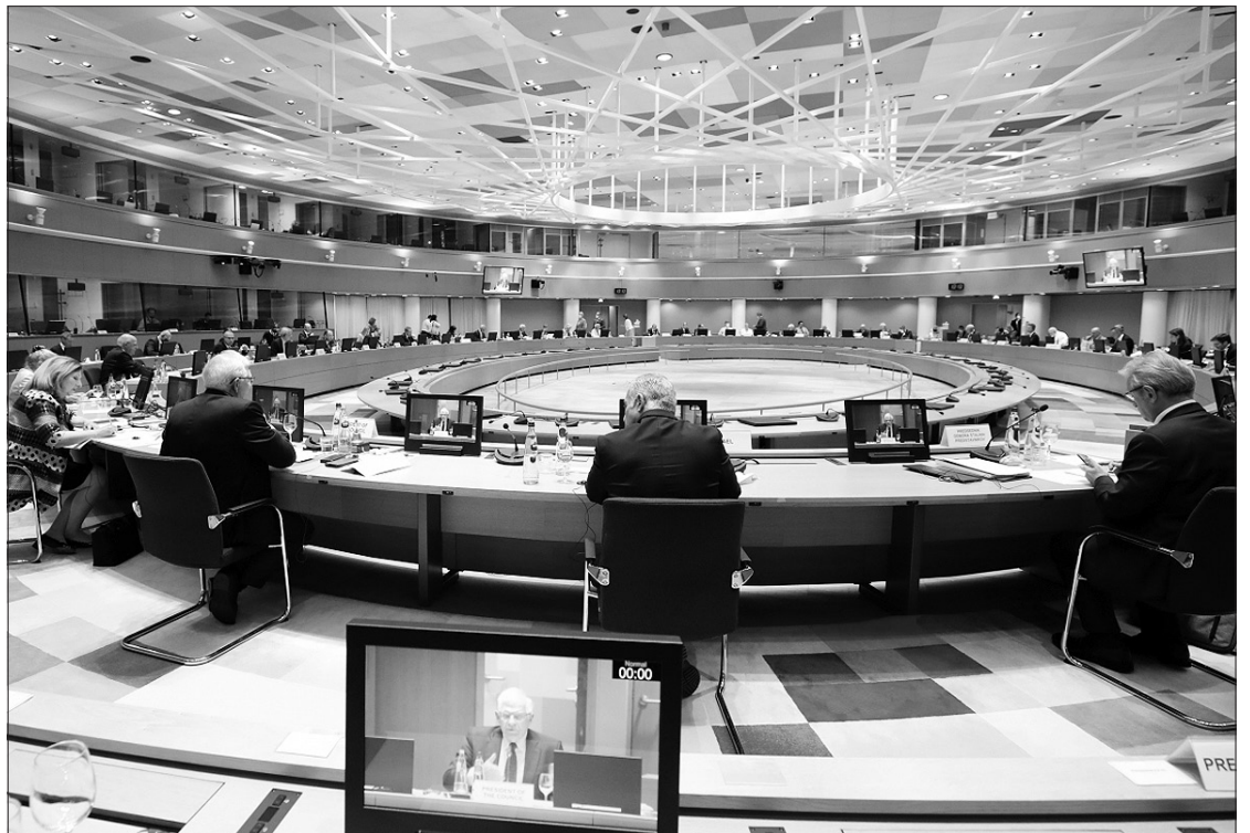
Liepos 12 dieną Lietuvos užsienio reikalų ministras Gabrielius Landsbergis dalyvavo pasitarime Europos Sąjungos (ES) užsienio reikalų taryboje Briuselyje. LR URM

„Bendrais instrumentais ir mechanizmais ES privalo atgrasyti autoritarinius kaimynus nuo neteisėtos migracijos kaip hibridinio ginklo naudojimo prieš valstybės nares. Manau, kad sankcijų gilinimas - viena efektyviausių priemonių”, - sakė užsienio reikalų ministras ir informavo kolegas, kad per pastaruosius šešis mėnesius Lietuvą per Baltarusijos sieną pasiekė 21 kartą daugiau nelegalių migrantų nei per visus 2020 metus.