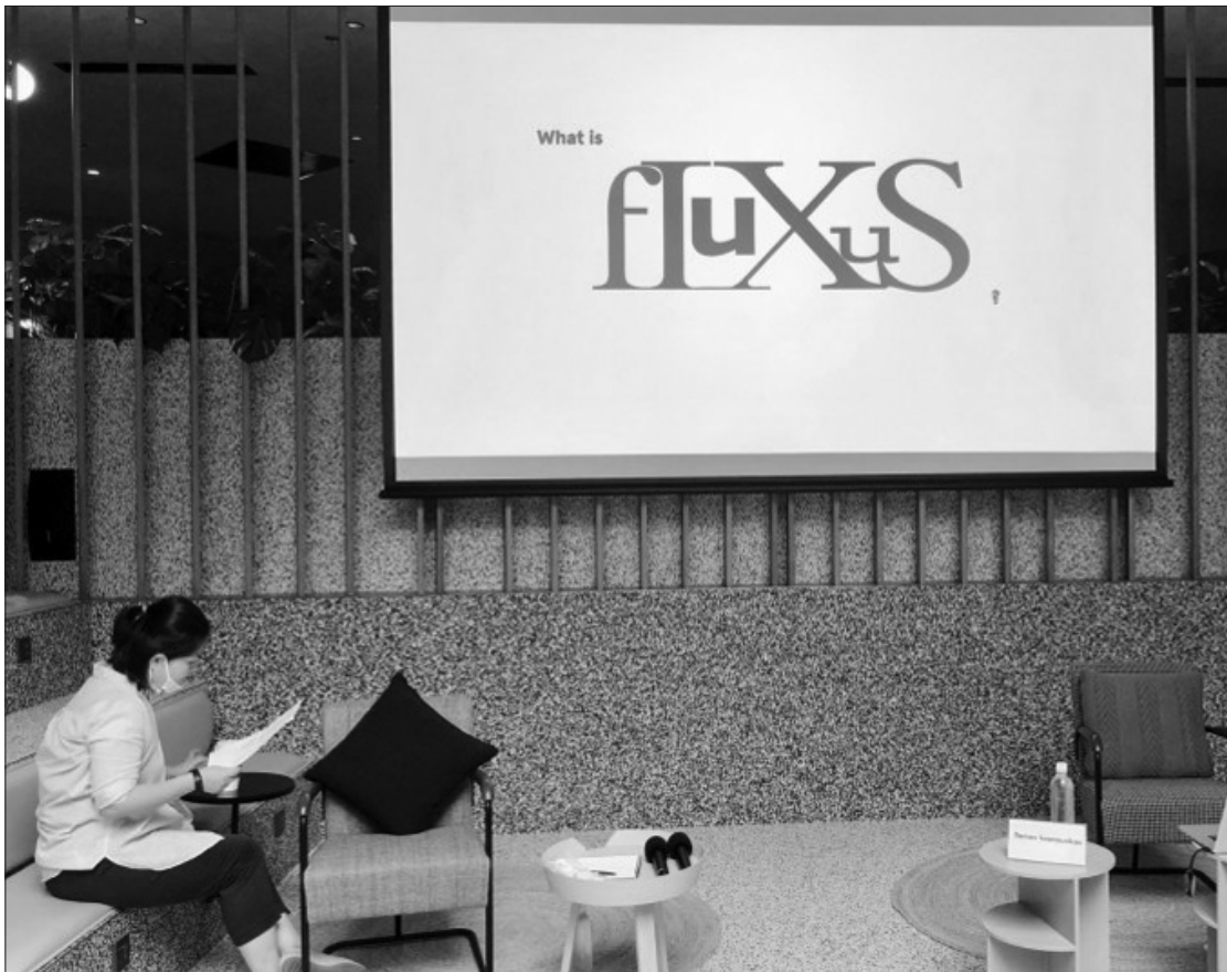
Fluxus minėjimo skelbimas Šanchajuje.