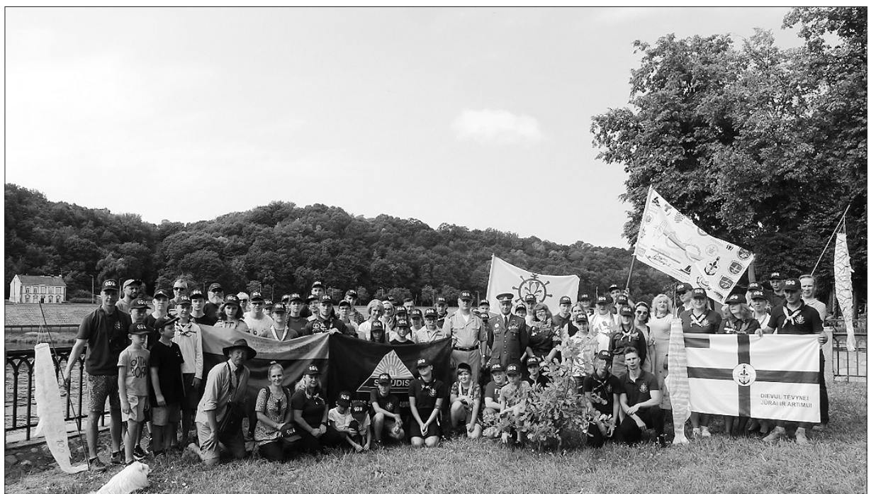
Jūrų skautų išlydėtuvės.