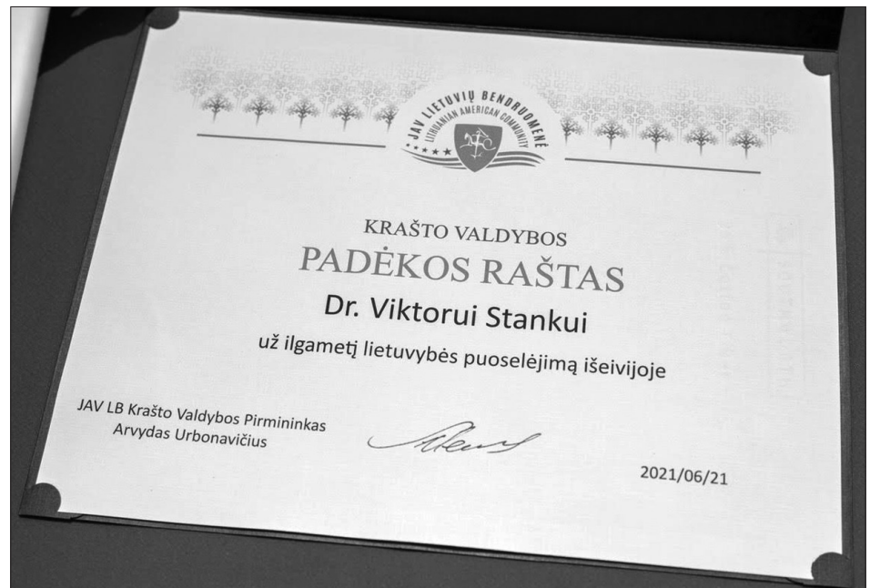
JAV LB krašto valdybos Padėkos raštas.