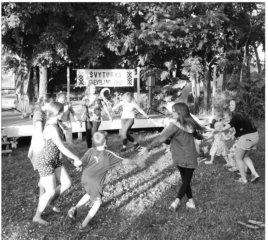
„Po vasaros dangumi“ unikaliame „Waterloo Sculpture Garden“.