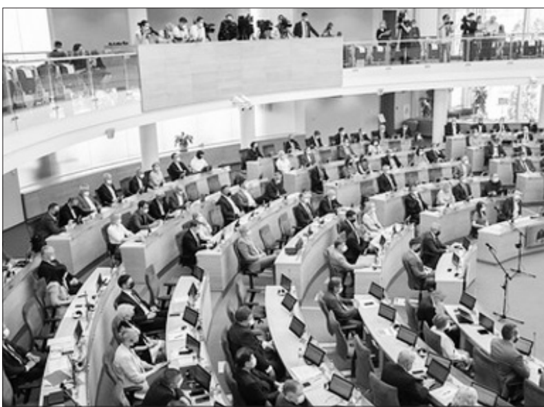
Lietuvos Respublikos Seimo posėdis. LRS

2021 m. liepos 13 d. pranešimas žiniasklaidai