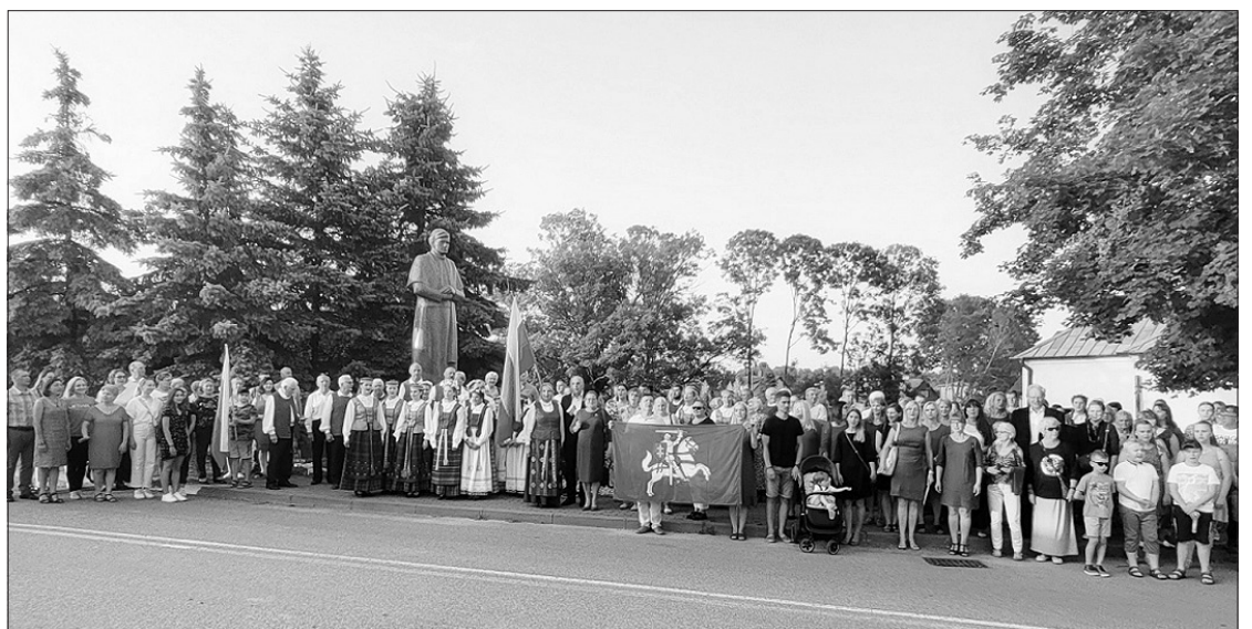
Seinų krašto lietuviai, tęsdami gražią ir prasmingą tradiciją, 21 val. Lietuvos laiku giedojo Tautišką giesmę prie vyskupo ir poeto Antano Baranausko paminklo.