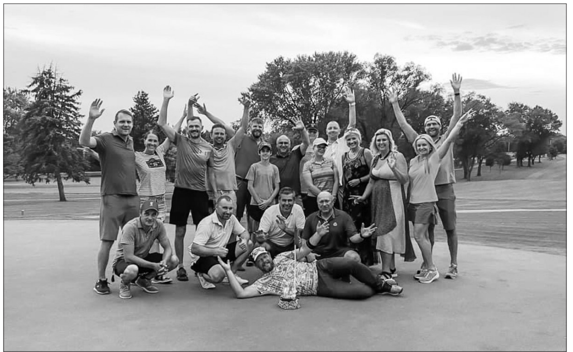
Čikagos lietuvių golfo klubo nariai.

Pradžioje Čikagos lietuvių golfo klubui priklausė 6 nariai, per keletą metų jų skaičius išaugo iki 30, tarp jų yra ne tik įvairaus amžiaus, bet ir įvairių „bangų“ lie-