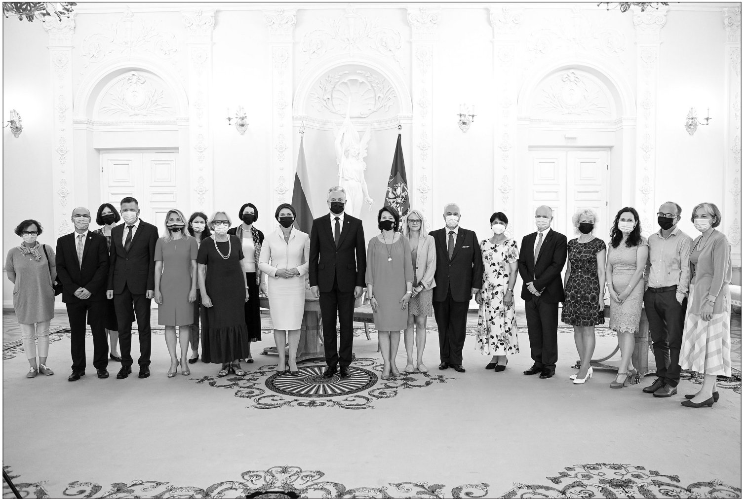
Lietuvos Prezidentas Gitanas Nausėda su Pasaulio lietuvių bendruomenės atstovais.

lituanistinio švietimo klausimams aptarti. Šalies vadovas akcentavo, kad nors užsienyje veikia daugiau nei 200 lituanistinių mokyklų, neoficialiais duomenimis, tik 6 proc. užsienyje augančių lietuvių vaikų sistemingai mokosi kalbos ir