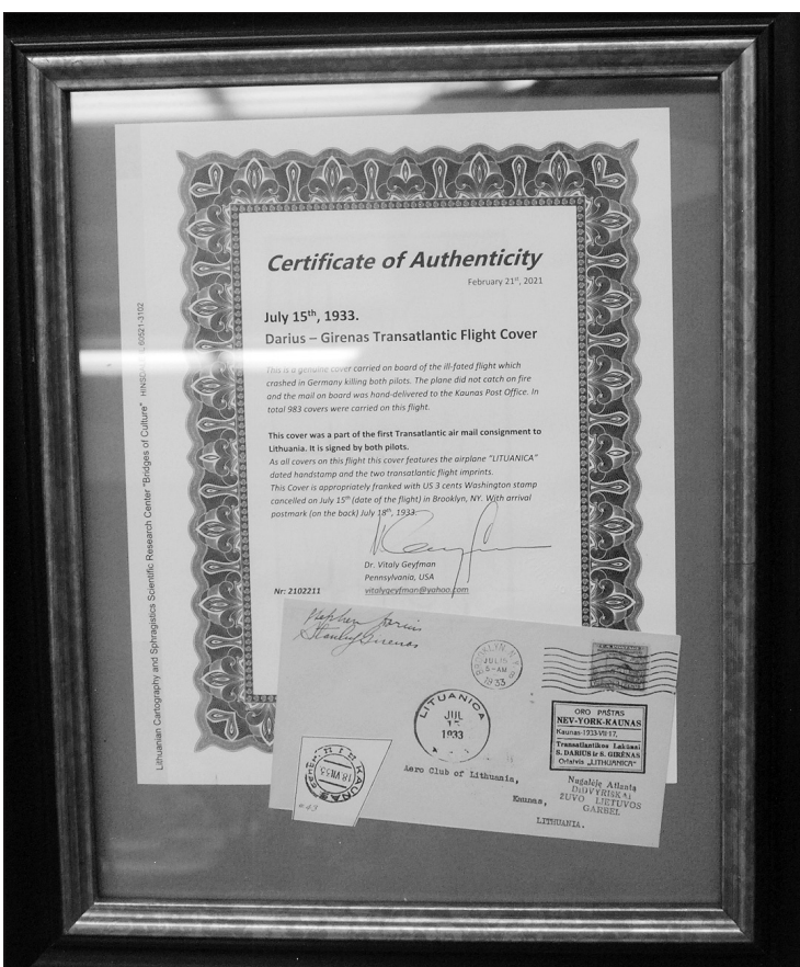
Tarp eksponatų – vokas su originaliais S. Dariaus ir S. Girėno parašais, rastais sudužusiame lėktuve „Lituanica“.