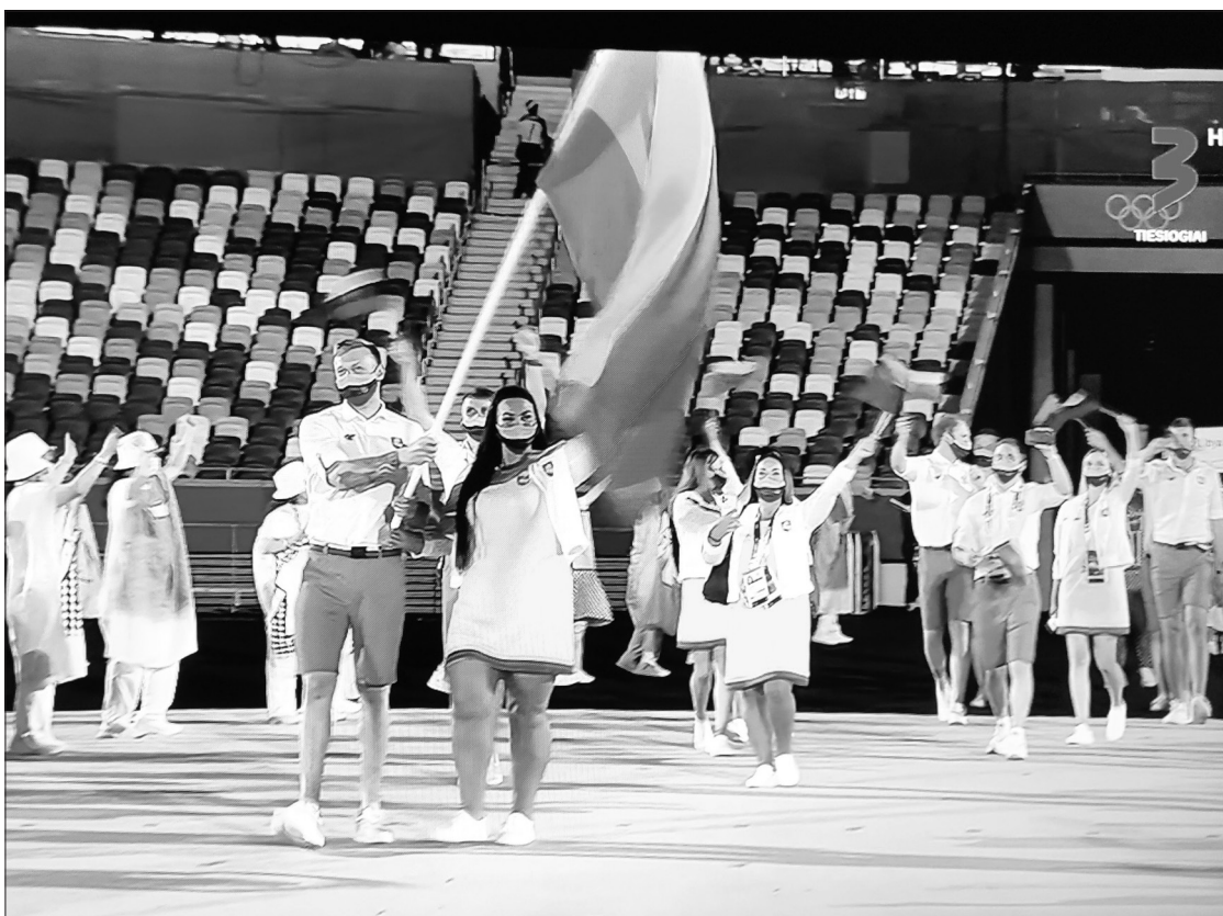
Lietuvos sportininkų delegacija Tokijo olimpiadoje.