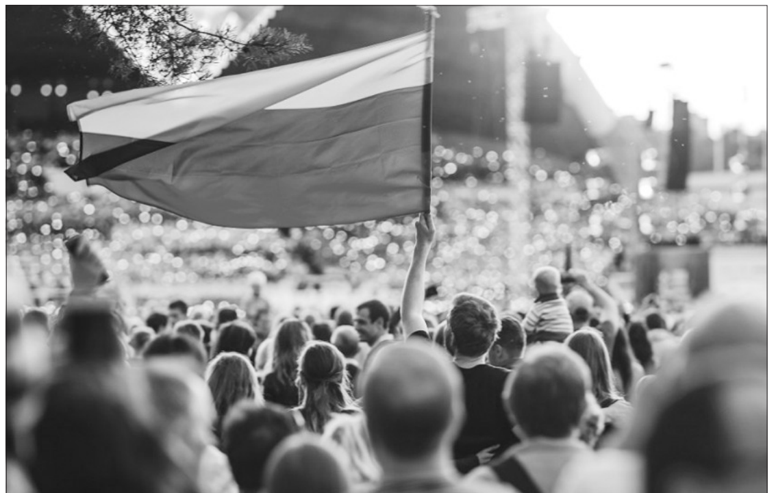
Dainų šventė Vilniuje.

Turizmo sritis buvo pirmoji pagal pranešimų užsienio žiniasklaidoje skaičių (pranešimai sudarė 42 proc. viso žinių apie šalį srauto). Didžioji dalis šios srities naujienų srauto susijusi su COVID-19 pandemijos valdymo (minima statistika, karantino ir judėjimo suvaržymai, skiepijimas ir kt.), pabėgėlių krizės, Lietuvos