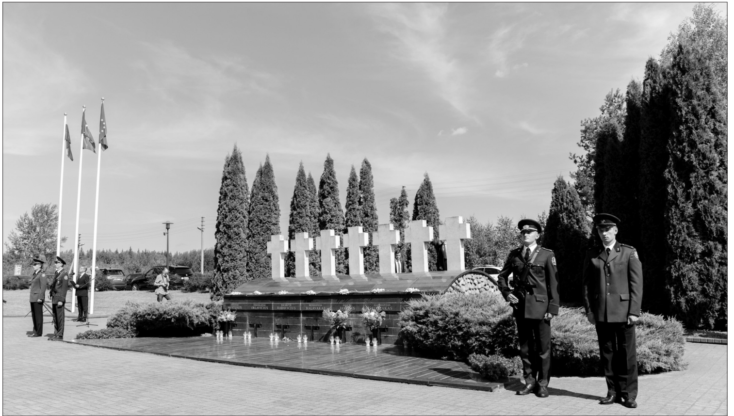
Medininkų tragedijos 30-ųjų metinių minėjimas.

deda geriau suprasti, kokia svarbi buvo Medininkų ir kitų pasienio postų misija. Sienų kontrolė – būtinas Nepriklausomybę atkūrusios valstybės uždavinys. Svarbu, jog buvo įsisąmoninta, kad valstybės gynimas ir stiprinimas nėra vien politinės valdžios reikalas – tai visų pareiga”, – kalbėjo Vyriausybės vadovė.