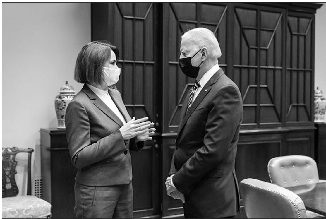
Sviatlana Cichanouskaja ir Joe Bidenas.