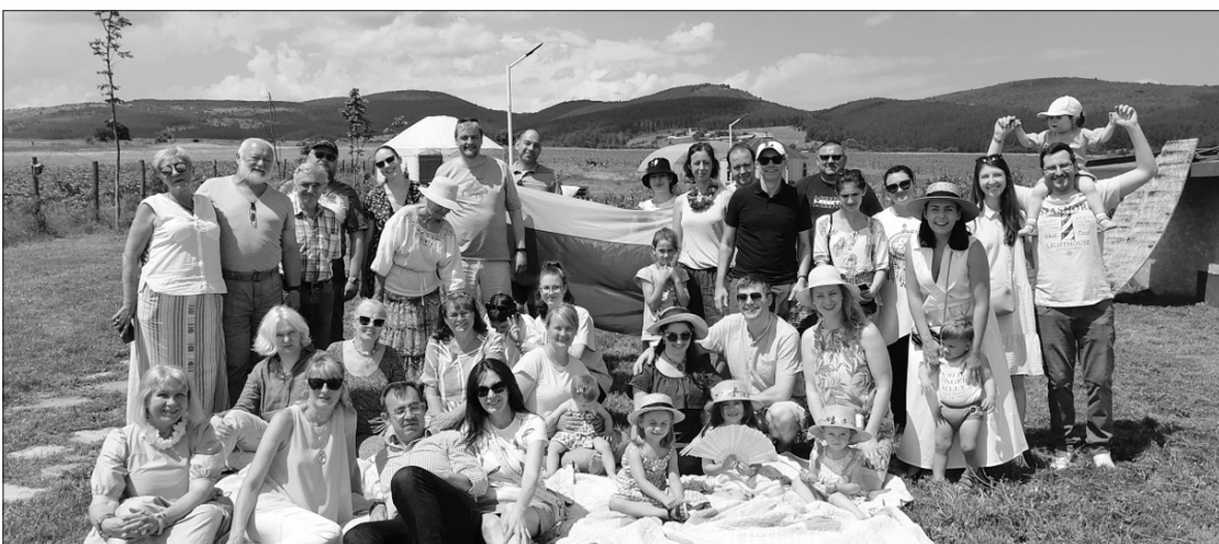
Joninių šventės dalyviai.