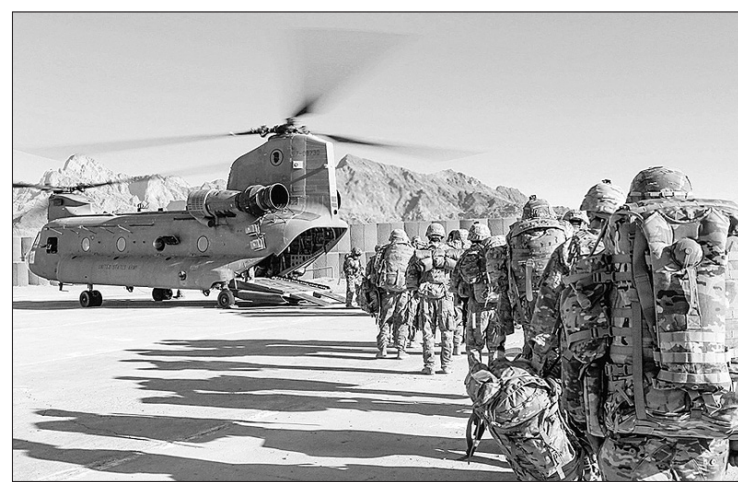
JAV kariai Afganistane.

Šis žingsnis yra vėliausia iš virtinės įtemptus dvišalius santykius paveikusių priemonių,