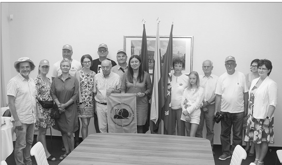
Lietuvos ambasadoje Budapešte Lietuvos žurnalistų sąjungos keliautojų klubo narių grupė.

Liepos 21 d. Lietuvos ambasadoje Budapešte lankėsi Lietuvos žurnalistų sąjungos keliautojų klubo narių grupė, dalyvavusi liepos 19 d. Nyredhazoje vykusiame žymaus Lietuvos keliautojo, fotografo ir poeto Pauliaus Normanto