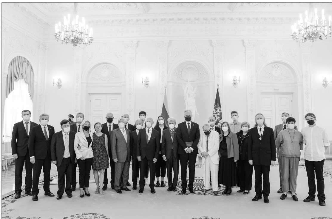
Sutarties 30-mečio proga Prezidentas G. Nausėda įteikė valstybės apdovanojimus Lietuvos ir Rusijos sutarties dėl tarpvalstybinių santykių pagrindų derybų delegacijos nariams.

Prezidento komunikacijos grupė, 2021-07-29