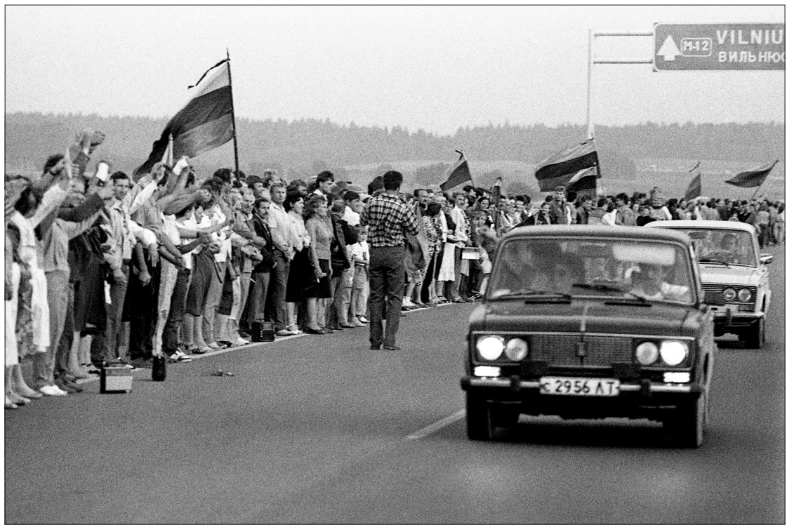
Baltijos kelyje. Vilniaus rajonas, 1989 m. rugpjūčio 23 d.

Lietuvoje Sąjūdžio Seimo taryba per rugpjūčio 16-osios „Atgimimo bangą“ dar kartą