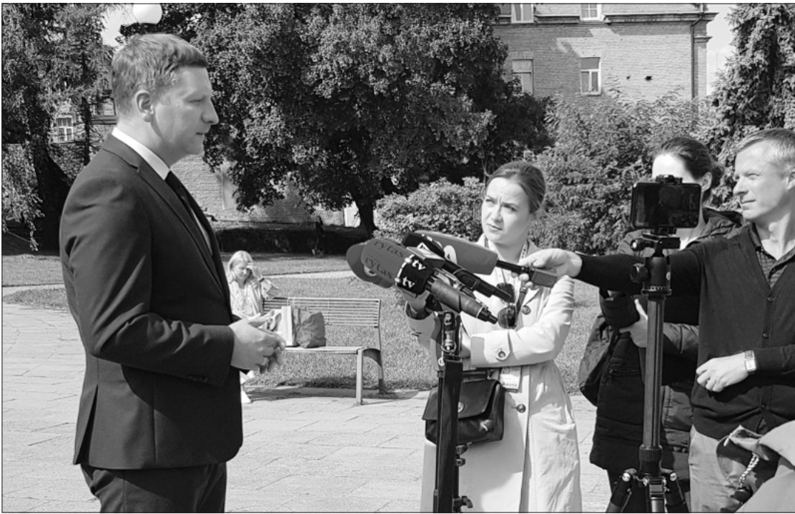
Lietuvos kultūros ministras Simonas Kairys bendrauja su žurnalistais.