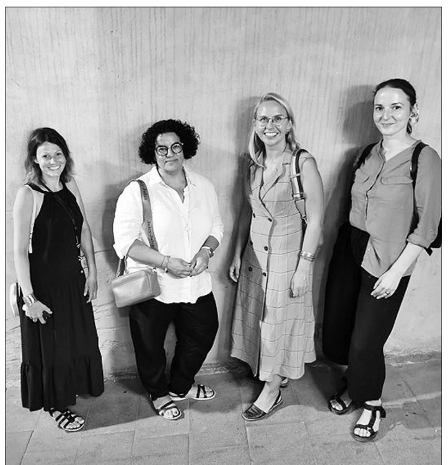
Šiaurės Lietuvos rezidencijos Sicilijoje steigėjai.