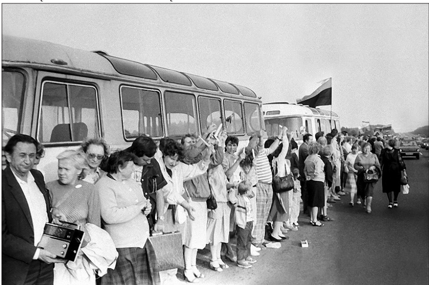
Baltijos kelio dalyviai Vieta nenurodyta, 1989 m. rugpjūčio 23 d.