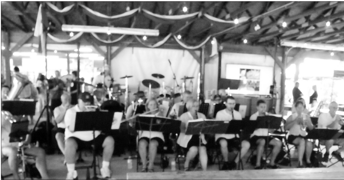
Orkestras pakėlė svečių nuotaiką.