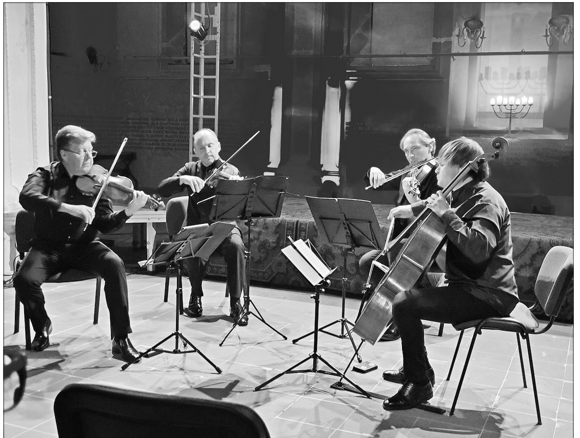
Seinuose Čiurlionio kvartetas atliko M. K. Čiurlionio, A. Šenerovo ir F. Latėno muzikinius kūrinius, sukurtus styginiam kvartetui.

Koncerto organizavimą rėmė Lietuvos nacionalinė filharmonija, Lietuvos kultūros institutas, Lietuvos konsulatą Seinuose bei Menų, kultūrų ir tautų centras „Paribiai“ Seinuose.