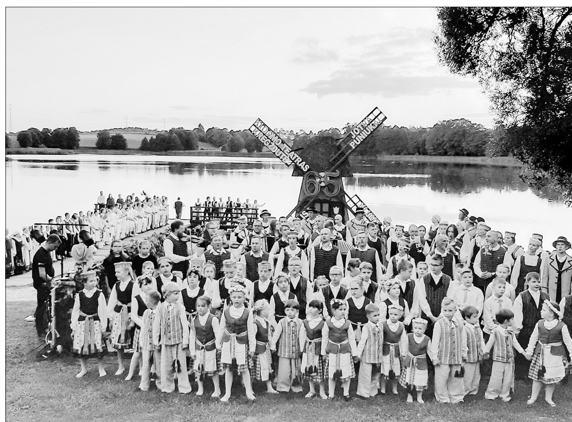
Jubiliejinio koncerto „Iš praeities į dabartį“ dalyviai.