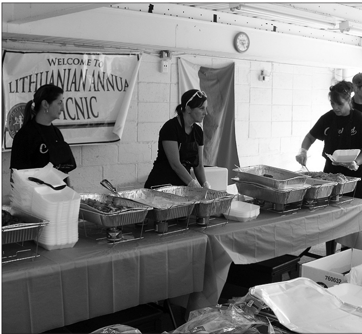
Moterys ir merginos paruošia užsąkytą maistą.