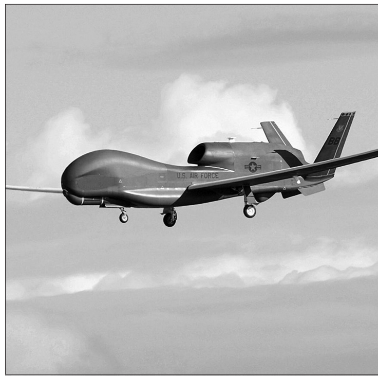
JAV bepilotis orlaivis.

Per savizudžio ataką Kabule rugpjūčio 26 d., ketvirtadienį žuvo mažiausiai 85 žmonės, tarp jų – 13 JAV karių. 18 amerikiečių buvo sužeisti. Atsakomybę už ataką prisiėmė „Islamo valstybė“ (IS).