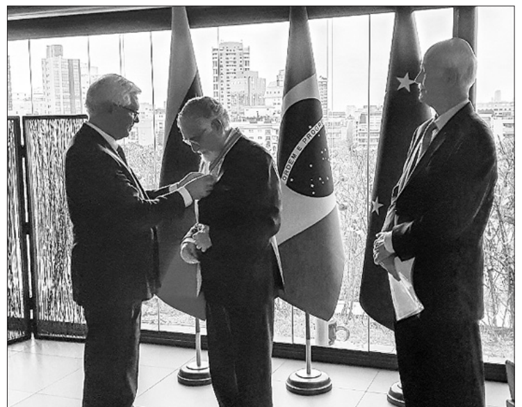
Prof. dr. Celso Lafer įteiktas LR URM garbės ženklas „Lietuvos diplomatijos žvaigždė”.