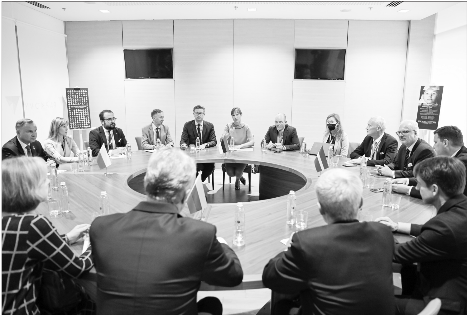
Lietuvos Respublikos Prezidentas dalyvavo pasitarime su Latvijos, Estijos ir Lenkijos Prezidentais.

„Siūlau kartu inicijuoti diskusijas Briuselyje keliais klausimais – dėl būtinybės peržiūrėti ES migracijos politiką ir išorinių sienų apsaugą reglamentuo-