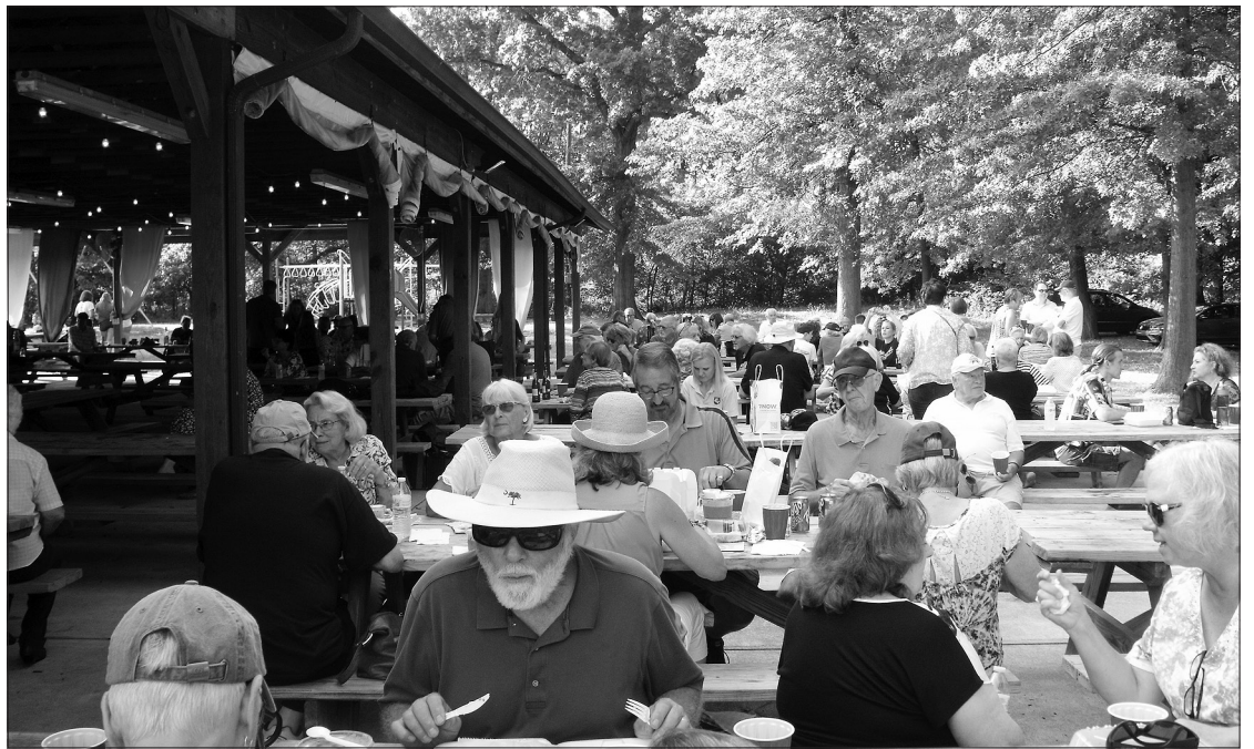
Svečiai gardžiavosi lietuvišku maistu.