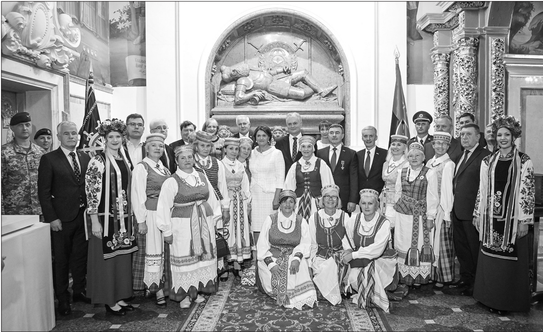
Lietuvos Respublikos Prezidentas Gitanas Nausėda dalyvauja Konstantino Ostrogiškio antkapinio paminklo atidengimo ceremonijoje.