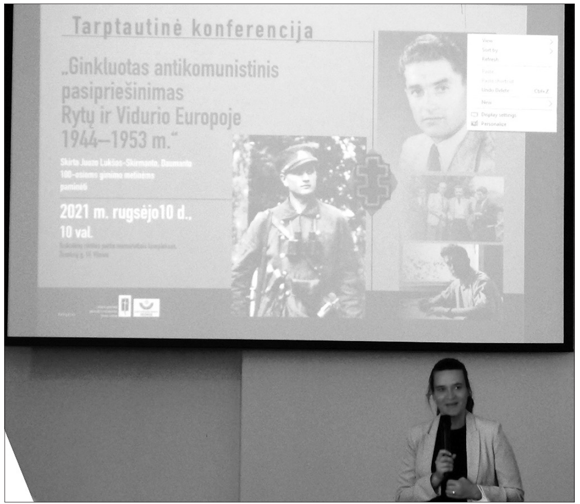
Pranešimą skaito LR Seimo pirmininko pavaduotoja Radvilė Morkūnaitė-Mikulėnienė.