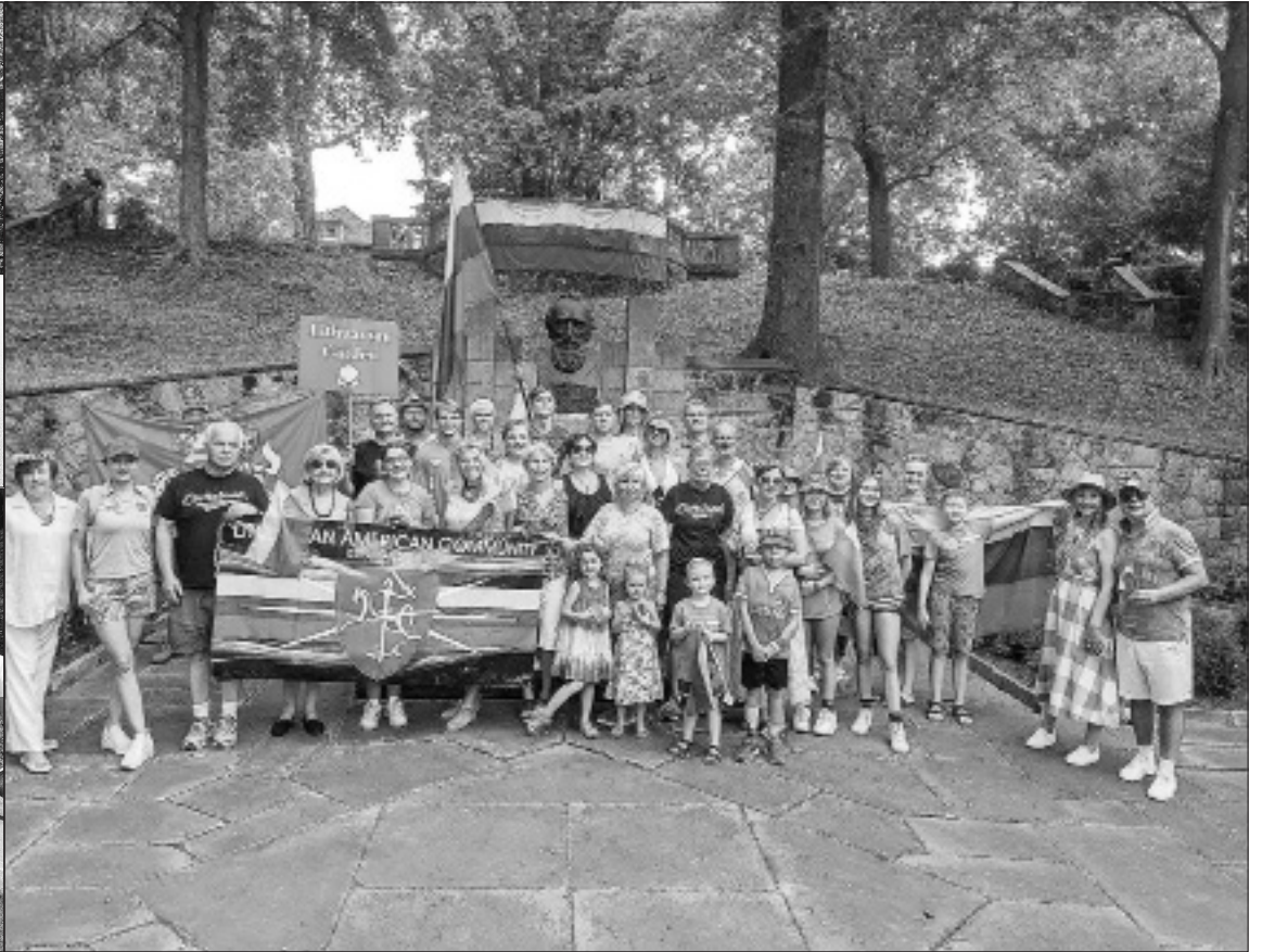
Rugpjūčio 29 d. Vieno pasaulio dienos (One World Day) šventės Klivlande, OH akimirks. Lietuvių kultūros darželis (Lithuanian Garden) šiais metais šventė 85 metų sukaktį.