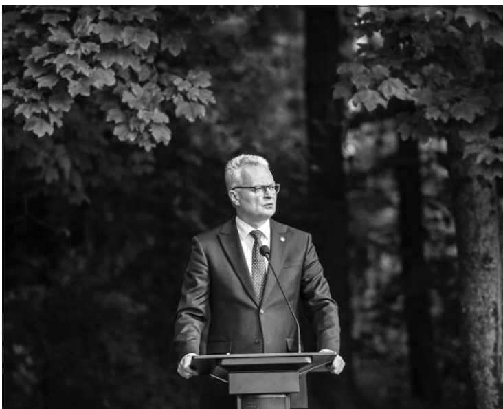
Lietuvos Respublikos Prezidentas Gitanas Nausėda.

Šeštadienį Lietuvos Respublikos Prezidentas Gitanas Nausėda dalyvavo iškilmingame Juozo Lukšos-Daumanto 70-ųjų žūties metinių minėjime.