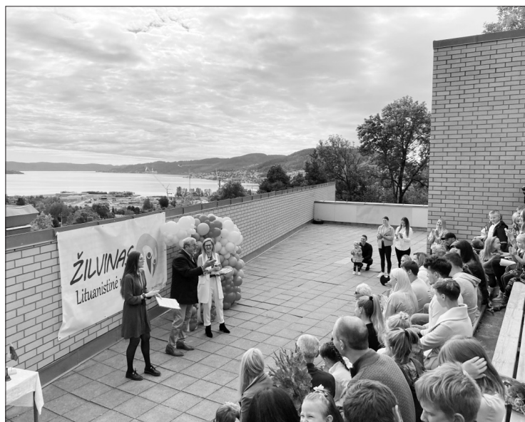
Naujų mokslo metų atidarymo šventė lituanistinėje mokykloje Dramene, Norvegijoje.