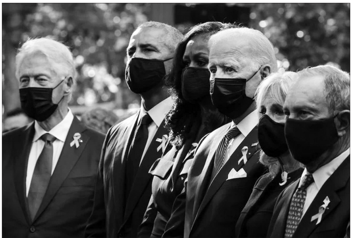
Rugsėjo 11-osios aukas tylos minute pagerbė buvę ir esantys aukščiausi JAV valstybės vadovai. Stop kadras

Parengta pagal Lietuvos žiniasklaidos pranešimus