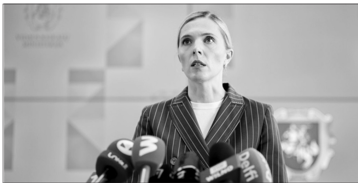
Vidaus reikalų ministrė Agnė Bilotaitė spaudos konferencijoje.

Rugsėjo 10 d. Lietuvos, Latvijos, Estijos ir Lenkijos vidaus reikalų ministrai ir viceministrai, tęsdami reguliarias diskusijas ir veiksmų koordinavimą, nuotolinio susitikimo metu aptarė Lietuvos iniciatyvą keisti Europos Sąjungos (ES) teisės aktus sienos apsaugos, migracijos valdymo ir prieglobsčio srityse.