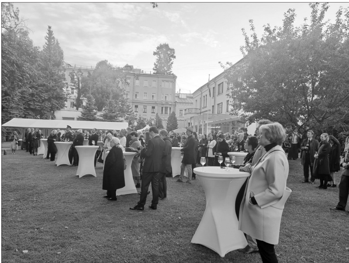
Latvijos Respublikos ambasadoje Rusijos Federacijoje vyko renginys „Baltijos laisvės šventė“.