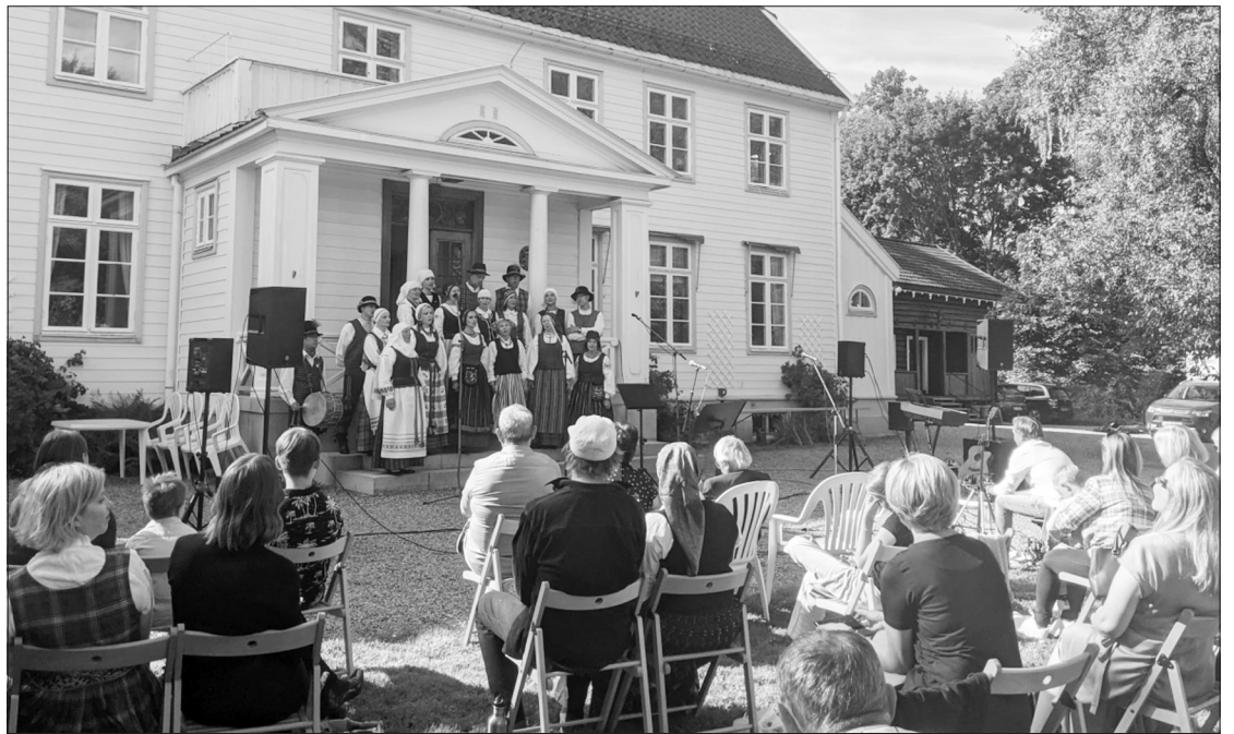
Trijų Baltijos šalių bendruomenių rugpjūčio 28 d. tradicinė „Baltijos vasaros šventė“.