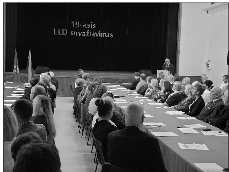
„Lietuvių namuose“ Seinuose vyko Lenkijos lietuvių draugijos XIX suvažiavimas.