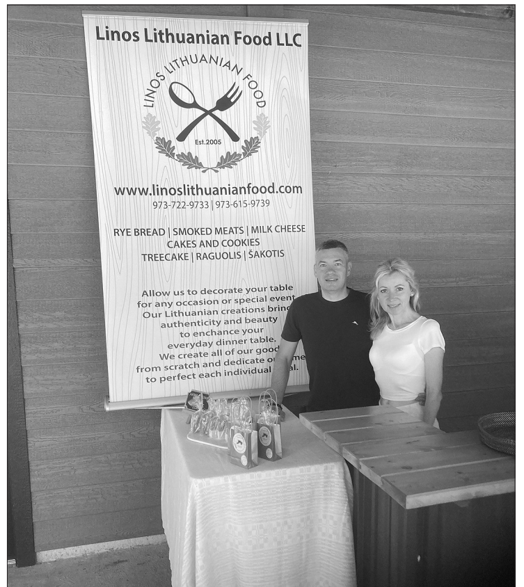
Autoriaus nuotraukose - šventės akimirkos.