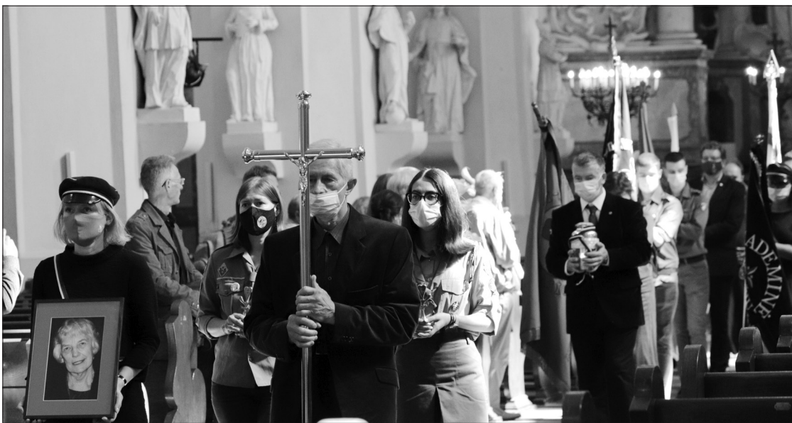
Urną iš Šv. Jonų bažnyčios lydėjo 7 skautų vėliavos, Vilniaus universiteto komunikacijos fakulteto vėliava ir Lietuvos žurnalistų sąjungos vėliava.