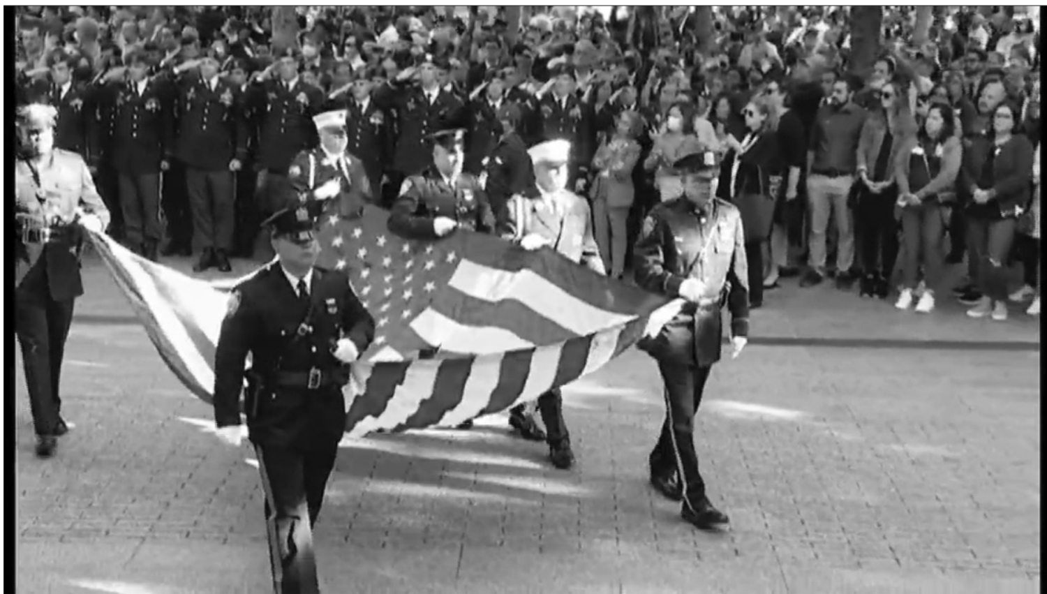
Rugsėjo 11-osios minėjimas Niujorke.

Pasaulio vadovai pasiuntė solidarumo žinutes, minint