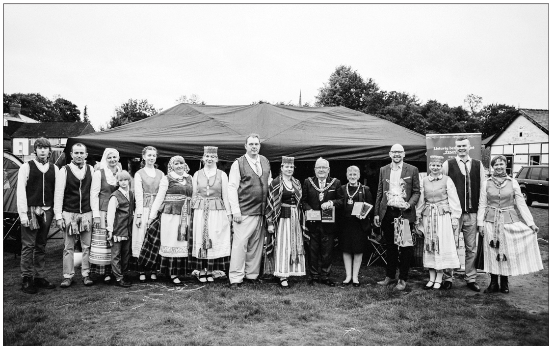
Mančesterio lietuvių bendruomenės ir Lietuvos užsienio reikalų ministerijos lietuviškų amatų šventėje.