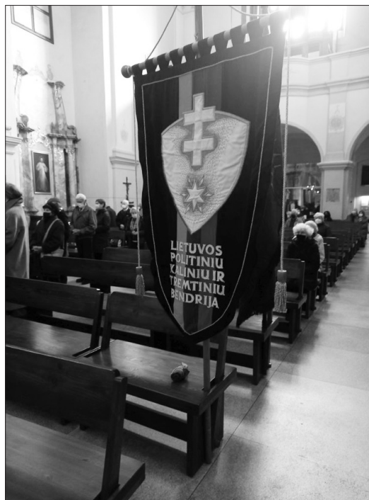
Žuvusiems pagerbti buvo aukojamos šv. Mišios Šv. apaštalo Jokūbo ir Pilypo bažnyčioje. LGGTC