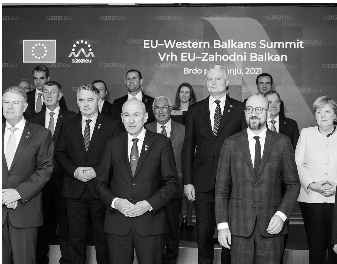
Lietuvos Prezidentas Gitanas Nausėda dalyvavo Europos Sąjungos - Vakarų Balkanų šalių viršūnių susitikime (Slovėnija).

Prezidento komunikacijos grupė, 2021-10-06