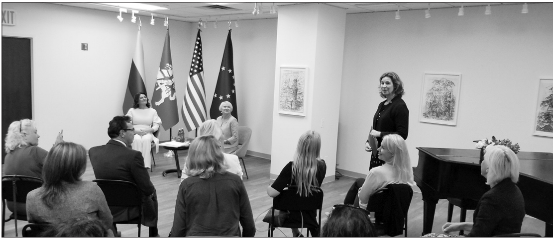
Lituanistinio švietimo atstovų susitikimas Niujorke su Diana Nausėdiene, kuri globoja lituanistinį švietimą užsienyje.

Rugsėjo 21 d. Lietuvos generaliniame konsulate vyko šiltas ir nuoširdus lituanistinio švietimo atstovų susitikimas su Niujorke viešintičia Diana Nausėdiene, kuri globoja lituanistinį švietimą užsienyje.