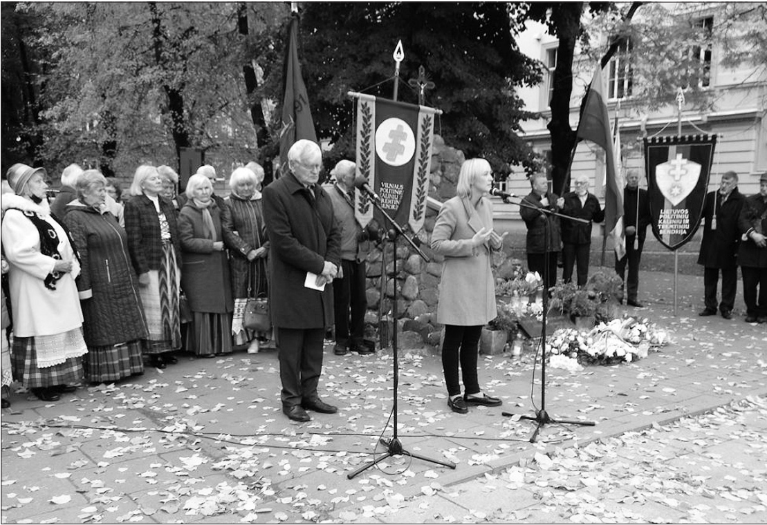
Lietuvos politinių kalinių ir tremtinių sąjungos ir Vilniaus politinių kalinių ir tremtinių bendrijos minėjimas 1951 metų spalio 2–3 d. trėmimo kodiniu pavadinimu „Ruduo“ 70-osioms metinėms atminti. LGGTC

2021 m. spalio 4 d. Lietuvos politinių kalinių ir tremtinių sąjunga kartu su Vilniaus politinių kalinių ir tremtinių bendrija organizavo 1951 metų spalio 2–3 d. trėmimo kodiniu pavadinimu „Ruduo“ 70-osioms metinėms atminti skirtą renginį. Žuvusiems pagerbti buvo aukojamos šv. Mišios Šv. apaštalo Jokūbo ir Pilypo bažnyčioje.