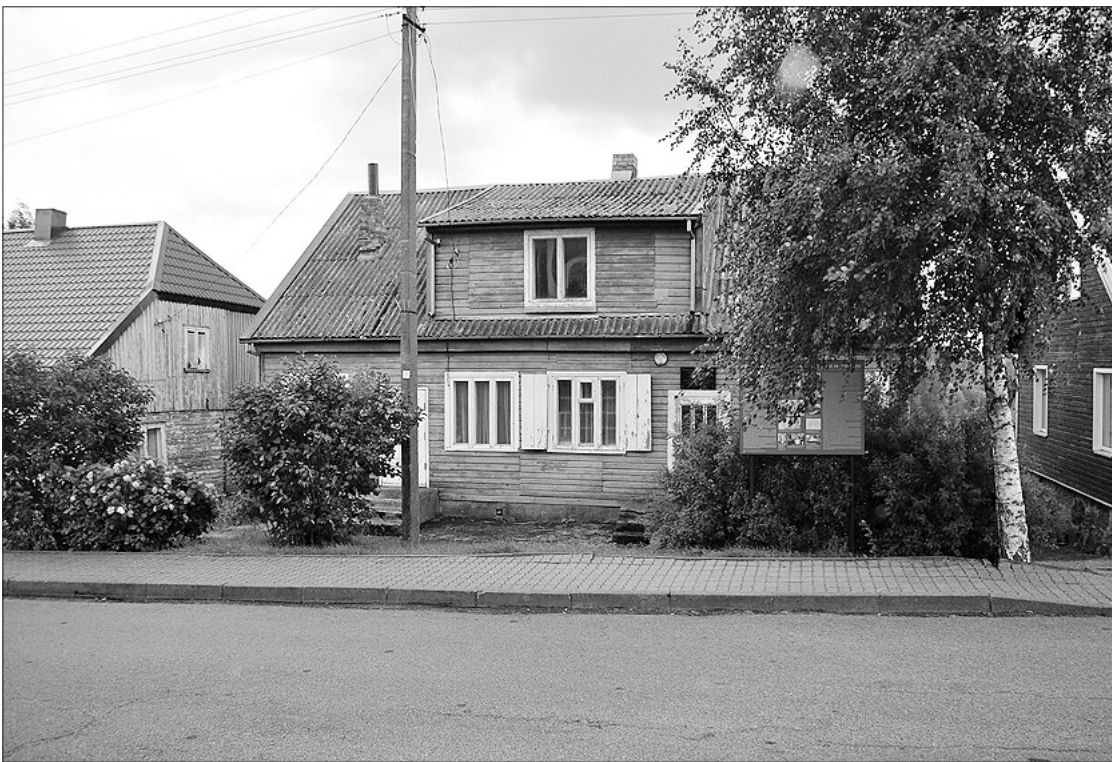
Dalios Grinkevičiūtės sodyba Laukuvoje.