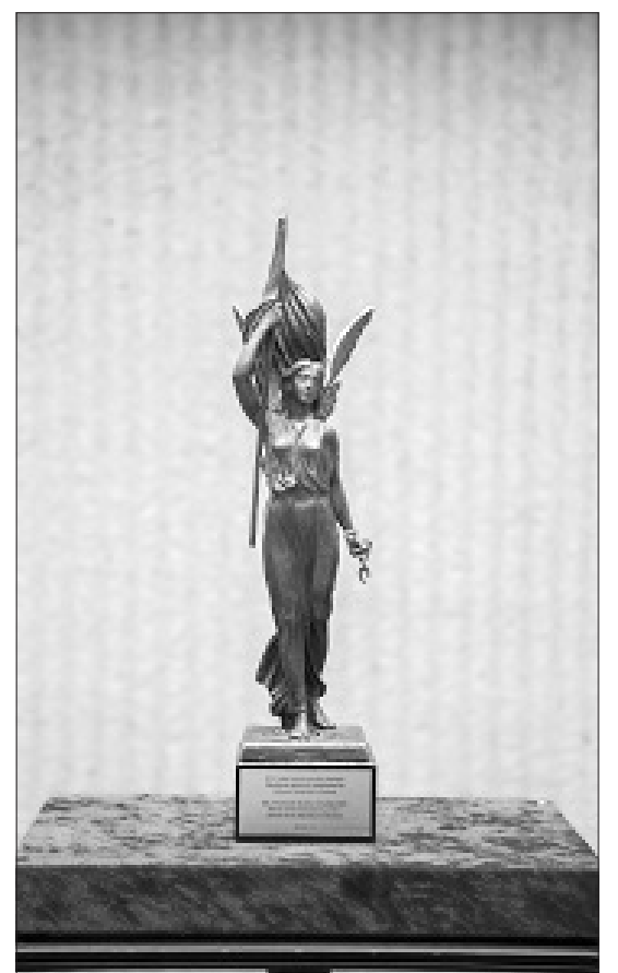
Laisvės premijos statulėlė.