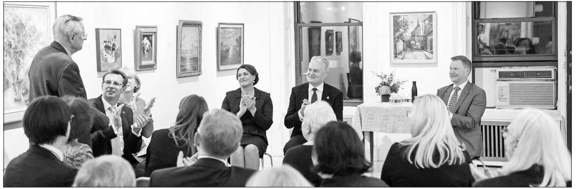
Lietuvos Prezidentas Gitanas Nausėda su ponia Diana Nausėdiene apsilankė Susivienijime Lietuvių Amerikoje (SLA).