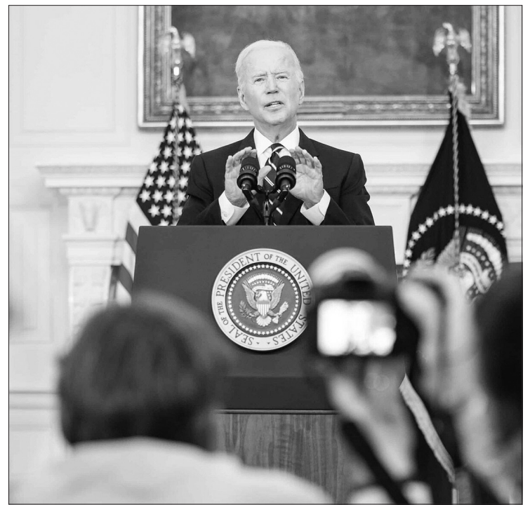
JAV prezidentas Joe Biden.

„Jie buvo atkaklūs, įkūrė nepriklausomas žiniasklaidos priemonės ir gynė jas nuo jėgų, siekiančių, kad jos tylėtų“, – pridūrė prezidentas.