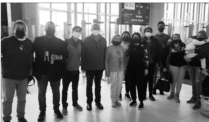
Iš Venesuelos į Lietuvą buvo perkelta 12 Lietuvos Respublikos piliečių, lietuvių kilmės asmenų bei jų šeimos narių.

Dalyvių skaičius ribotas, atsižvelgiant į Niujorko valstijos reikalavimą, visi atvykstantys į parodos atidarymą turės pateikti vakcinavimo kortelę (arba neigiamą 72 val. testą) ir asmens tapatybės dokumentą. LR URM