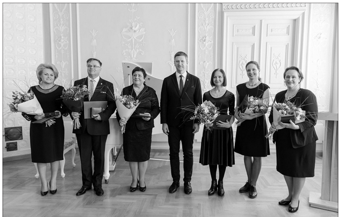
Įteikti svarbiausi Lietuvos kultūros ministerijos apdovanojimai.

Už talentą ir aktorinį meistriškumą, sukurtus įsimintinus vaidmenis, prasmingą vertybių ir patirties perdavimą jaunajai kartai, ilgametį atkaklų darbą, telkiant teatrą, kuriančių vaikams ir jaunimui, bendruomenę Lietuvoje garbės ženklu „Nešk savo šviesą ir tikėk“ apdovanota teatro ir kino aktorė, Teatrų vaikams ir jaunimui asociacijos „Asitežas“ ini-