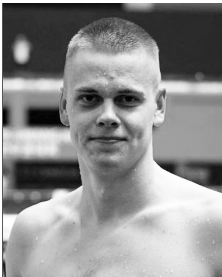
Lietuvos plaukikas, LTeam komandos narys, olimpietis Danas Rapšys.