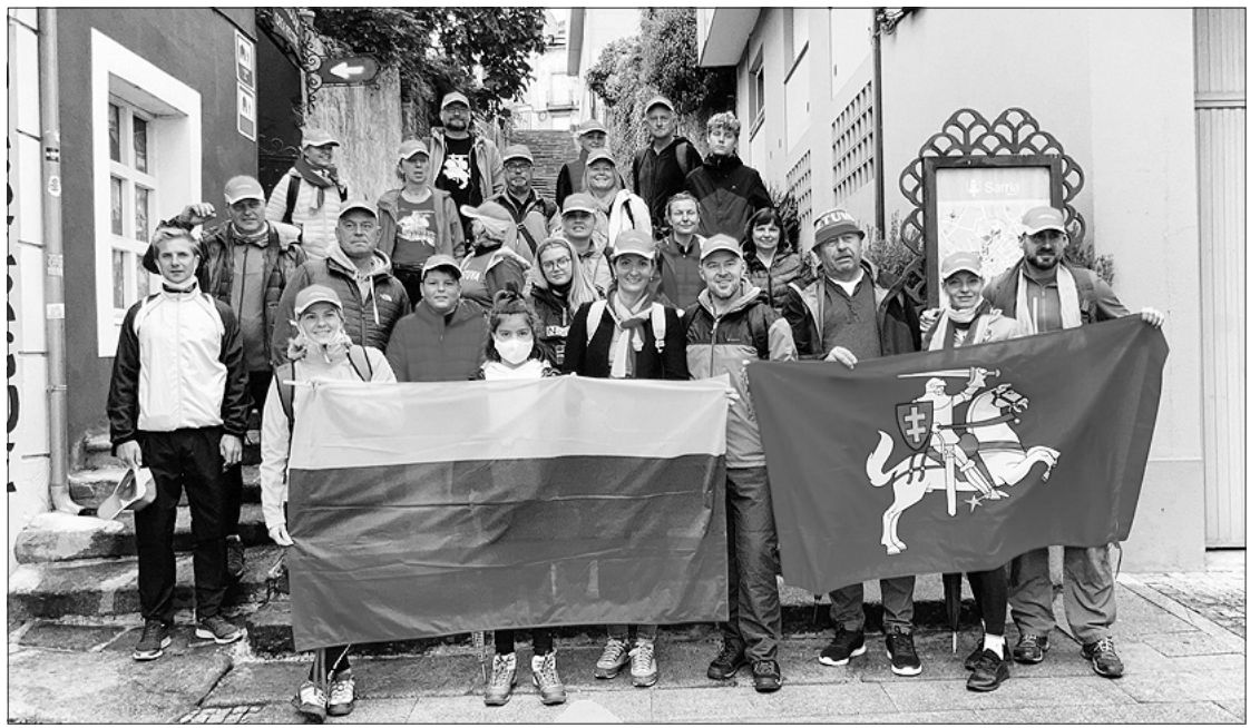
Piligriminio žygio Šv. Jokūbo keliu dalyviai.