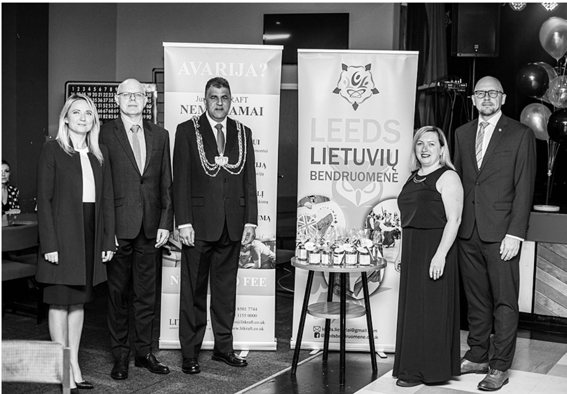
JK Leeds lietuvių bendruomenės 10 metų jubiliejaus šventėje.