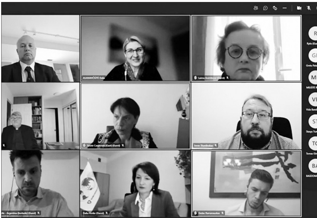
Seimo ir Pasaulio lietuvių bendruomenės komisija svarstė balsavimo internetu kibernetinio saugumo klausimą ir aptarė pasiruošimą referendumui dėl pilietybės išsaugojimo. LRS

Spalio 1 d. posėdžiavusi Seimo ir Pasaulio lietuvių bendruomenės komisija svarstė balsavimo internetu kibernetinio saugumo klausimą ir aptarė pasiruošimą referendumui dėl pilietybės išsaugojimo. Posėdžio metu buvo priimtos dvi rezolucijos: