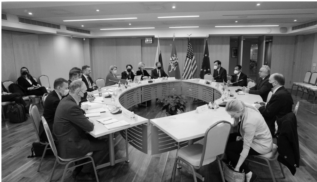
Dvišalis Lietuvos ir Jungtinių Amerikos Valstijų (JAV) strateginio dialogo Indijos–Ramiojo vandenynų regiono klausimais susitikimas Vašingtone D.C., JAV.

Lapkričio 23 dieną, užsienio reikalų ministro Gabrieliaus Landsbergio vizito Vašingtone metu, įvyko pirmasis Lietuvos valstybės istorijoje dvišalis Lietuvos ir Jungtinių Amerikos Valstijų (JAV) strateginio dialogo Indijos–Ramiojo vandenynų regiono klausimais susitikimas.