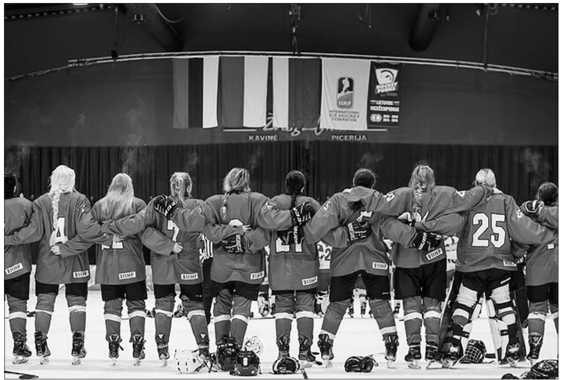
Lietuvos moterų ledo ritulio rinktinė.

Šiose rungtynėse geriausia susitikimo žaidėja Lietuvos rinktinės gretose buvo pripažinta puikų susitikimą