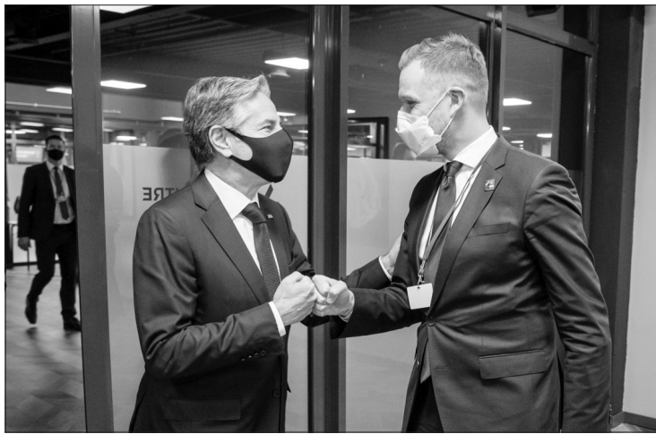
LR užsienio reikalų ministras Gabrielius Landsbergis susitiko su Jungtinių Amerikos Valstijų (JAV) valstybės sekretoriumi Antony Blinkenu (kairėje).

Susitikimo metu Lietuvos ir JAV diplomatijos vadovai aptarė saugumo padėtį NATO Rytiniame flange ir susirūpinimą keliantį Rusijos karinių pajėgų telkimą prie Ukrainos. Susitikime taip pat pabrėžta, kad tarptautinė bendruomenė turi išlaikyti spaudimą Aliaksandro Lukašenkos režimui ir