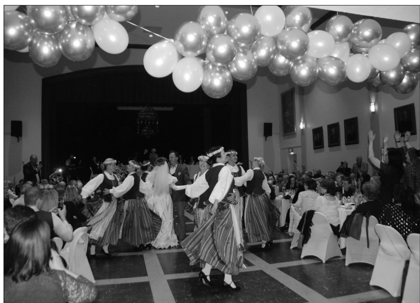
Visus užbūrė šokių kolektyvo „Rusnė“ šokis, į savo sukurį įtraukęs ir pokylio svečius.

„Dirvos“ korespondentė Živilė Gurauskienė