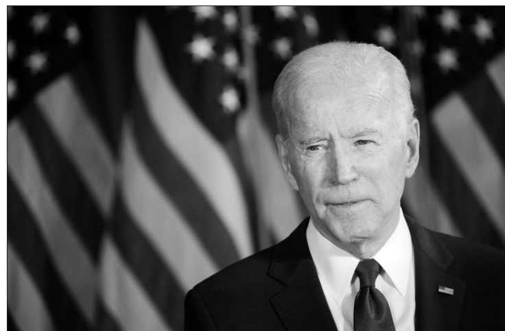
JAV prezidentas Joe Biden.

Lapkričio 30 d. Austrijos sostinėje atsinaujino derybos dėl galimybės atgaivinti branduolinį susitarimą su