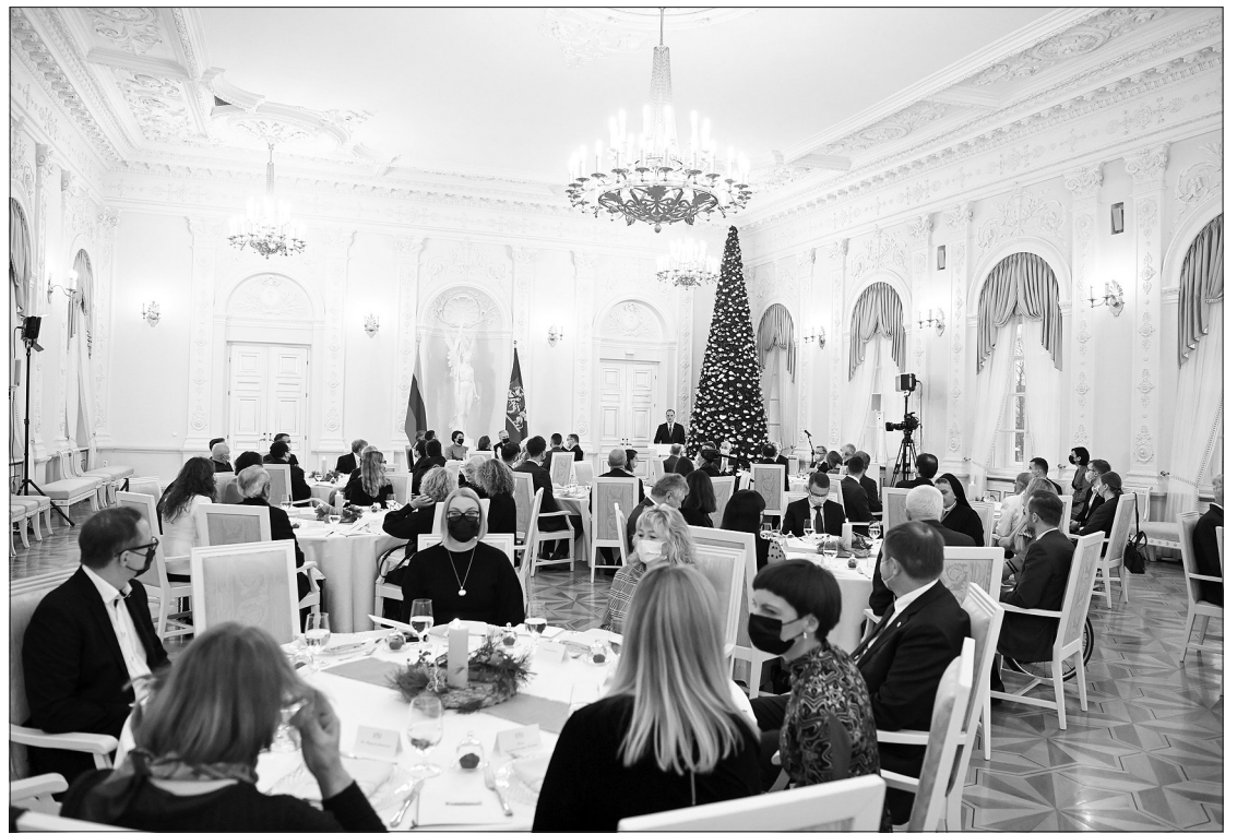
Maldos pusryčiai Prezidentūroje.

Į susirinkusiuosius savo žodžiu taip pat kreipėsi Švenčionių Visų Šventųjų parapijos