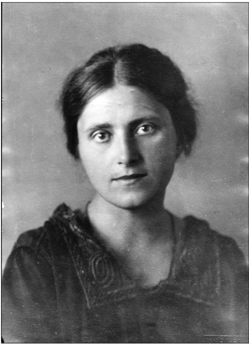
S. Kymantaitė-Čiurlionienė 1886–1958

1886 m. kovo 13 d. Šiaulių apskrityje, Joniškėje, gimė garsi lietuvių rašytoja, visuomenės veikėja, literatūros ir meno kritikė, dramaturgė, poetė, vertėja, skaučių vadė ir pedagogė Sofija Kymantaitė-Čiurlionienė. Sukakties proga verta prisiminti ir visuomenei priminti apie talentingos lietuvių inteligentės nuveiktus darbus Lietuvos švietimo ir kultūros lauke.