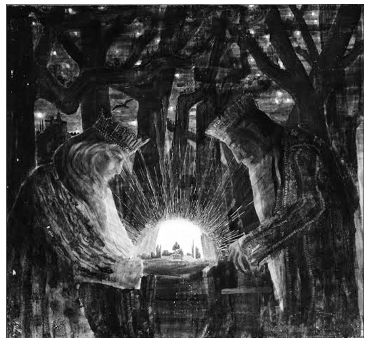
Pasaka (Karalių pasaka). Drobė, tempera. 1909. Dail. Mikalojus Konstantinas Čiurlionis (1875–1911).