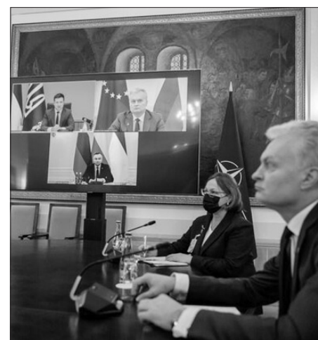
Lietuvos Prezidento Gitano Nausėdos nuotolinis susitikimas su Ukrainos Prezidentu Volodymyru Zelenskiu ir Lenkijos Prezidentu Andrzejumi Duda.

paragino tarptautinę bendruomenę sugriežtinti sankcijas Rusijos Federacijai dėl jos vykdomos agresijos prieš Ukrainą