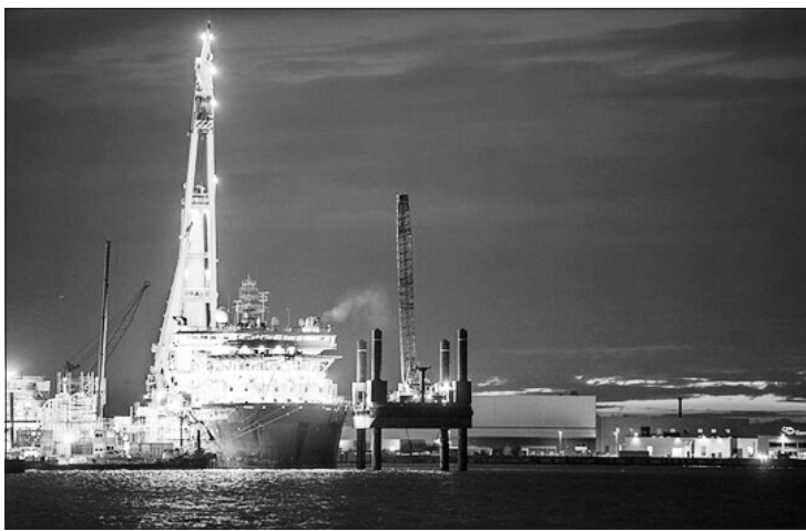
„Nord Stream 2“ dujotiekis.