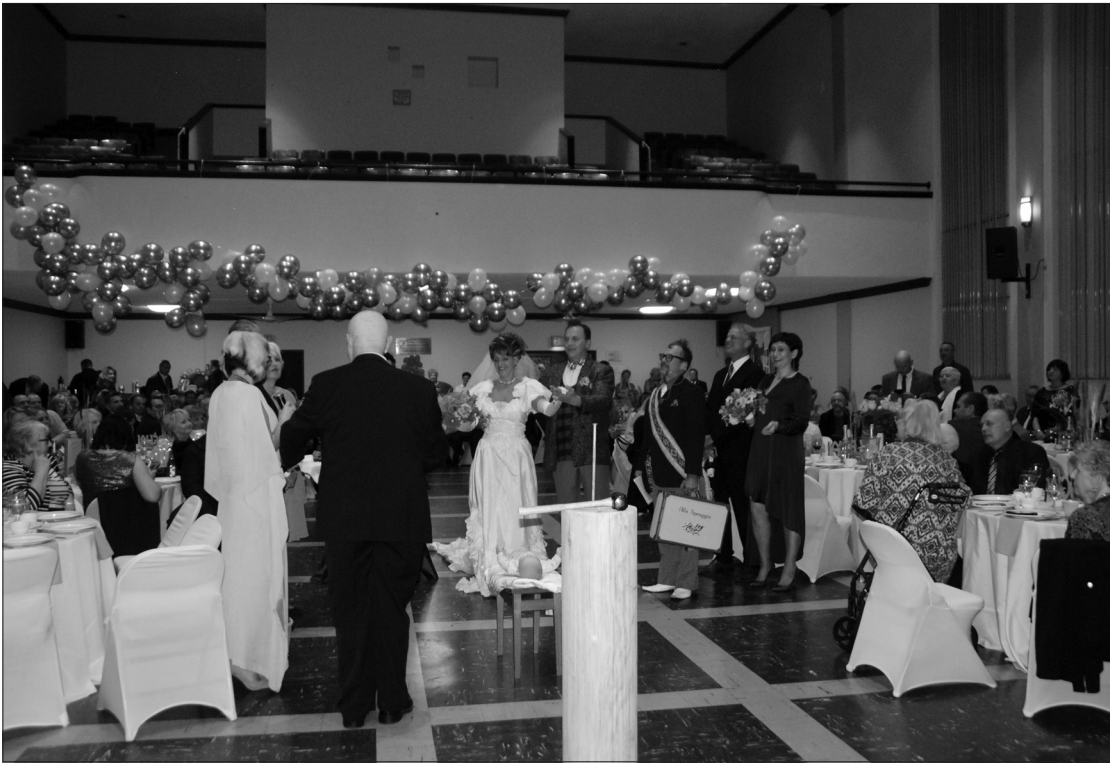
Išėivijoje gyvenantys lietuviai susirinko į vieną linksmiausių metų renginių – inscenuotą vestuvių pokylį „Smagios lietuviškos vestuvės“.