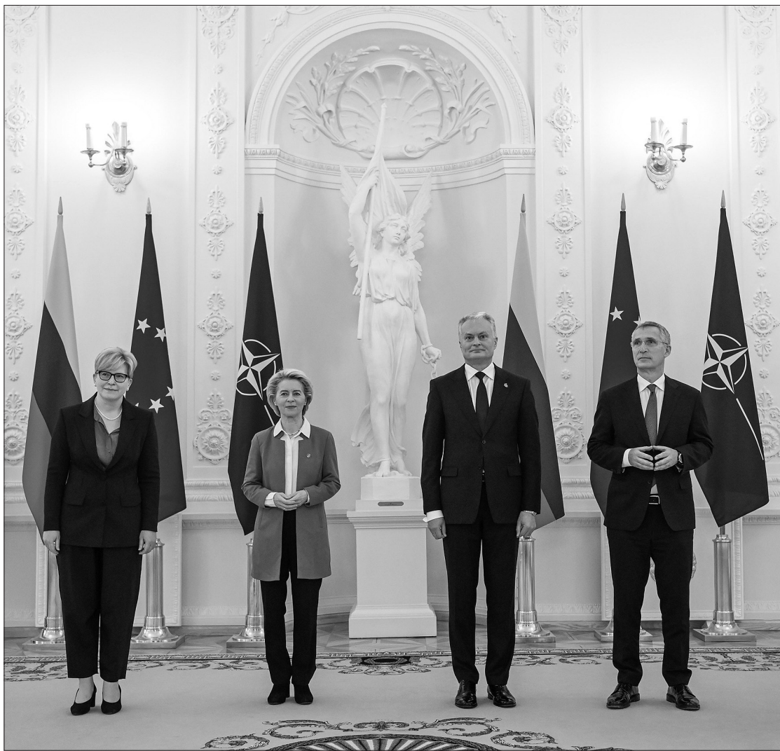
Iš kairės: Lietuvos Ministrė Pirmininkė Ingrida Šimonytė, Europos Komisijos Pirmininkė Ursula von der Leyen, Lietuvos Prezidentas Gitanas Nausėda ir Šiaurės Atlanto sutarties organizacijos (NATO) Generalinis Sekretorius Jensas Stoltenbergas.

Lietuvos Respublikos Prezidentas Gitanas Nausėda ir Ministrė Pirmininkė Ingrida Šimonytė lapkričio 28 d. Prezidentūroje susitiko su Šiaurės Atlanto sutarties organizacijos (NATO) generaliniu sekretoriumi Jenu Stoltenbergu ir Europos Komisijos (EK) pirmininke Ursula von der Leyen.