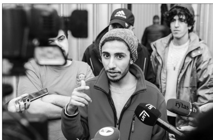
Neteisėtai atvykę migrantai bendrauja su žiniasklaidos atstovais.

Tikimasi, kad šis interneto puslapis bus ne tik patogus įrankis Lietuvos ir užsienio žiniasklaidos atstovams, rengiantiems reportažus apie migracijos krizę ir padėti prie