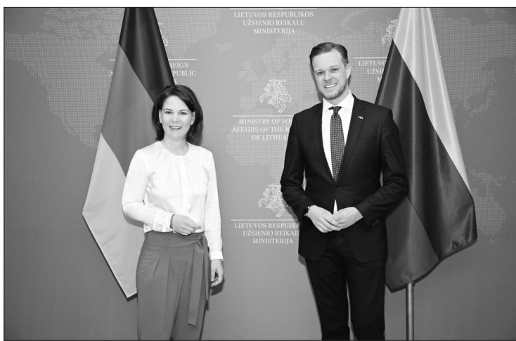
Vokietijos užsienio reikalų ministrė Annalena Baerbock ir Lietuvos užsienio reikalų ministras Gabrielius Landsbergis.

Balandžio 22 dieną užsienio reikalų ministras Gabrielius Landsbergis susitiko su Vokietijos užsienio reikalų ministre Annalena Baerbock , kuri lankėsi Lietuvoje su oficialiu vizitu. Ministras