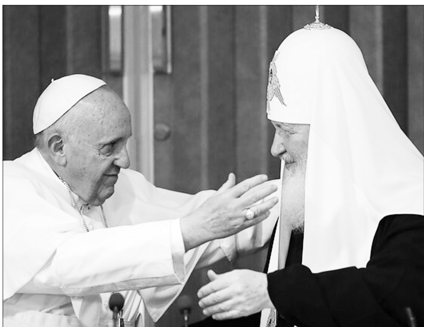
Popiežius Pranciškus ir Maskvos patriarchas Kirilas.

Panašiai buvo skelbiama ir ankstesnėse ataskaitose, tačiau jos buvo vengiama frazės „neteisėtai okupuotos“ teritorijos. LRT