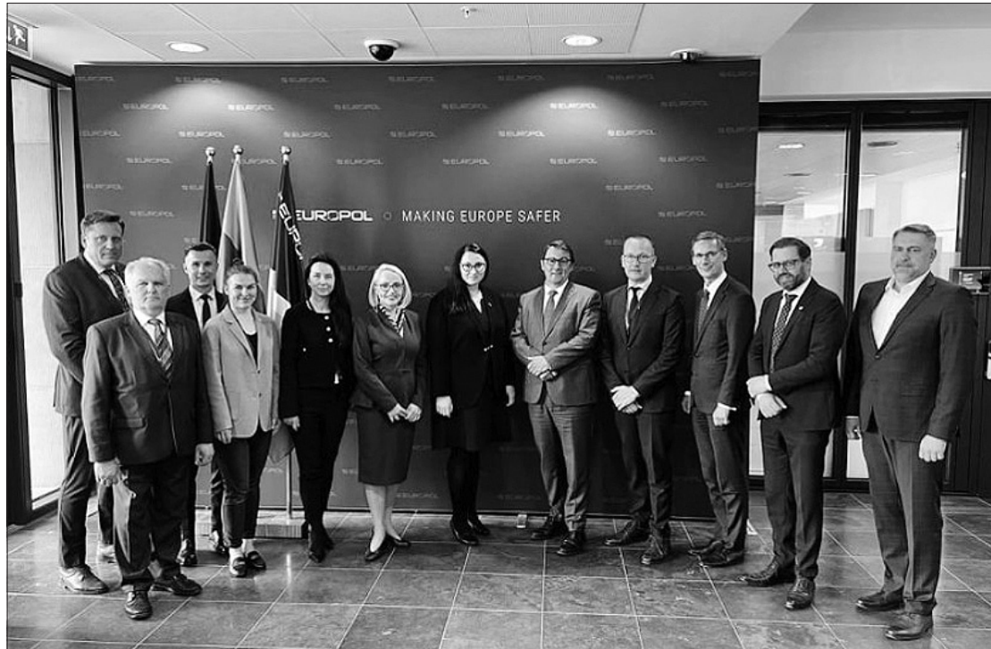
Susitikimas su Europolo atstovais.

„Mūsų visų pastangos išliks istorijos vadovėliuose. Turime išsaugoti tikėjimą teisingumu ateities kartoms. Todėl visais būdais privalome siekti, kad teisingumas triumfuotų. Rusijos ir Baltarusijos vykdomos brutali karinės agresijos prieš nepriklausomą Ukrainą akivaizdoje privalome išnaudoti visus įmanomus algoritmus, kad karo nusikaltėliai kuo greičiau sulauktų baudžiamosios atsakomybės, – sako E. Dobro-