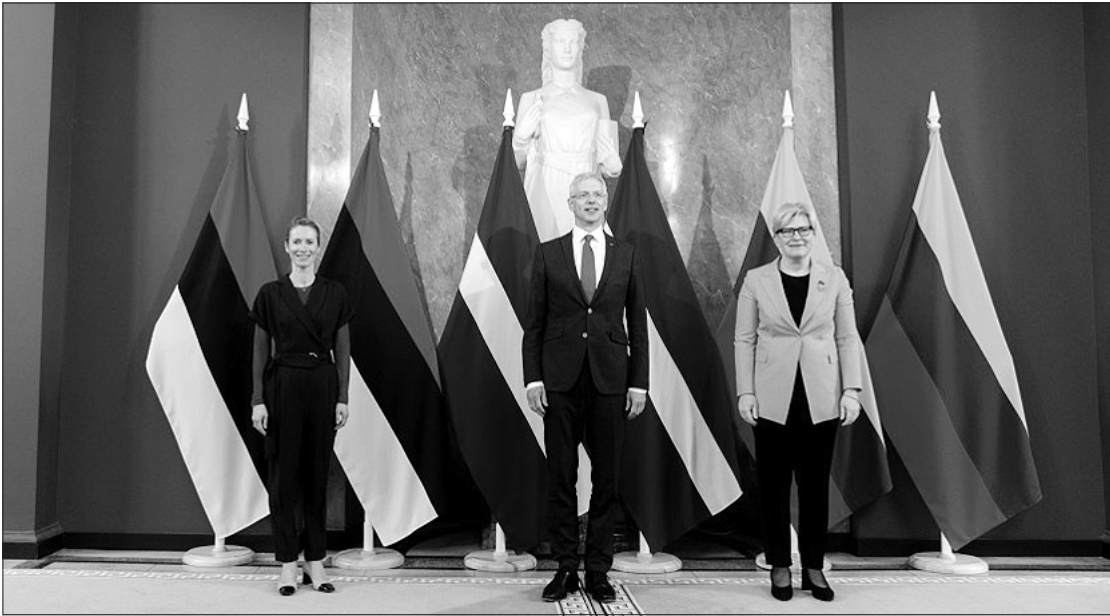
Iš kairės: Estijos Ministrė Pirmininkė Kaja Kallas, Latvijos Ministras Pirmininkas Arturas Krišjanis Karinšas ir Lietuvos Ministrė Pirmininkė Ingrida Šimonytė.