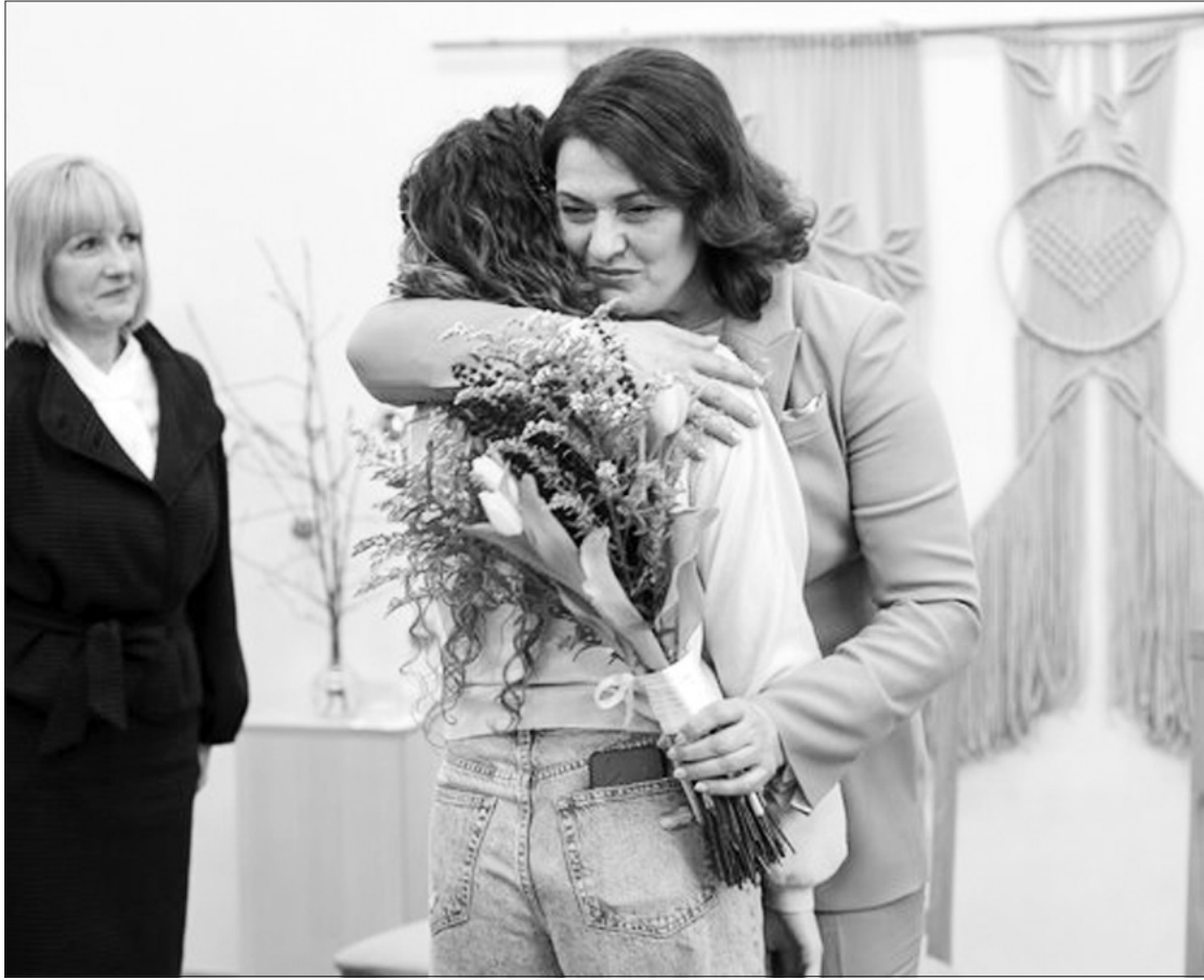
Dianos Nausėdienės vizitas Šiauliuose.

Lietuvos pirmoji ponija Diana Nausėdienė balandžio 13 d., trečiadienį su vizitu lankosi Šiauliuose, kur susitinka su nuo karo nukentėjusiais ukrainiečiais ir šeimomis, šiuo metu globojančiomis be tėvų likusius ukrainiečių vaikus.