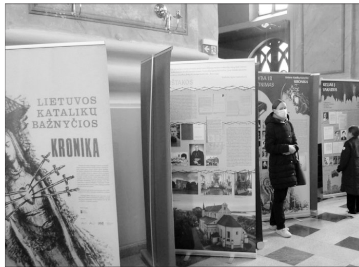
Lietuvos gyventojų genocido ir rezistencijos tyrimo centro Okupacijų ir laisvės kovų muziejaus parengta paroda „Lietuvos Katalikų Bažnyčios Kronika”.

Kauno šv. apaštalo Petro ir Povilo arkikatedroje bazilikoje nuo balandžio 8 dienos eksponuojama Lietuvos gyventojų genocido ir rezistencijos tyrimo centro Okupacijų ir laisvės kovų muziejaus parengta paroda „Lietuvos Katalikų Bažnyčios Kronika”. Parodą kauniečiai ir miesto svečiai galės pamatyti iki šių metų balandžio 25 dienos.