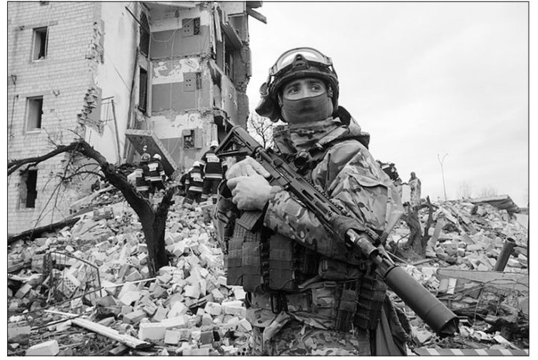
Rusijos karas prieš Ukrainą.

„Dabar išgyvename kritinį laikotarpį, kai jiems reikia paruošti pagrindą kitam šio karo etapui. Jungtinės Valstijos bei mūsų sąjungininkai ir partneriai imasi kuo skubesnių veiksmų, kad toliau aprūpintų Ukrainą ginklais, kurių reikia jų pajėgoms ginant jų tautą“,