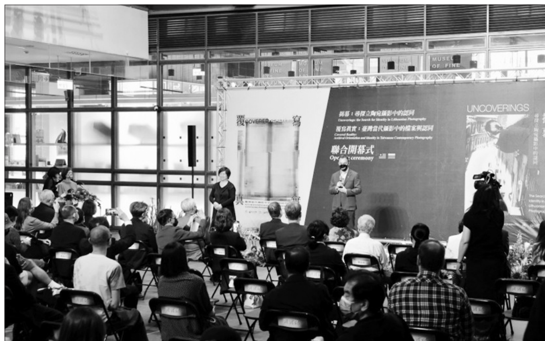
Taivano nacionaliniame dailės muziejuje atidaryta didžiausia originalius Lietuvos fotografų kūrinius pristatanti paroda „Uncoverings. The Search for Identity in Lithuanian Photography“.