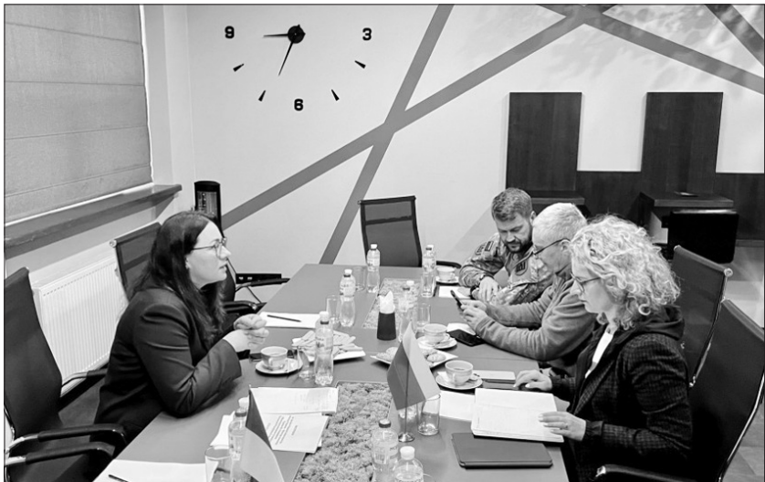
Lietuvos Ekonomikos ir inovacijų ministrė Aušrinė Armonaitė kolegų iš Ukrainos kvietimu balandžio 15 d. lankėsi Kijeve, kur su Ukrainos ministro pirmininko pirmąją pavaduotoja, ekonomikos ministre Julija Svyrydenko ir ministro pirmininko pavaduotoju, skaitmeninės transformacijos ministru Michailu Fiodorovu aptarė būdus kaip išlaikyti dvišalę prekybą.