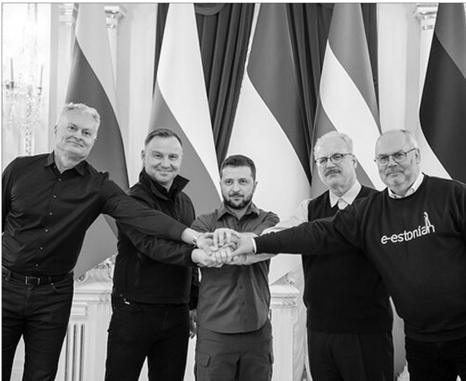
Iš kairės: Lietuvos Respublikos Prezidentas Gitanas Nausėda, Lenkijos Respublikos Prezidentas Andrzej Duda, Ukrainos Prezidentas Vladimiras Zelenskis, Latvijos Prezidentas Egilis Levitas ir Estijos Prezidentas Alar Karis Kyjive, Ukrainoje.

Pasak Prezidento, Lietuvos humanitarinė ir finansinė parama Ukrainai šiuo metu sudaro apie 14 milijonų eurų. Lietuvos vadovas susitikime teigė, kad šiuo metu Lietuva priima virš 43 tūkstančių karo pabėgėlių iš Ukrainos – jiems yra sudarytos palengvintos galimybės įsikurti šalyje, vaikams gauti švietimo sistemos paslaugas. Lietuva