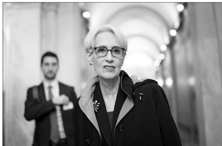
JAV valstybės sekretoriaus pavaduotoja Wendy Sherman.

Biuruselyje vykusio susitikimo metu JAV valstybės sekretoriaus pavaduotoja Wendy Sherman paragino Kiniją išsakyti paramą Ukrainai.