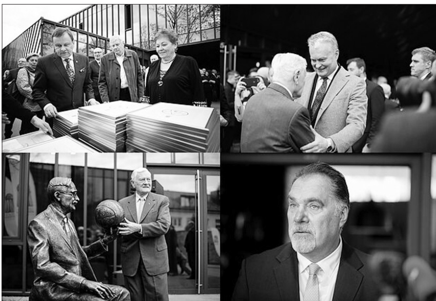
Lietuvos krepšinio šimtmečio šventėje susirinko žymiausi Lietuvos žmonės.

Į šventę atvyko ne tik Lietuvos krepšinio legendos,