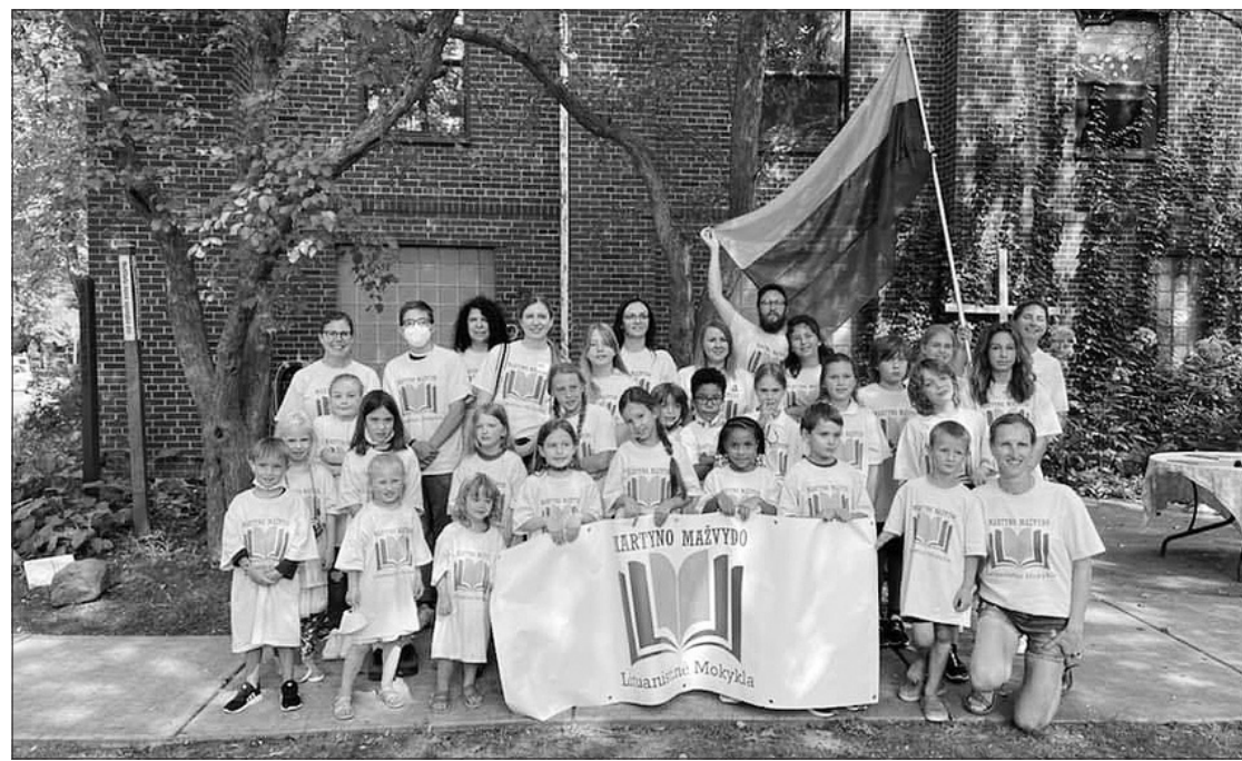
2021-2022 m. Martyno Mažvydo lituanistinė mokykla.