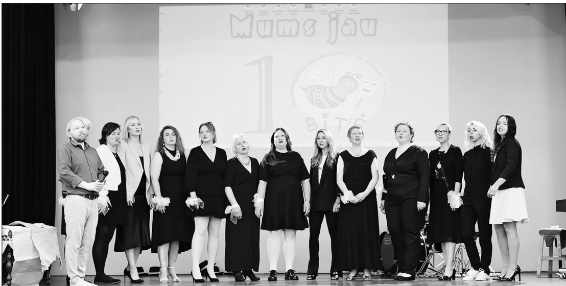
Lituanistinės etnokultūros ir dramos mokykla „Bitė”, įsikūrusi Kroidone, JK.