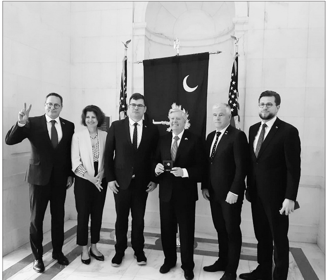
Iš kairės: Užsienio reikalų komiteto narys Žygimantas Pavilionis, kongresmenė Nensi Meis (Nancy Mace), Seimo Nacionalinio gynybos ir saugumo komiteto pirmininkas Laurynas Kasčiūnas, lietuvių kilmės senatorius Ričardas Džozefas Durbinas (Richard Joseph Durbin), Seimo Pirmininko pavaduotojas Jonas Jarutis, Ateities komiteto pirmininko pavaduotojas Lukas Savickas.

Delegacija taip pat susitiko su senatoriumi Užsienio reikalų komiteto pirmininku Bobu Menendezu (Bob Menendez) ir Atstovų Rūmų Užsienio reikalų komiteto pirmininko pavaduotoju Maiklu Makolu (Michael McCaul), Senato Asignavimų ir biudžeto komiteto nariu Lindsėjumi Grehamu (Lindsay Graham), kitą savaitę į Lietuvą atvyksiančiais kongresmenais Baltijos draugų grupės pirmininkais Rubenu Galego (Ruben Gallego) ir Donu Beikonu (Don Bacon), Senato Ginkluotųjų pajėgų komiteto nariais – pulkininke leitenante Džoni Ernst (Joni Ernst) ir Tomu Kotonu (Tom Cotton), kon-