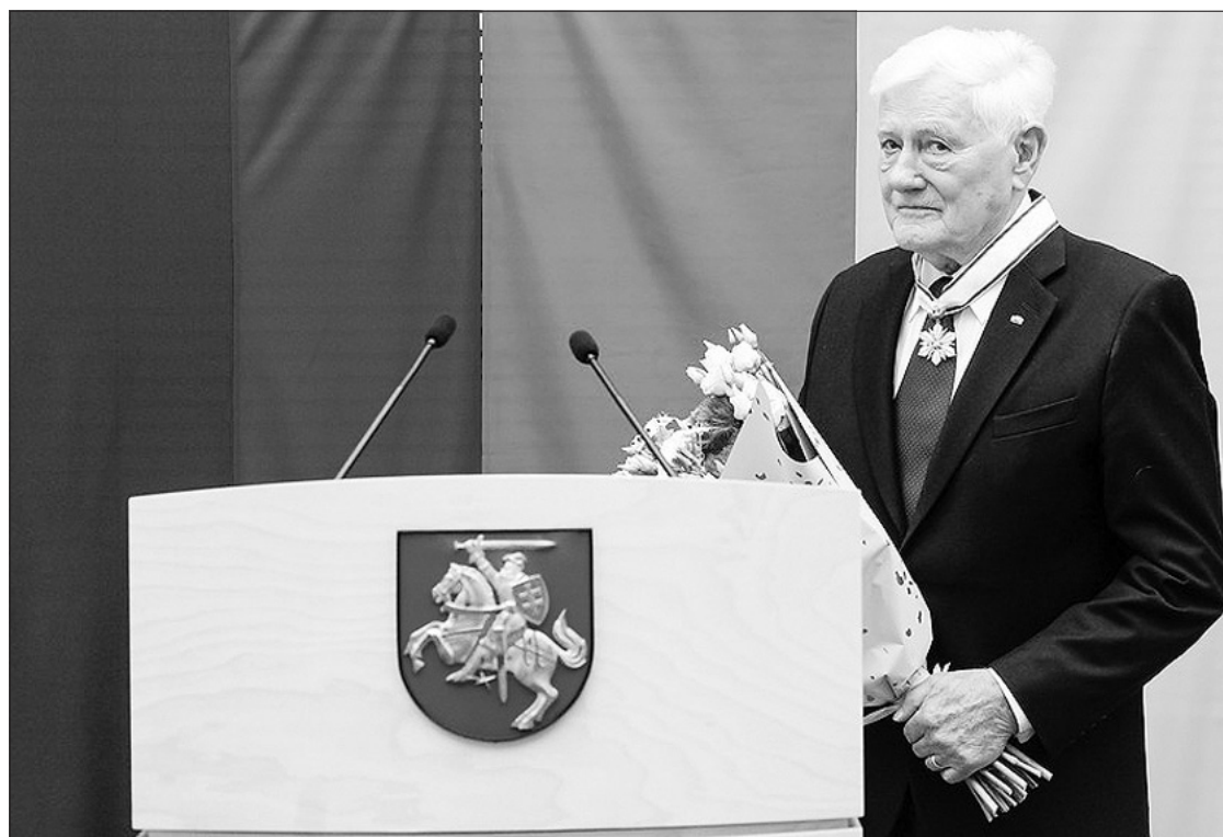
Seimo posėdyje Prezidentui Valdui Adamkui įteiktas Seimo apdovanojimas – Aleksandro Stulginskio žvaigždė.

Šio apdovanojimo laureatas Prezidentas V. Adamkus