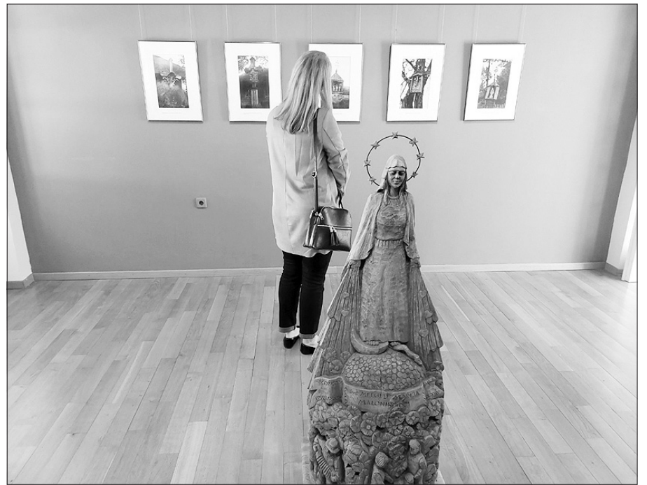
Paroda „Graudulio ir džiaugsmo Lietuva. Kryždirbystės tradicija“ Bjelovaro muziejuje. LR URM