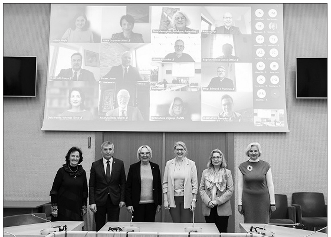
Seimo ir Pasaulio lietuvių bendruomenės komisijos posėdžio dalyviai.

LIETUVIŲ RADIO PROGRAMA girdima antradieniais 9:00-10:00 val. vak. iš WPAT stoties 930 AM banga.