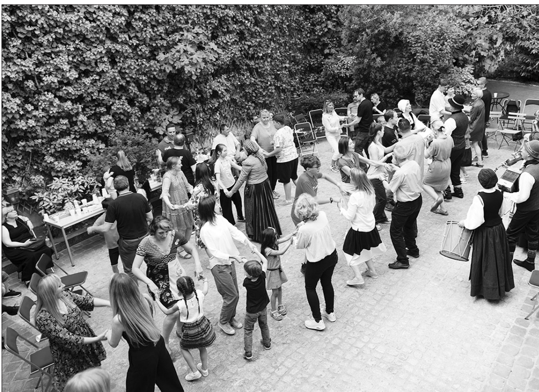
Lietuvos ambasadoje Paryžiuje vyko lietuviška gegužinė „Suk, suk ratelį“.

Bendruomenės vaikai taip pat buvo pakviesti į kūrybines dirbtuves, kurių metu žaidė lietuvių liaudies žaidimus, susipažino su tradiciniais lietuvių liaudies instrumentais, iš siūlų gamino lėles, su šiaudais pūtė burbulus. LR URM