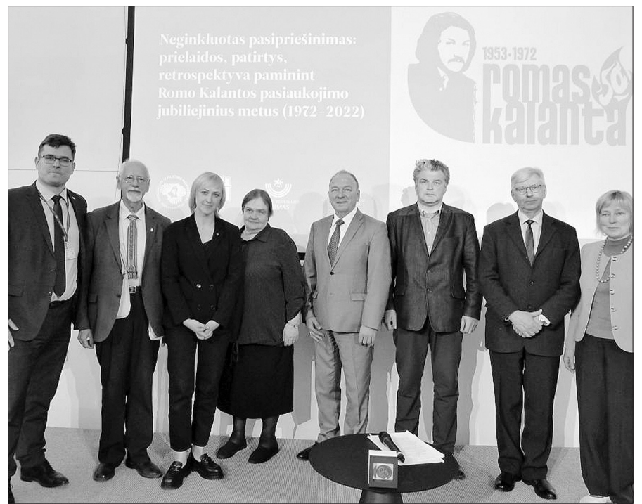
Mokslinės konferencijos, skirtos paminėti Romo Kalantos aukos prasmę, dalyviai.

Konferencijos pranešėjams buvo įteikti Romo Kalantos susideginimo 50-mečiui atminti išleisti jubiliejiniai medaliai. LGGRTC