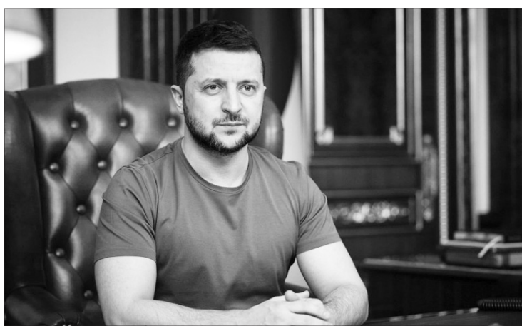
Ukrainos prezidentas Volodymyras Zelenskis.

Ukrainos prezidentas Volodymyras Zelenskis gegužės 21 d. pareiškė, kad jo vadovaujama šalis turi tapti visateise kandidata į Europos Sąjungą (ES), o ne prisijungti prie platesnės „Europos politinės bendruomenės“, kurią siūlo Prancūzija.