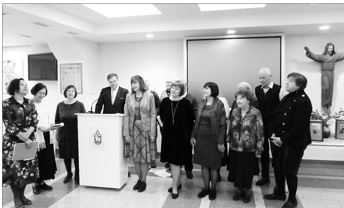
Koncertuoja folkloro ansamblis „Liktužė”.

čiais, pilėnų ištvėrmę ir ryžtą ginant savo žemę. Papasakojau apie Pamario krašto žmonių santykius su gamta, su ženklais, lėmusiais to meto žmonių būti ir buitį, papasakojau apie „aštuonis vėjus”,