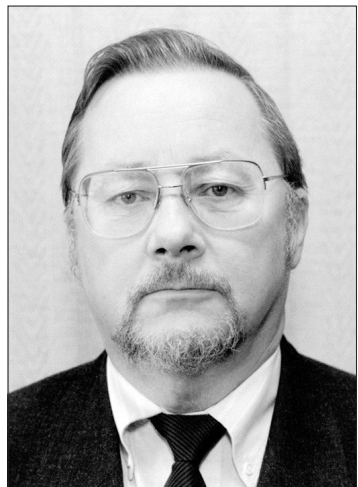
Vytautas Landsbergis, Aukščiausiosios Tarybos Pirmininkas (1990 03 11–1992 11 22).

Seimas po svarstymo pritarė įstatymo projektui, kuriuo