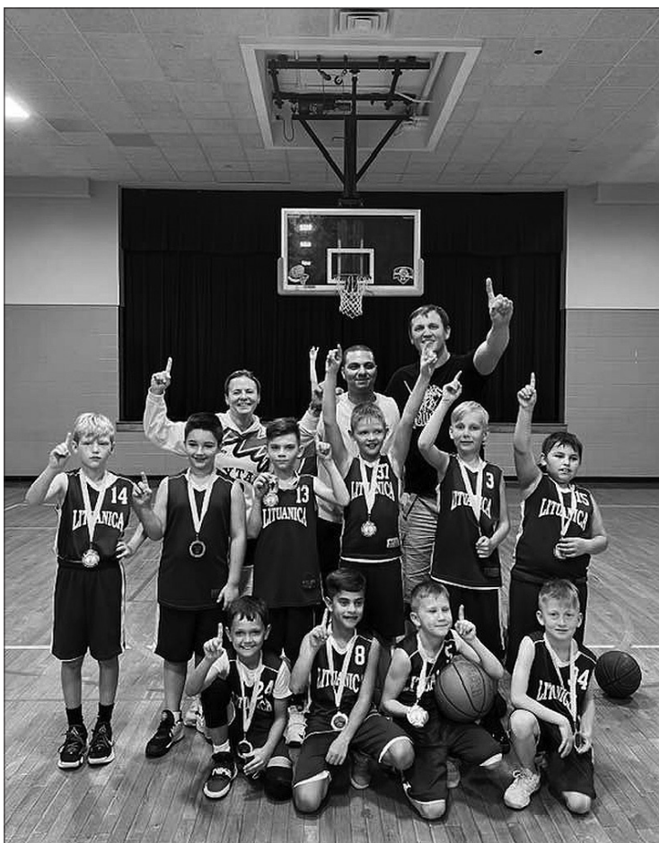
ŠALFASS žaidynių nugalėtojai - Čikagos „Litanicos“ jaunieji krepšininkai.

Šeštadienio vakare Pasaulio lietuvių centre Lemonte įvyko iškilminga ŠALFASS 70-čio vakaronė, specialiai šiam savaitgaliui atvykęs Lietuvos