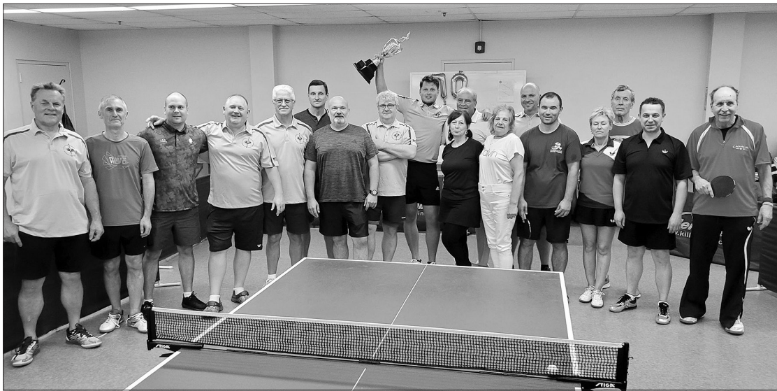
Stalo teniso varžybų dalyviai liko patenkinti sklandžia varžybų eiga ir puikiomis turnyro emocijomis.

tradicinis ŠALFASS sporto renginys. Popandeminis laikotarpis ŠALFASS vadovybei pasėjo nemažai abejonių, ar sportininkai panorės varžytis žaidynėse, ar susirinks komandos, ir ar verta jas organizuoti. Kai kurie ŠALFASS valdybos nariai netgi tyliai siūlė nutraukti organizaci-