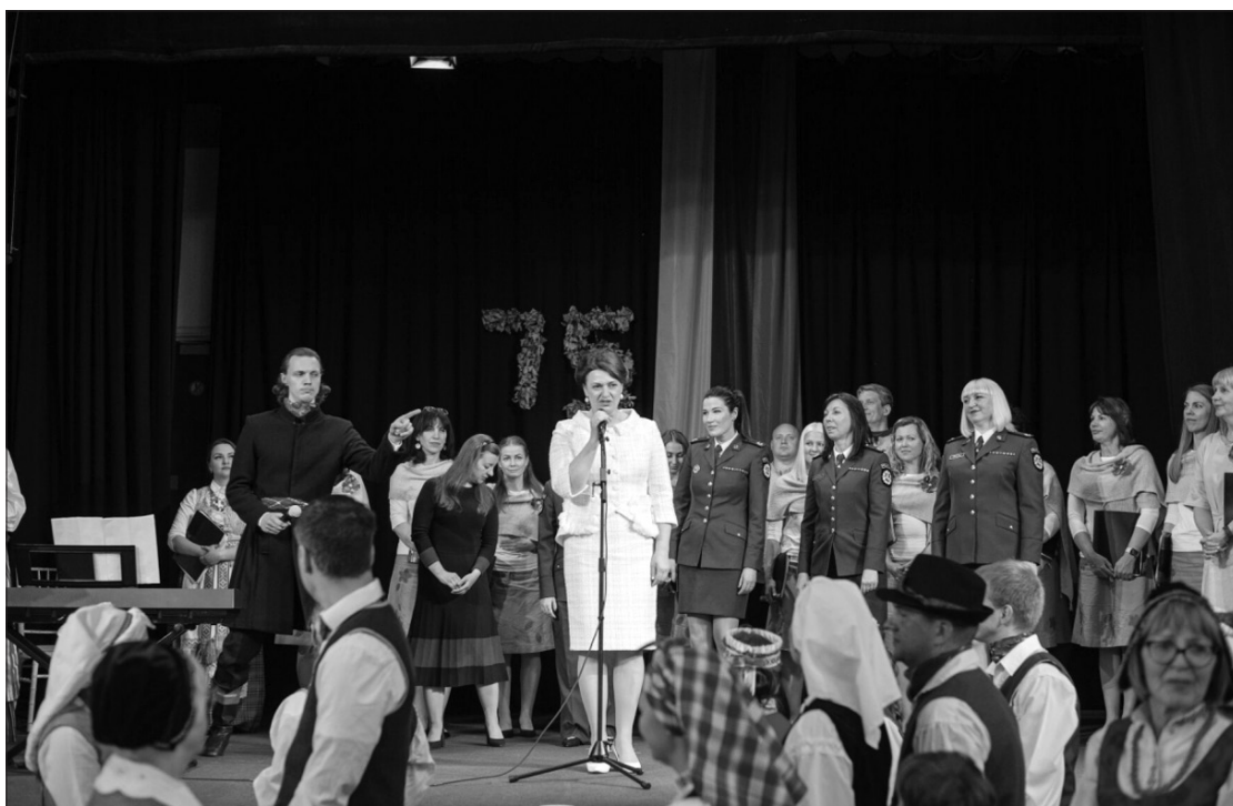
Jungtinės Karalystės lietuvių bendruomenę (JKLB) sveikino ir Lietuvos pirmoji ponija Diana Nausėdienė.