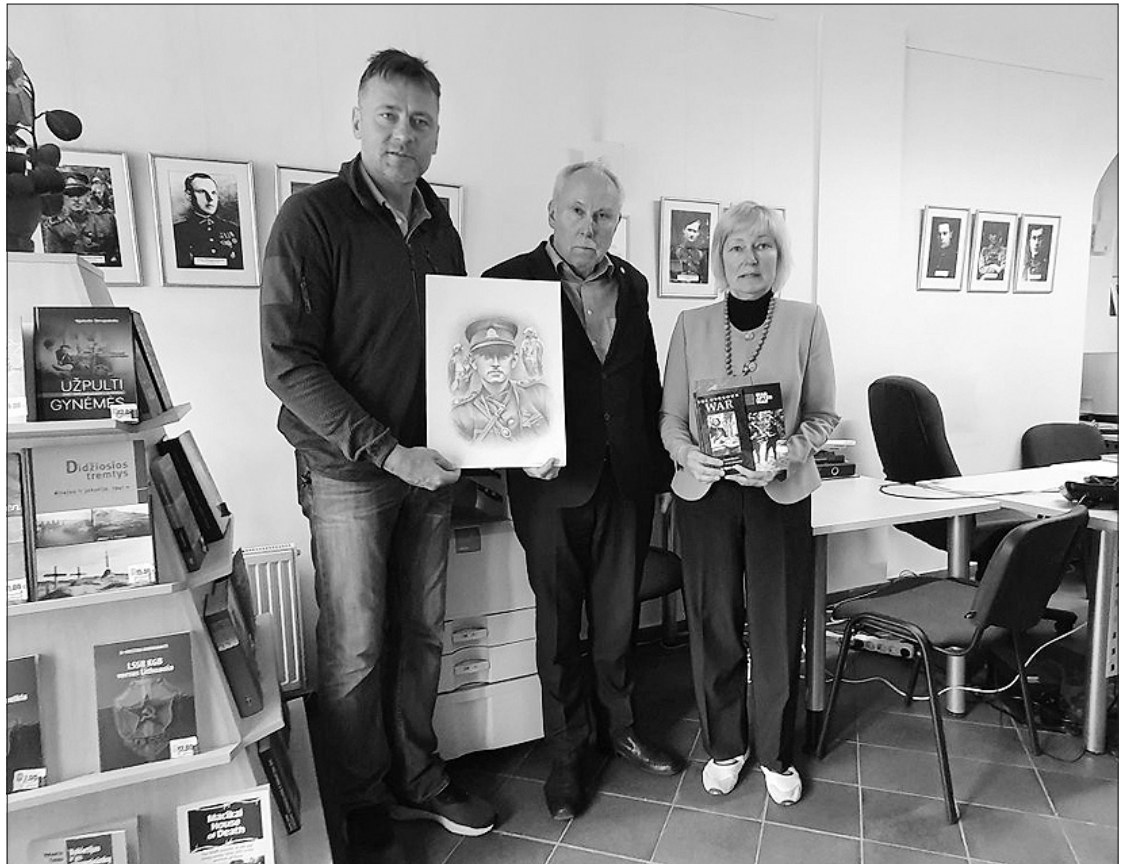
Varėnos rajono Merkinės krašto muziejuje.

„Nekantryju paspausti jam ranką ir perduoti paramą iš Lietuvos. Esu jam labai dėkingas už partizanų vado portretą“, – sakė viešųjų ry-