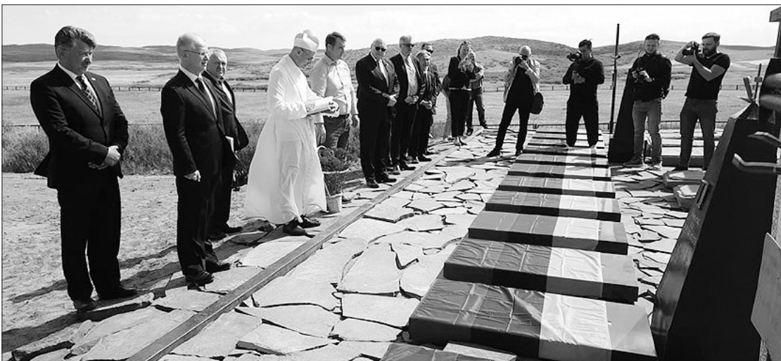
Spaske atidengtas paminklas kovotojams už Lietuvos laisvę.

2022 m. gegužės 31 die- ną Spasko memorialinia- me komplekse Karagandoje, Kazachstane, atidengtas paminklas šiame regione kentėjusiems ir žuvusiems politiniams kaliniams lietu-