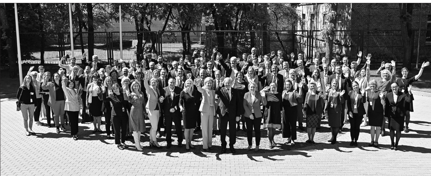
Vilniuje susirinko Lietuvos ekonominiai atstovai užsienyje.