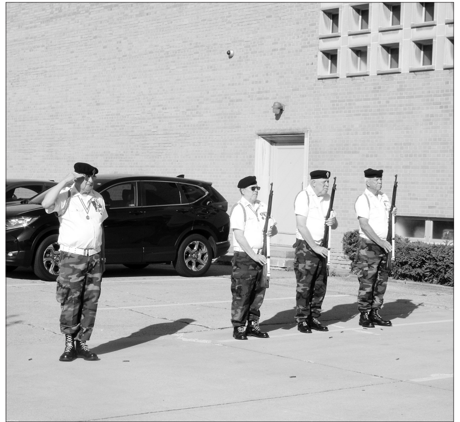
Pagal amžių ir Posto 613 narystę pareigingi nariai atlieka savo pareigą.