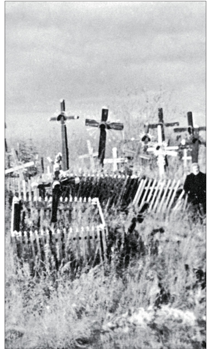
Lietuvių tremtinių kapinės Krasnojarsko srityje.