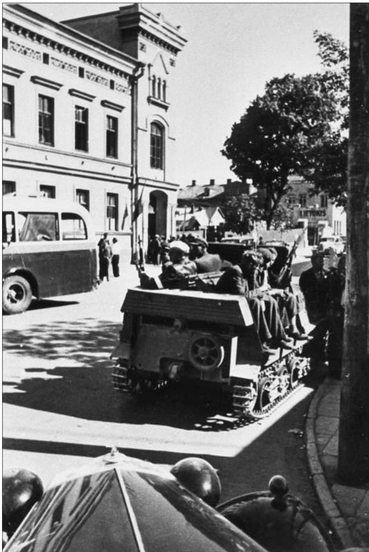
Sukilėliai tanketėje (Kaunas, 1941 06 25).

Visuotinė lietuvių enciklopedija, www.vle.lt