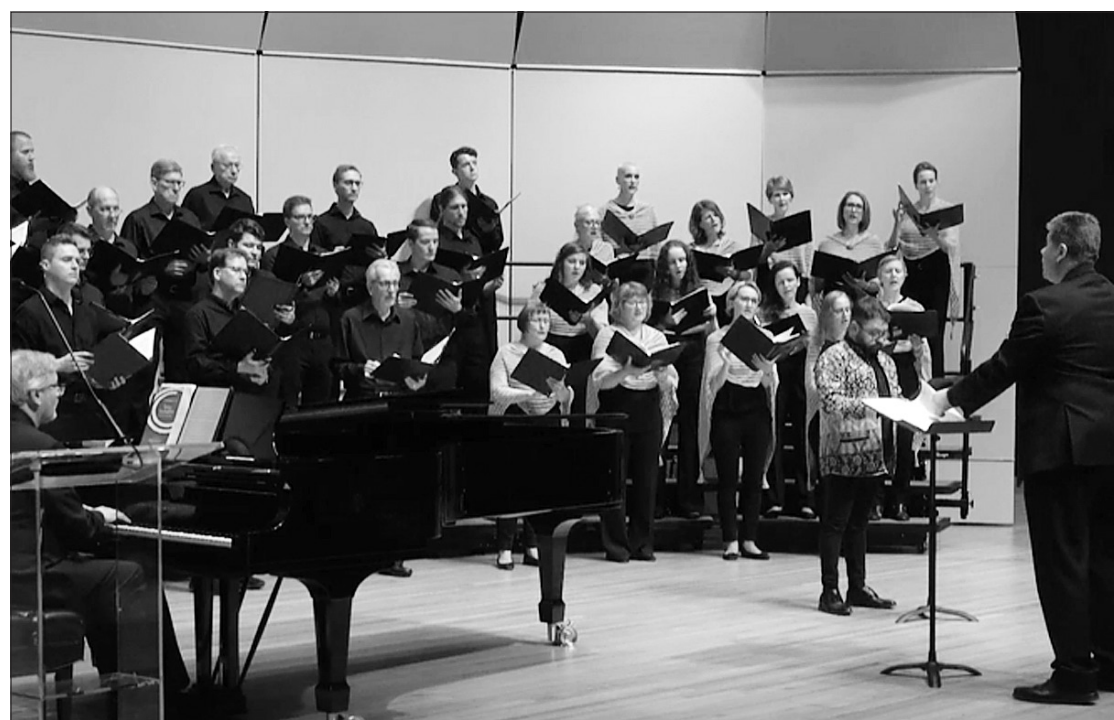
Koncertas „Žydiškos Lietuvos spalvos”

„Pirmas kūrinio epizodas nukelia mus į Lietuvos valstybės užuomazgas, net klestėjimą – tai viduramžiai, Gedimino laiškai, kuriais [kunigaikštis - LRT] kviečia visus žmones į Lietuvą, tai yra turbūt vienas didžiausių įrodymų, koks svetingas ir mielas mūsų kraštas. Tai vienas iš kvietimų, dėl ku-