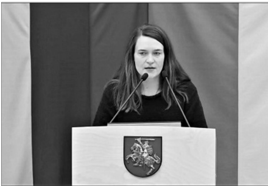
Seimo Europos reikalų komiteto pirmininkė Radvilė Morkūnaitė-Mikulėnienė.