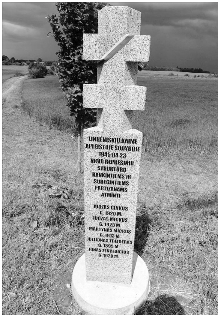
Atminimo ženklas Lingėniškių kaime, kur enkavedistai su vietiniais sribais gyvus sudegino Lietuvos partizanus ir jų rėmėjus. LGGRTC