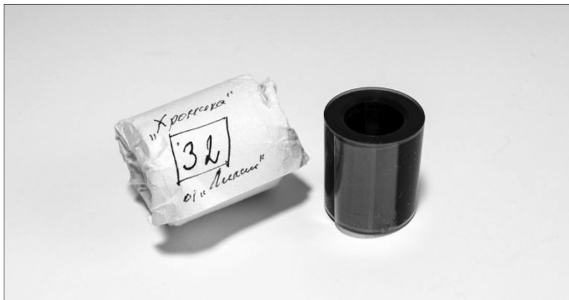
KGB pareigūnų pagaminta negatyvų juosta konfiskuoto pagrindinio leidinio „Lietuvos Katalikų Bažnyčios Kronika”, Nr. 32 (1978).

Šį muziejų valdo Komunizmo aukų memorialo fondas – pelno nesiekianti švietimo, tyrimų ir žmogaus teisių organizacija Jungtinėse Amerikos Valstijose. genocid.lt