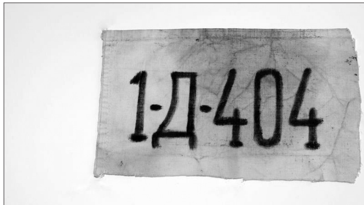
Sovietiniame ypatingojo režimo lageryje kalėjusio lietuvių, politinio kalinio numeris „1-D-404”. Rusija, XX a. 6 deš. Iš Okupacijų ir laisvės kovų muziejaus rinkinių.