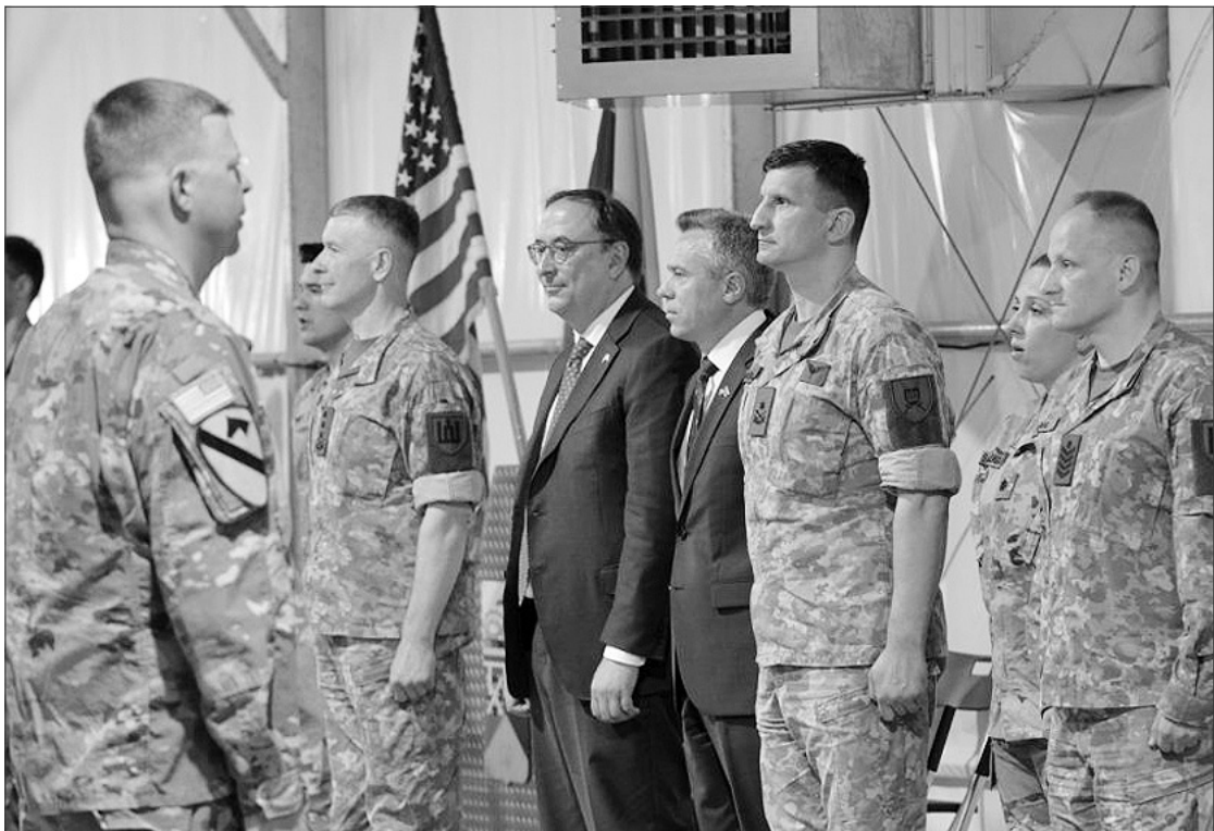
JAV kariai Lietuvoje.