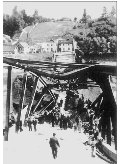
Per Birželio sukilimą susprogdintas Vytauto Didžiojo (Aleksoto) tiltas per Nemuną Kaune (1941 06 23)