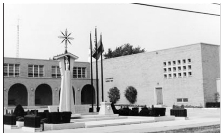
Švento Kazimiero parapija Klivlande, OH.

Š. m. liepos 27 d., 5:00 - 9:00 po p., Šv. Kazimiero lietuvių parapijoje veikianti Šv. Vardo draugija vėl surengė gegužinę. Visas gegužinės išlaidas padengė pati draugi- ja, įskaitant ir įėjimo mokestį. Rengėjai nerimavo dėl ne- pastovaus oro. Nors anksčiau lynojo, jų sprendimas žengti pirmyn buvo teisingas: oras prasiblaivė, grizo saulė, lie- tus išgaravo kažkur virš Erie ežero, pradėjo pūsti švelnus vėjelis.