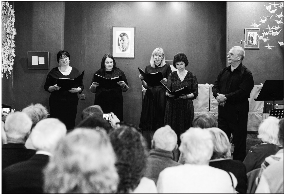
Renginys buvo pabaigtas poeto daina „Peizažas“, kuri minėjimuose skamba nuo 1988 metų.