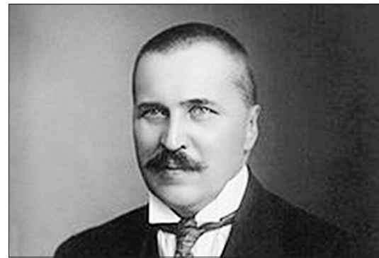
Jonas Vileišis.

Lietuvių veikėjų susitikimuose su JAV atstovais 1918-1919 metais ryškėjo toks vaizdas: Lietuva tebelaikoma Rusijos valstybės dalimi. Mat JAV prezidentas demokratas V. Vilsonas ir valstybės sekretorius R. Lansingas laikėsi vadinamojo „nedalomos Rusijos“ principo kaip oficialios linijos valstybės užsienio politikoje (tiesa, išimtis buvo padaryta Lenkijai ir Suomijai). Taikos konferencijoje Paryžiuje amerikiečiai rėmė antibolševikinių jėgų vadovybes, ypač admirolo A. Kolčako atstovus. Tai iliustruoja 1919 m. gegužės 26 d. didžiųjų Antantės valstybių vadovų ir JAV prezidento pasirašytas laiškas A. Kolčakui. Laiške jis faktiškai pripažįstamas būsimo demokratinės Rusijos vadovu su sąlyga, kad pakraščiams, t.y. ne rusų tautoms, tame tarpe ir lietuviams, būtų suteikta plati autonomija. Todėl oficialiuose JAV sluoksniuose į Lietuvos atstovus buvo žiūrima