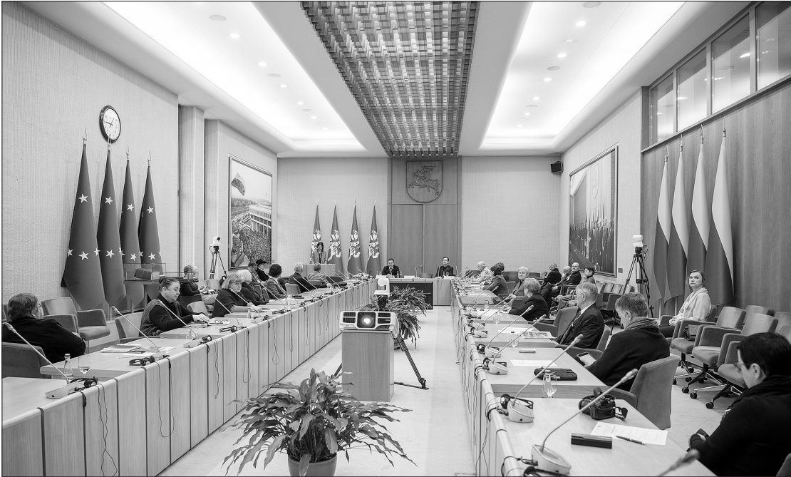
V. Gedgaudo metams skirtos konferencijos akimirkos.