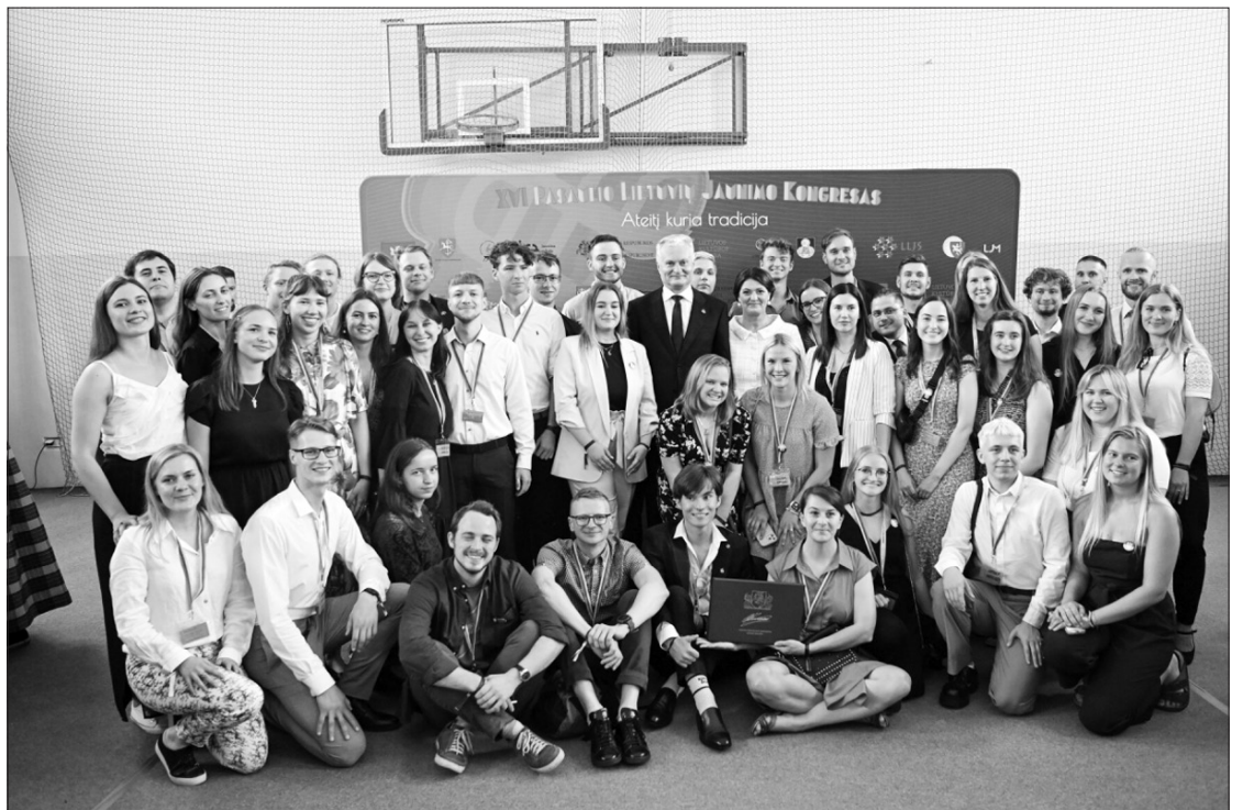
Lietuvos Respublikos Prezidentas Gitanas Nausėda su pirmąja ponia Diana Nausėdiene XVI Pasaulio lietuvių jaunimo kongreso kultūrinės dalies „Ateitį kuria tradicija“ atidaryme.

Paskutinis vizito akcentas buvo XVI Pasaulio lietuvių jaunimo kongreso kultūrinės dalies „Ateitį kuria tradicija“ atidarymas. Šiais metais kongresą organizavo Lenki- jos lietuvių jaunimo sąjunga. Prezidentas, sveikindamas kongreso dalyvius, akcentavo lietuvių tapatybės užsienyje išsaugojimo svarbą. Šalies vadovas sveikinimo kalboje pabrėžė, kad Lietuvai šian- dienos globaliame pasaulyje būtina išsaugoti, stiprinti ir iš kartos į kartą perduoti tautinį