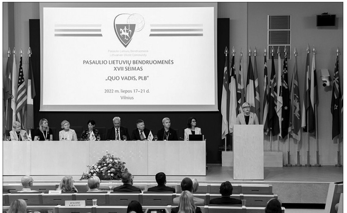
Posėdžiauja Pasaulio lietuvių bendruomenės 17-asis Seimas.