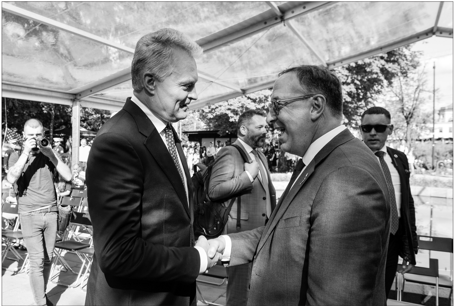
Lietuvos Respublikos Prezidentas Gitanas Nausėda Lietuvos ir JAV santykių 100-mečio ir Sumnerio Welleso deklaracijos paminėjime sveikina JAV ambasadorių Lietuvoje Robert S. Gilchrist.

„Tam, kad būtų sustabdytas militarizmo, revanšizmo ir agresijos plitimas tarptautinės bendruomenės kūne, Ukraina turi šį karą laimėti. O mes – jai padėti“, – sakė