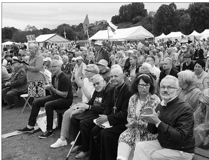
Ariogaloje vyko Lietuvos tremtinių, politinių kalinių ir Laisvės kovų dalyvių sąskrydis „Su Lietuva širdy“.