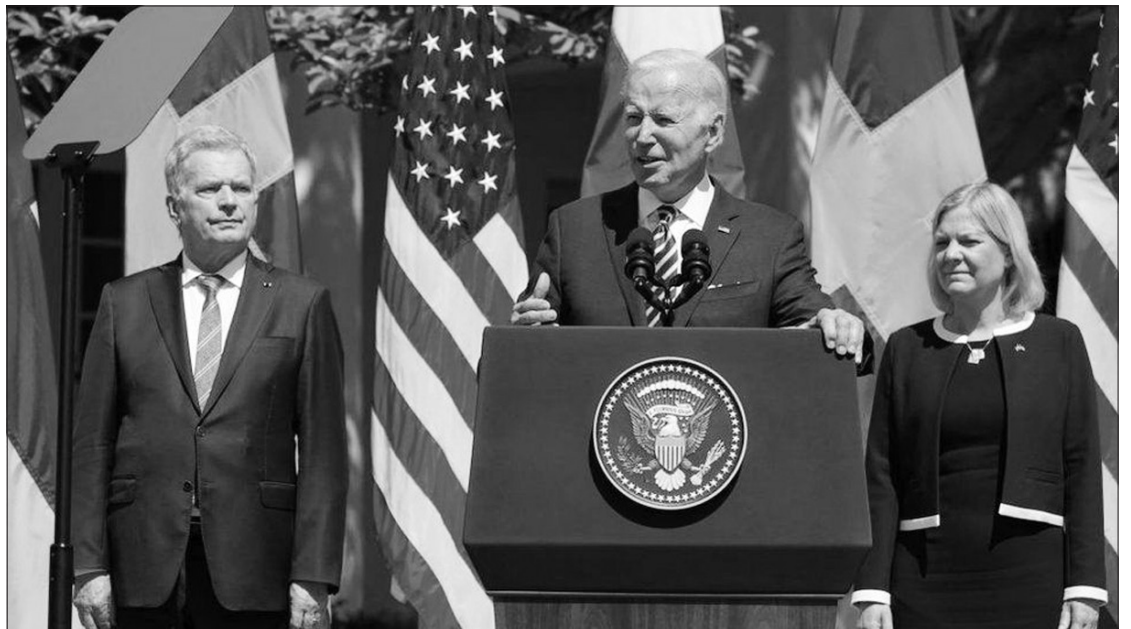
Iš kairės: Suomijos prezidentas Sauli Niinistö, JAV prezidentas Joe Biden ir Švedijos ministrė pirmininkė Magdalena Andersson Vašingtone.

JAV Senatas rugpjūčio 3 d. ratifikavo Švedijos ir Suomijos priėmimo į NATO dokumentus, tvirtai paremdamas transatlantinio aljanso plėtrą Rusijos invazijos į Ukrainą akivaizdoje.