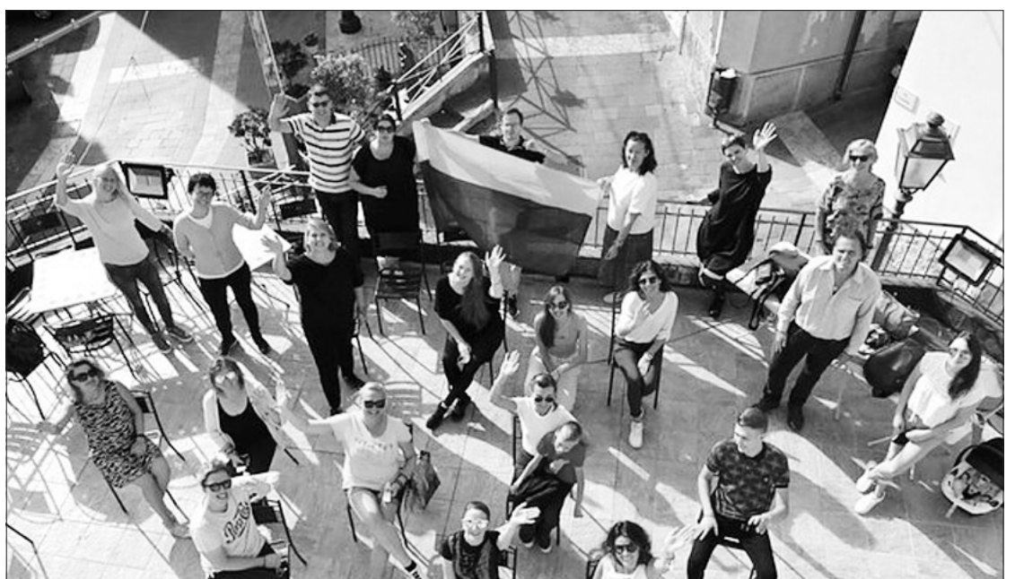
Italijos lietuvių suvažiavimas Sicilijoje.

Atvažiavus į ją bus gali- ma pasigrožėti bent keliais koplytstulpiais, prie jų besi- stiebiančiais ažuoliukais, pa-