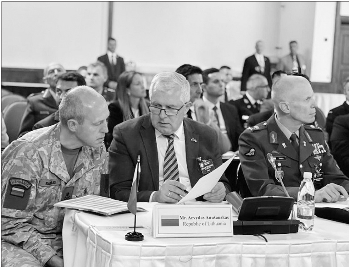
Lietuvos Respublikos krašto apsaugos ministras A. Anušauskas Ramšteine, Vokietijoje.

„Nuo balandžio mes pradėjome ukrainiečių mokymus Lietuvoje. Per šešis mėnesius įvairiuose kursuose parengėme apie 150 Ukrainos karių. Spalį planuojame artilerinės ginkluotės specialistų mokymus. Galiausiai, paremsime JK va-