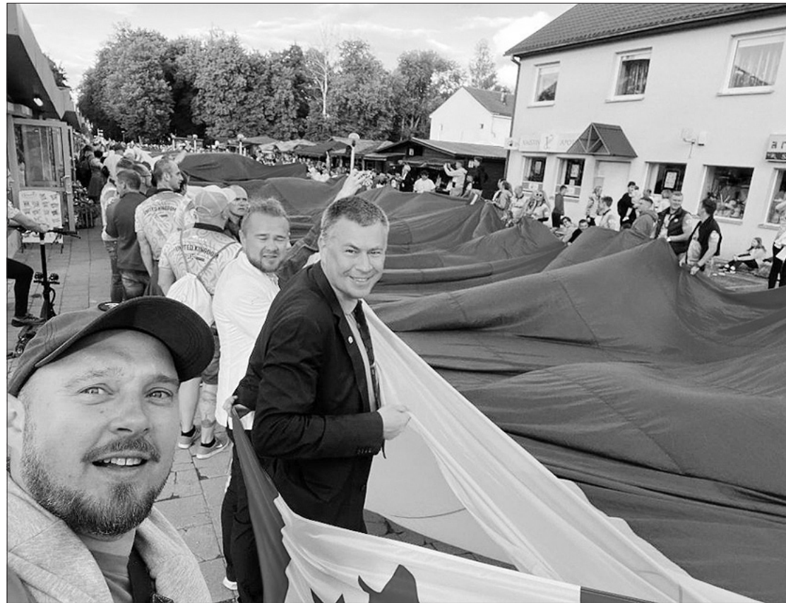
Pagrindiniu šventės akcentu taip pat tapo mūsų trispalvė – rekordinio – 250 metrų ilgio – Lietuvos vėliava, kurią Druskininkų gatvėmis nešė visi žaidynių dalyviai.

„Vienas užsienio leidinys pavadino Druskininkus pa-