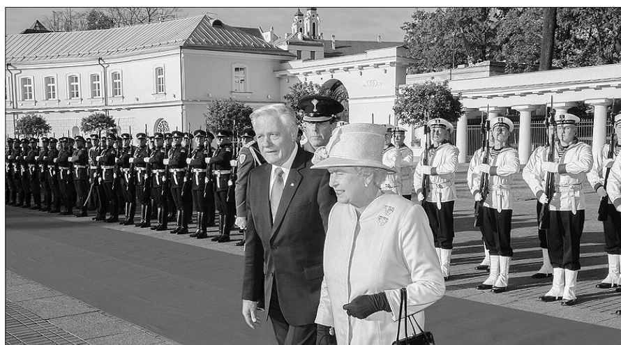
2006 m. spalio 16 d., Vilnius. Karalienės Elžbietos II vizitas Lietuvoje.