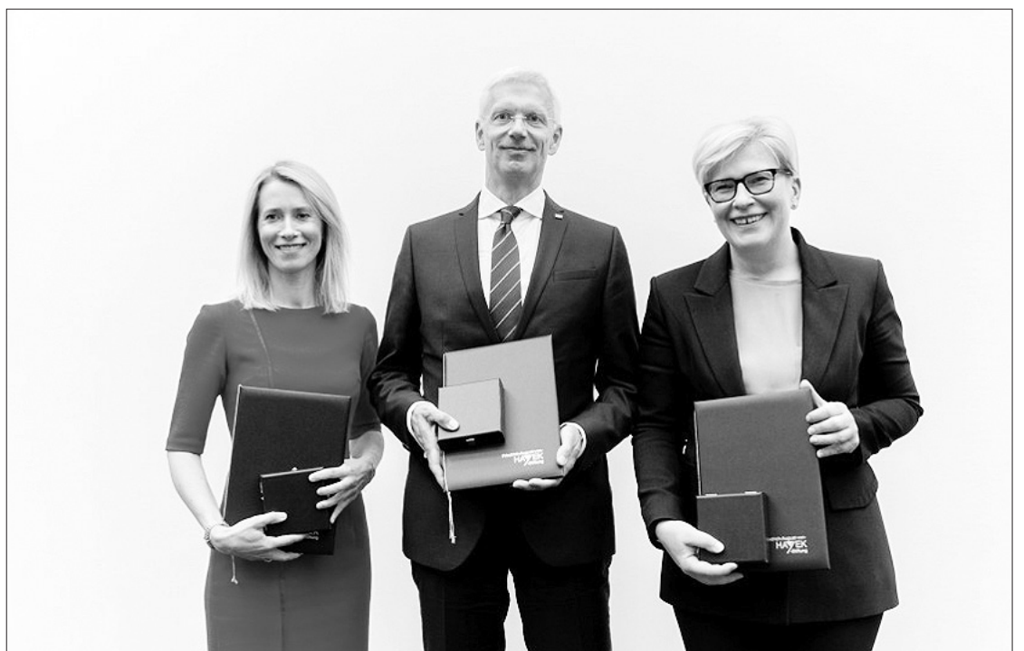
Baltijos šalių premjerai (iš kairės): Estijos Ministrė Pirmininkė Kajai Kallas, Latvijos Ministras Pirmininkas Krišjanis Karinis ir Lietuvos Ministrė Pirmininkė Ingrida Šimonytė.

finansinių institucijų, valiutos, infliacija siekė iki 1000 proc., beveik jokių gamtinių išteklių. Maža to – Sovietų Sąjunga paskelbė ekonominę blokadą, kuria siekė užgniaužti mūsų nepriklausomybę. Pamoka, kurią išmokome tada ir kuri tebėra aktuali šiandien, – kad ir kokie dideli būtų ekonominiai sunkumai, niekas neužgniauš laisvų žmonių valios. Sėkmingai įveikėme neeilinius ekonominius iššūkius, nes savo valstybę ir ekonomiką statėme ant asmeninės ir ekonominės laisvės pamatų. Ir visada įta-