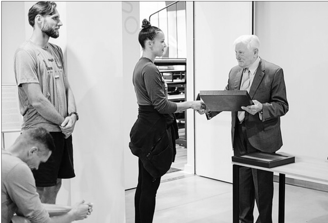
Lietuvos 3x3 rinkinių išlydėjimas.