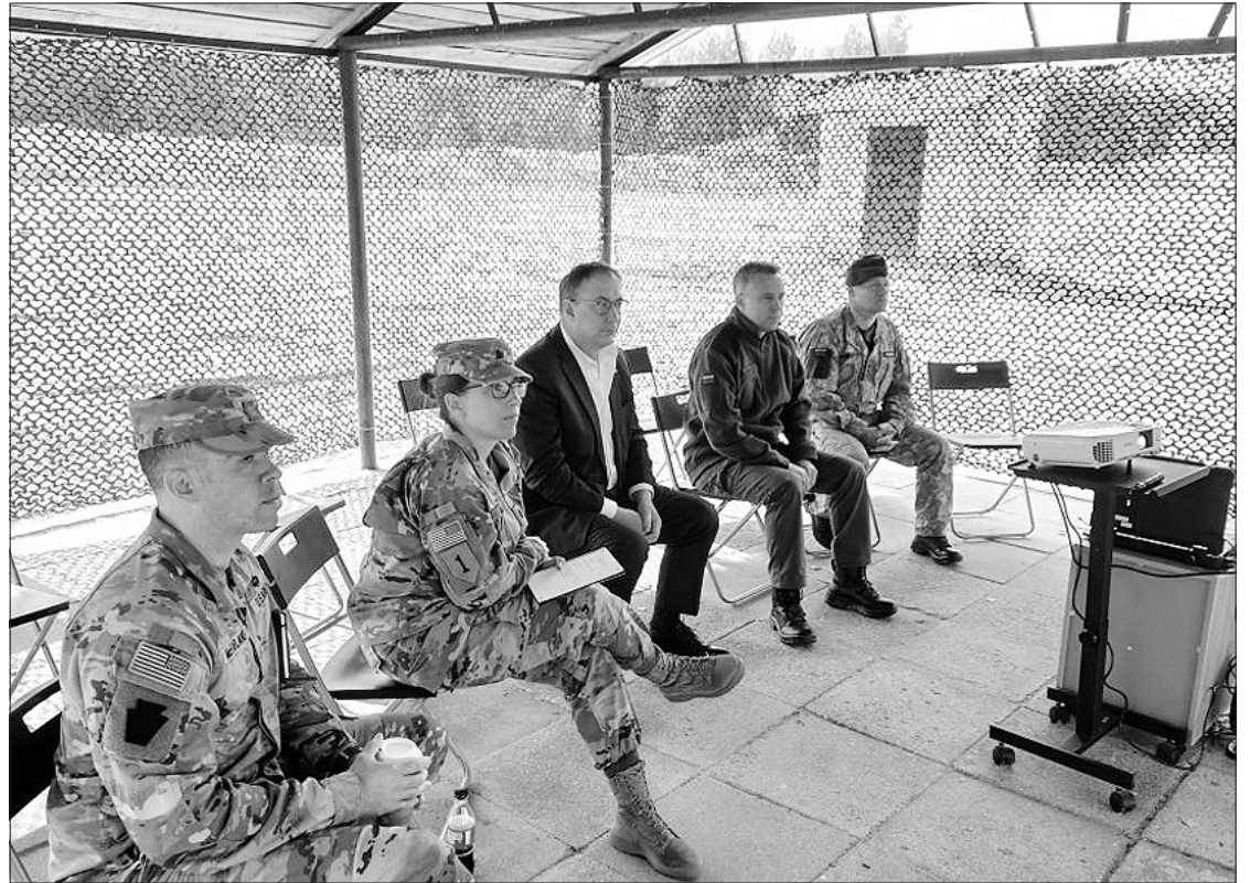
JAV ambasadoriui pristatyti Rūdninkų poligono atstatymo darbai: nauja infrastruktūra didins sąjungininkų galimybes.