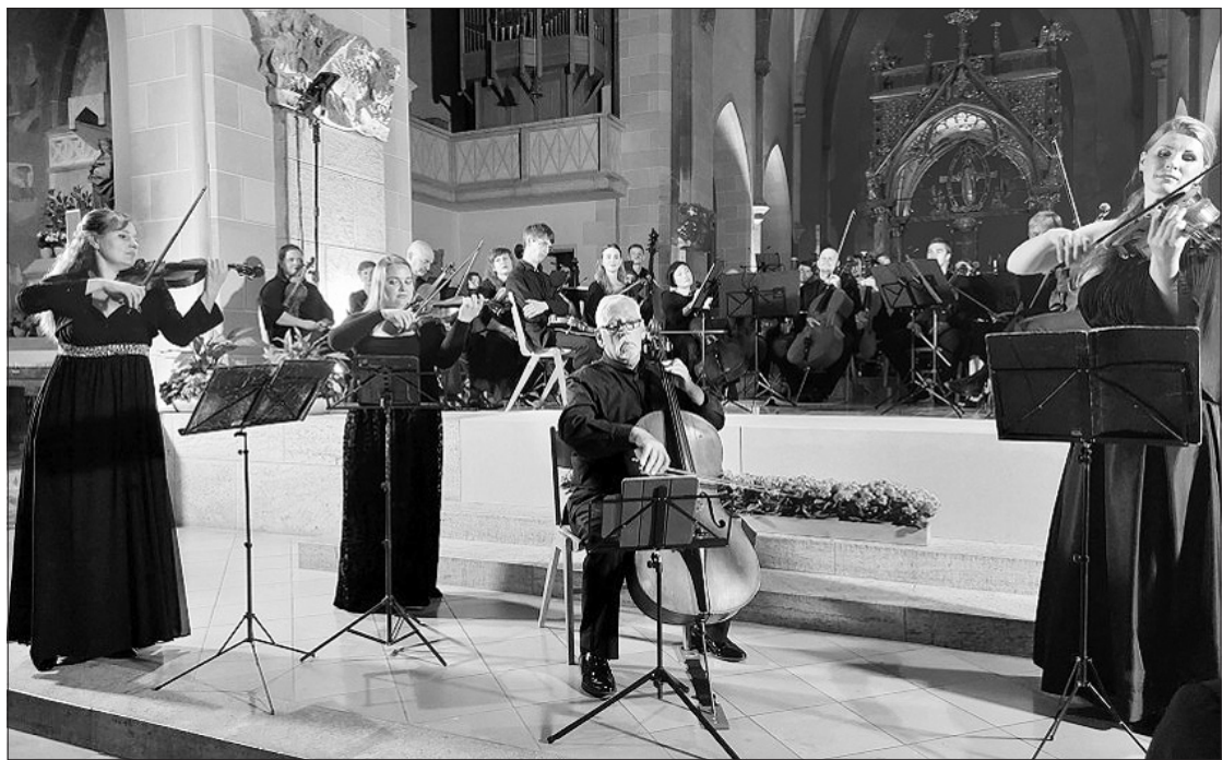
Kauno styginių kvartetas Vokietijoje, Išlaisvinimo koncerte „Ammerseerenade“ festivalyje

Išlaisvinimo koncertą papildė kiti kelias dienas trukę koncertai aplinkinių vietų išskirtinė