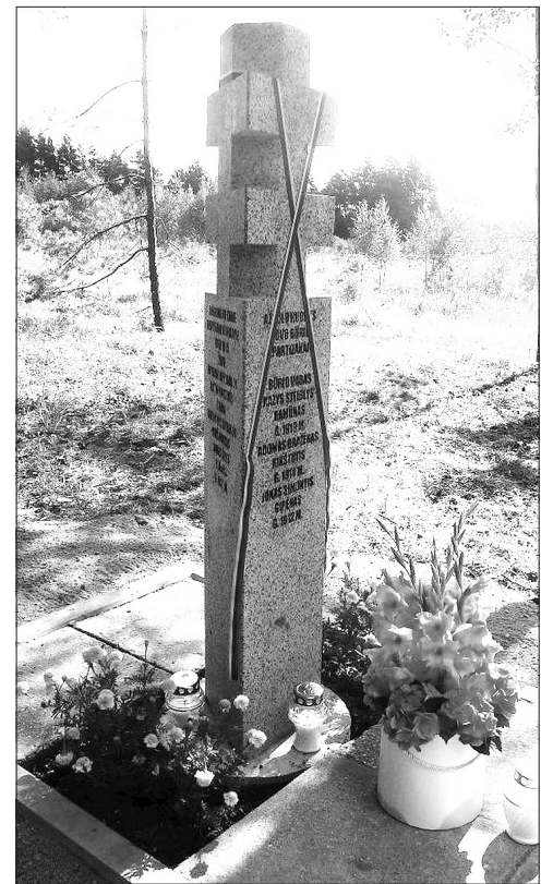
LGGRTC atminimo ženklas.

Renginyje dalyvavo Lietuvos šaulių sąjungos, Lietuvos kariuomenės kūrėjų savanorių sąjungos Nepriklau-