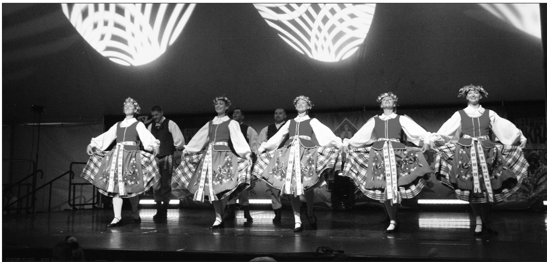
Scenoje – lietuvių tautinių šokių grupė „Suktinis”.