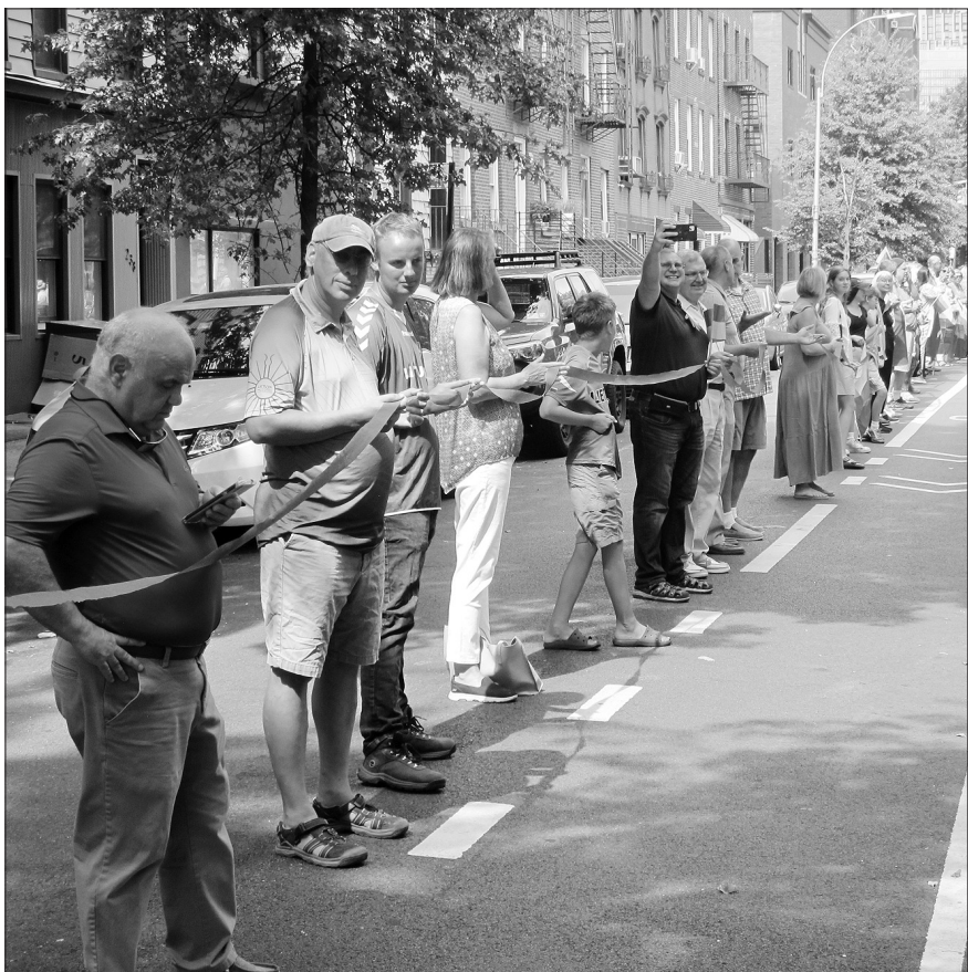
Žmonių grandinė tarp Švč. Mergelės Marijos Apreiškimo ir ukrainiečių Šventosios Dvasios bažnyčių.

Rugpjūčio 28 d., sekmadienį, Niujorke, Brooklyn'e nusidriekė gyva žmonių grandinė, kurioje rankomis susijungė ne tik lietuviai bei ukrainiečiai, bet ir praeiviai niujorkiečiai, visi, kurie tik norėjo prisijungti prie šios gražios Ukrainos palaikymo akcijos. Niujorke, Williamsburge, vienam iš žymaus Brooklyn'o rajonų jau daugiau kaip 100 metų veikia nepaprastai graži lietuviška Švenčiausios Mergelės Marijos Apreiškimo bažnyčia, kurioje sekmadieniais vyksta šventos Mišios lietuvių kalba. Taip jau nutiko, kad kaimynystėje veikia taip pat labai sena ukrainiečių Šventosios Dvasios bažnyčia, o jas skiria tik trys dideli Niujorko miesto kvartalai. Kodėl gi mums kartu nepaminėjus Ukrainos Nepriklausomybės dienos, o kartu ir 33 metų Baltijos kelio sukaktį, įprasminant ir pakartojant Baltijos kelią Niujorke?