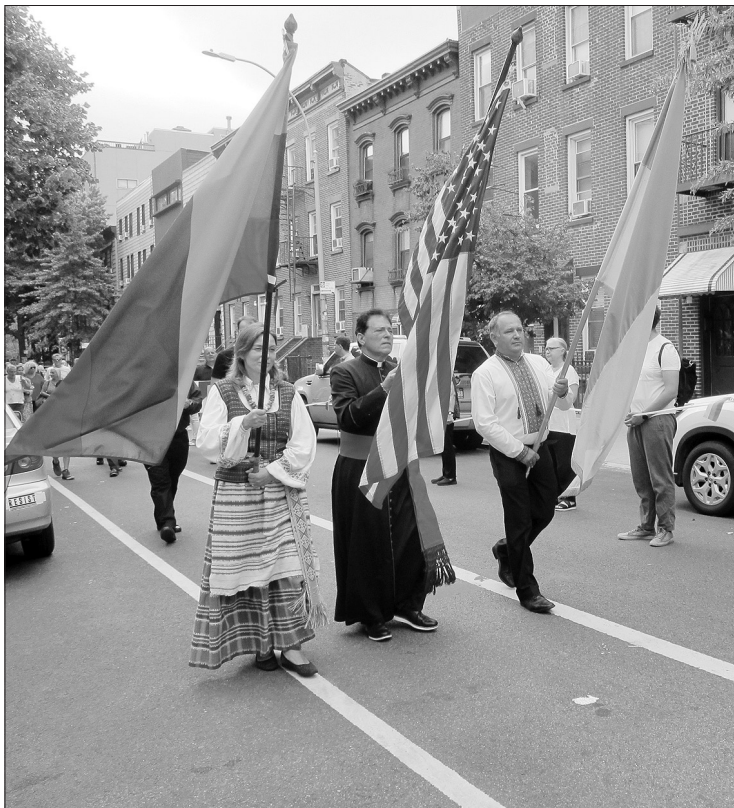
Eisena nuo Švč. Mergelės Marijos Apreiškimo bažnyčios iki ukrainiečių Šventosios Dvasios bažnyčios.

Rugpjūčio 28 d., sekmadienį, Niujorke, Brooklyn'e nusidriekė gyva žmonių grandinė, kurioje rankomis susijungė ne tik lietuviai bei ukrainiečiai, bet ir praeiviai niujorkiečiai, visi, kurie tik norėjo prisijungti prie šios gražios Ukrainos palaikymo akcijos. Niujorke, Williamsburge, vienam iš žymaus Brooklyn'o rajonų jau daugiau kaip 100 metų veikia nepaprastai graži lietuviška Švenčiausios Mergelės Marijos Apreiškimo bažnyčia, kurioje sekmadieniais vyksta šventos Mišios lietuvių kalba. Taip jau nutiko, kad kaimynystėje veikia taip pat labai sena ukrainiečių Šventosios Dvasios bažnyčia, o jas skiria tik trys dideli Niujorko miesto kvartalai. Kodėl gi mums kartu nepaminėjus Ukrainos Nepriklausomybės dienos, o kartu ir 33 metų Baltijos kelio sukaktį, įprasminant ir pakartojant Baltijos kelią Niujorke?