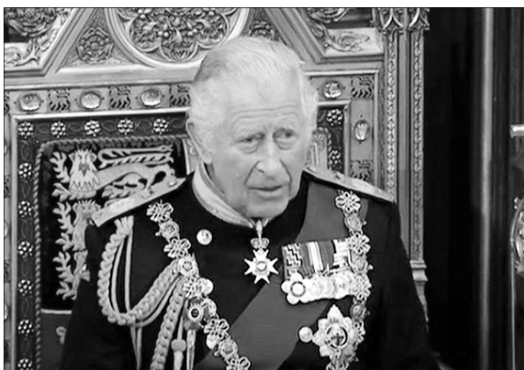
Karalius Karolis III.