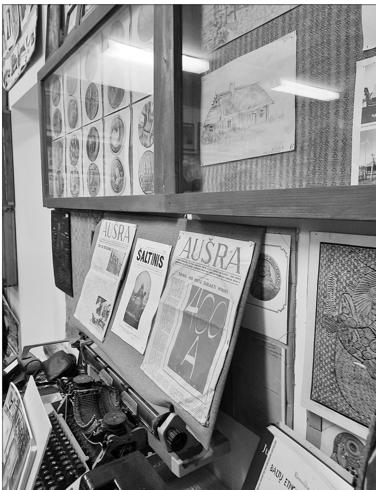
J. Vainos muziejus.