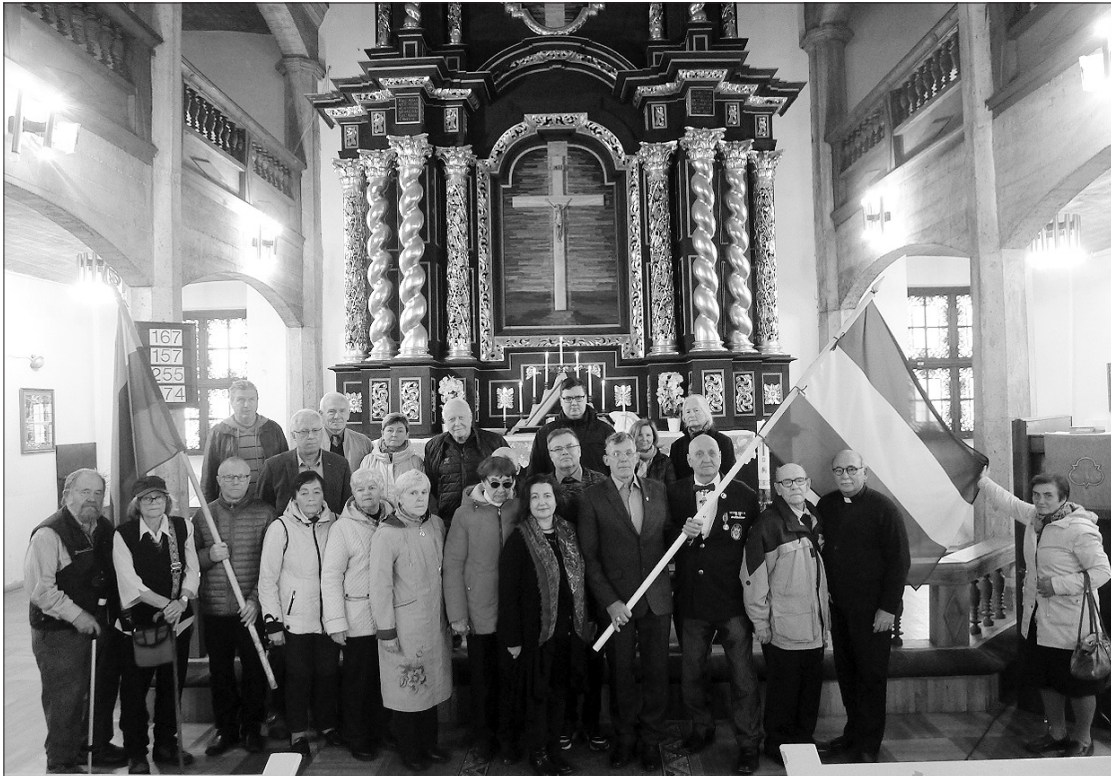
Kauno evangelikų liuteronų Švč. Trejybės šventovėje buvo laikomos pamaldos Mažosios Lietuvos genocido aukoms atminti.