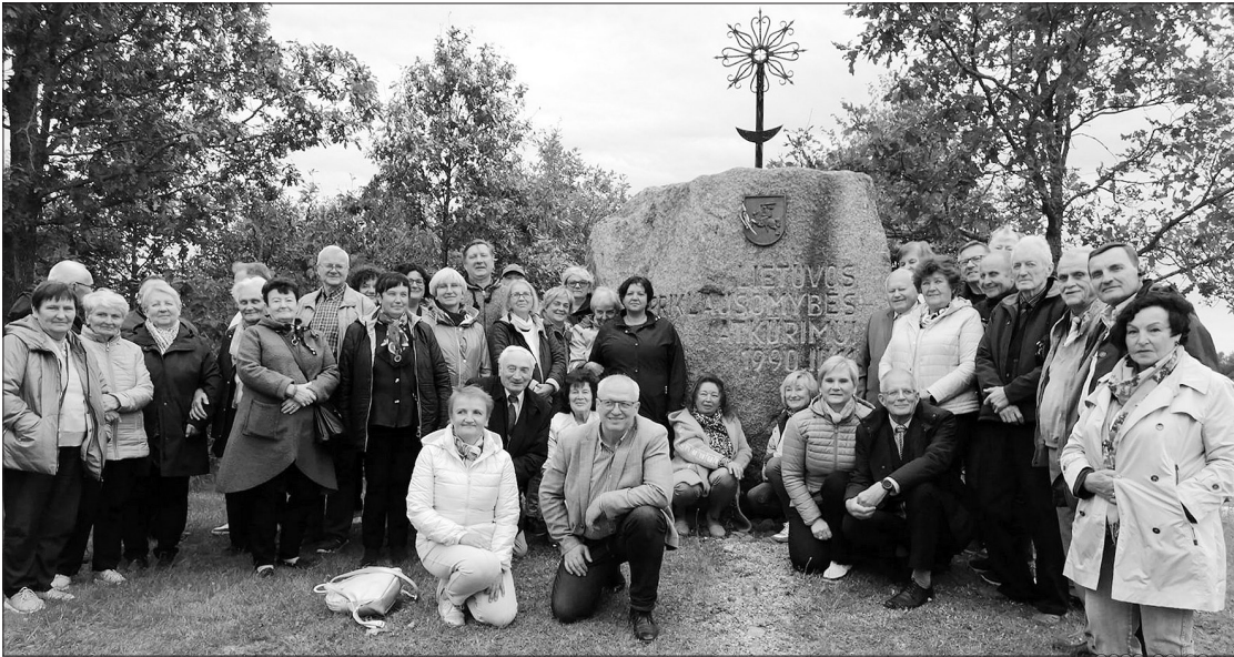
LPKTS delegacija prie paminklo Lietuvos Nepriklausomybei.