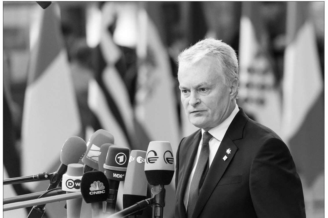
Lietuvos Prezidentas Gitanas Nausėda Europos Vadovų Tarybos (EVT) posėdyje.

Lietuvos vadovas ES lyderių diskusijoje penktadienį kėlė tolesnių sankcijų Rusijai klausimą ir ragino pradėti rengti devintąjį sankcijų paketą.