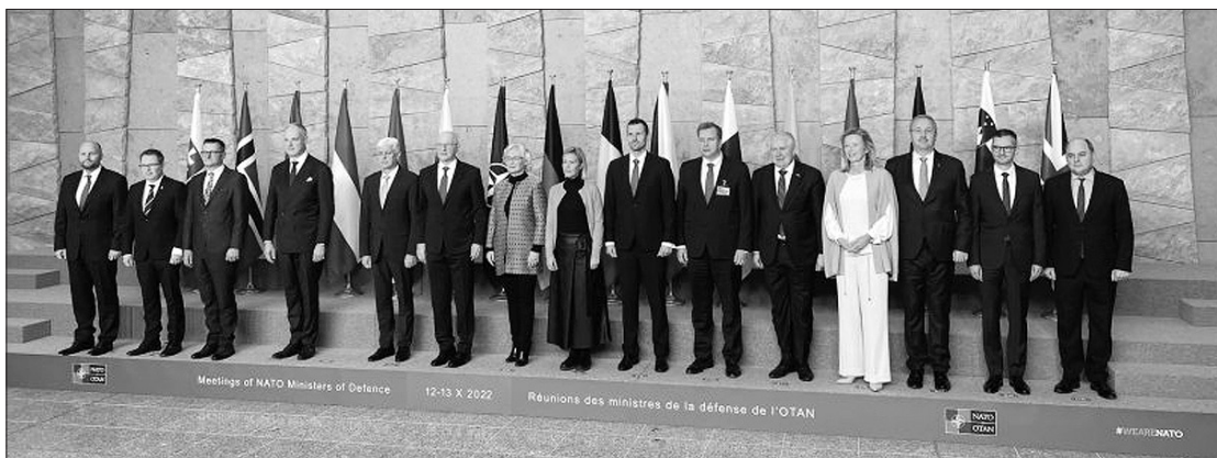
NATO gynybos ministrų susitikimas spalio 13 d. Briuselyje.