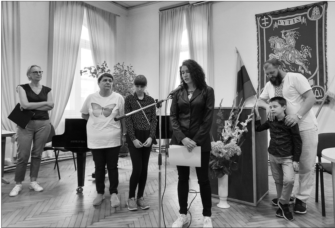
Ukrainiečių šeima parodos atidaryme.