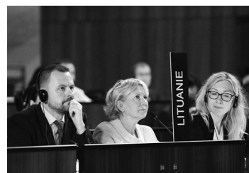
Lietuvos atstovai.

Spalio 5-19 dienomis Paryžiuje, Prancūzijoje, vykstančios UNESCO Vykdomosios tarybos 215-osios sesijos metu priimti svarbūs sprendimai dėl šios organizacijos paramos Ukrainai.