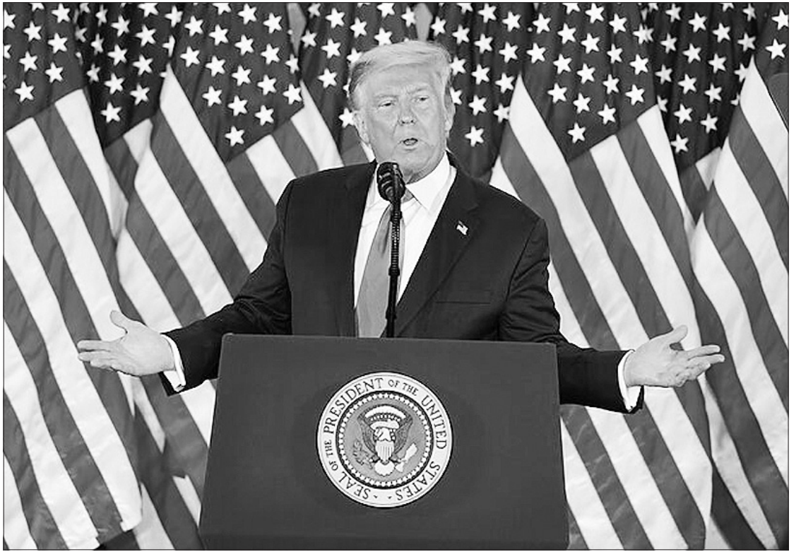
45-asis Jungtinių Amerikos Valstijų prezidentas Donaldas Trampas (Donald Trump).