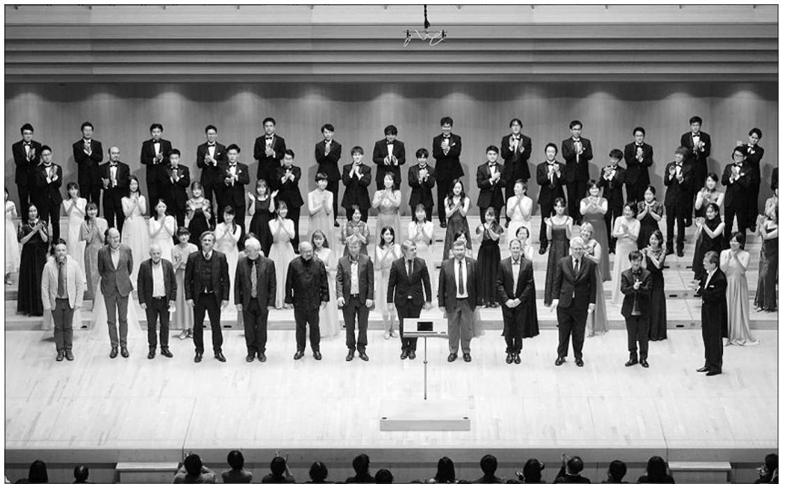
Vytauto Miškinio kūrinio pasaulinė premjera Tokijuje.