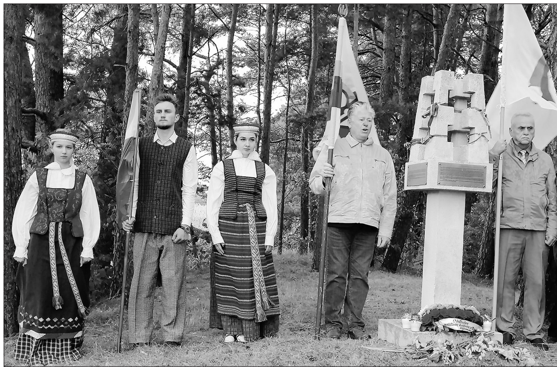
Šlynakiemyje, prie paminklo žuvusiems partizanams.