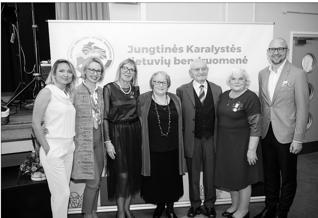
Jungtinės Karalystės lietuvių bendruomenės (JKLB) Londono 1-ojo skyriaus 75 metų jubiliejus renginyje.

2022 metų spalio 1 d. Lietuvos ambasadorius Eitvydas Bajarūnas dalyvavo iškilmin-