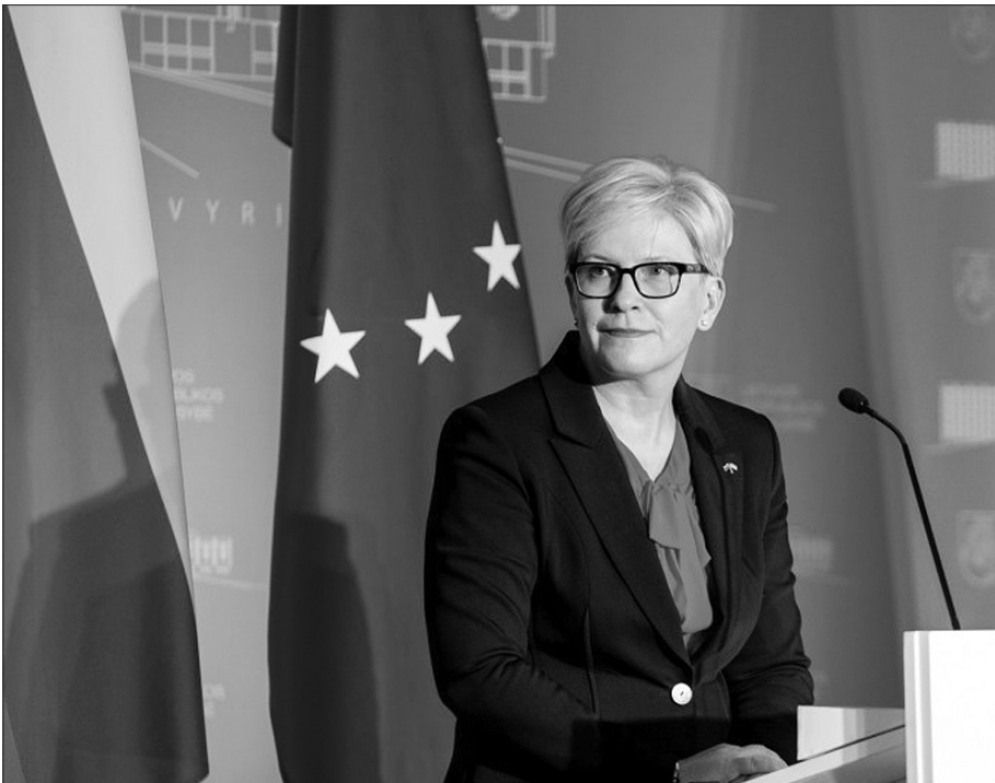
Lietuvos Ministrė Pirmininkė Ingrida Šimonytė.