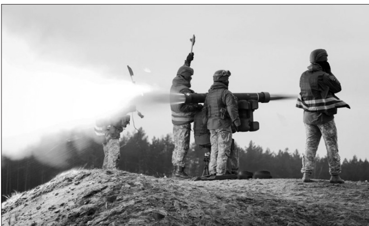
Lietuva pirks oro gynybai reikalingą ginkluotę.

Gynybos resursų agentūra prie Krašto apsaugos ministerijos šiandien pasirašė sutartį su Švedijos įmone „SAAB Dynamics AB“ dėl artimojo nuotolio priešlėktuvinės raketinės sistemos „RBS-70“ valdomų „Bolide“ ir „MK-2“ tipo raketų įsigijimo. Įsigyjamos raketos padės užtikrinti efektyvesnę oro gynybos užduočių vykdymą.