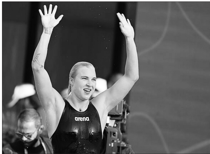
Lietuvos plaukikė Rūta Meilutytė.