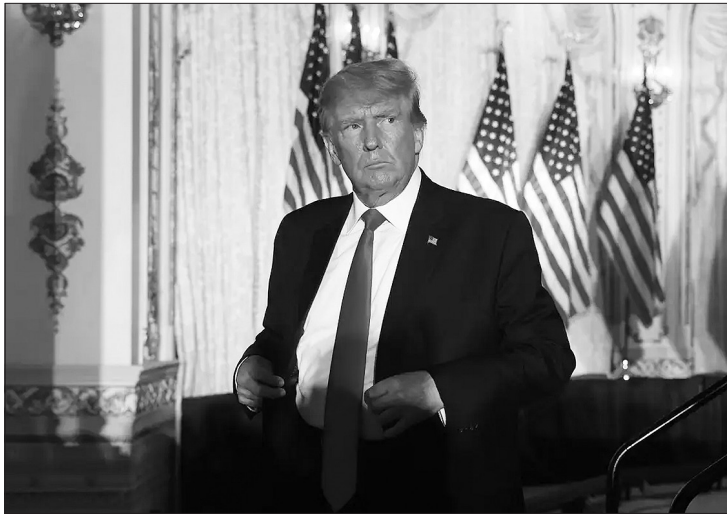
Donaldas Trampas (Donald Trump).