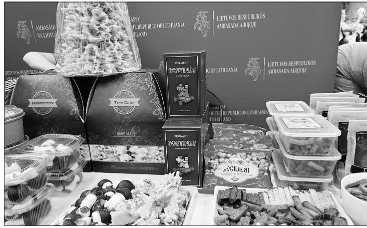
Lietuvos ambasados Airijoje stendas renginyje - International Charity Bazaar Dublin. LR URM

Smagios atmosferos renginiui suteikė Dublino lietuvių tautinių šokių kolektyvo „Suktinis“ pasirodymas (Elonos Šokių Studija). LR URM