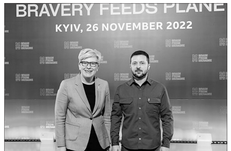
Ingrida Šimonytė ir Volodymyras Zelenskis.

Ukrainos pasienio apsaugos tarnyba pranešė, kad Lenkijos