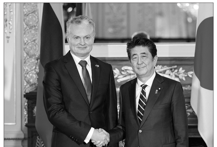
Lietuvos Prezidento Gitano Nausėdos susitikimas su ministru pirmininku Šindzo Abe vizito Japonijoje metu, 2019 m. spalio mėn.

29 Japonijos ir Lietuvos santykiai https://lt.wikipedia.org/wiki/Japonijos_ir_Lietuvos_santykiai