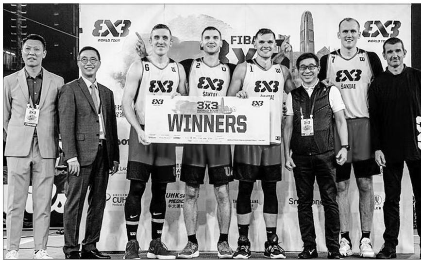
Šakių „Gulbelės“ ekipa.