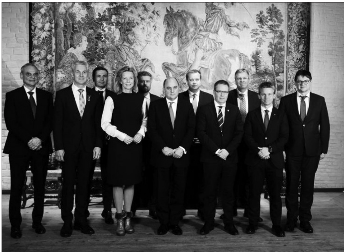
Šiaurės grupės gynybos ministrai Norvegijos sostinėje Osle.