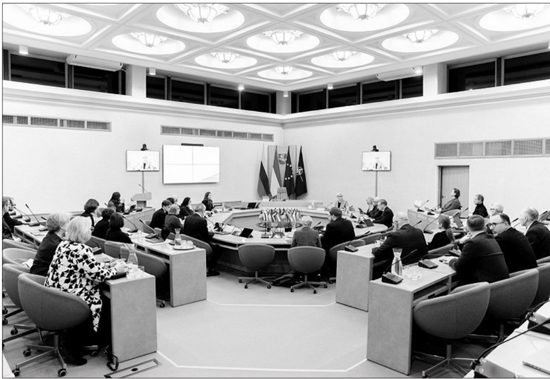
Š.m. lapkričio 21 d. Valstybės pažangos tarybos posėdyje aptarti šiuo metu rengiamos Valstybės pažangos strategijos „Lietuva 2050” galimi Lietuvos ateities scenarijai. LRV

Lapkričio 21 d. įvykusiame Valstybės pažangos tarybos posėdyje aptarti šiuo metu rengiamos Valstybės pažangos strategijos „Lietuva 2050” galimi Lietuvos ateities scenarijai bei ryškėjančios strateginių ambicijų ir ateities vizijos kryptys. Detalesnis jų turinys paaiškės toliau konsultuojantis su visuomene ir bendrakūrėjais. Numatoma, kad Lietuvos ateities vizija pasieks Seimą 2023 m. pavasarį.