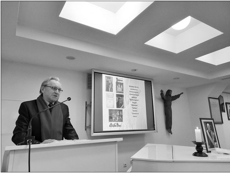
Kalba rašytojas Laimonas Inis.