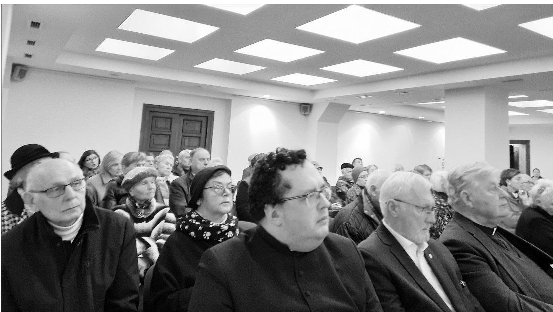
Kauno Kristaus prisikėlimo bazilikos konferencijų salėje.