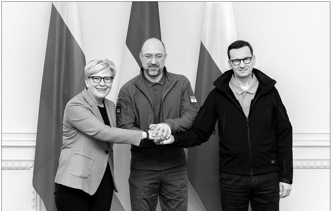
Iš kairės: Lietuvos Ministrė Pirmininkė Ingrida Šimonytė, Ukrainos Ministras Pirmininkas Denys Šmyhalis ir Lenkijos Ministras Pirmininkas Mateusz Morawiecki.

Premjerė I. Šimonytė užtikrino, jog Lietuvos pagalba Uk-