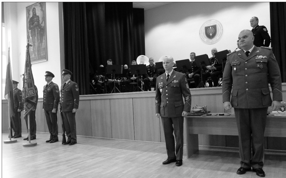
Š.m. lapkričio 22 d. Divizijos generolo S. Raštikio Lietuvos kariuomenės mokykloje vyko iškilmingas Lietuvos kariuomenės dienos minėjimas.