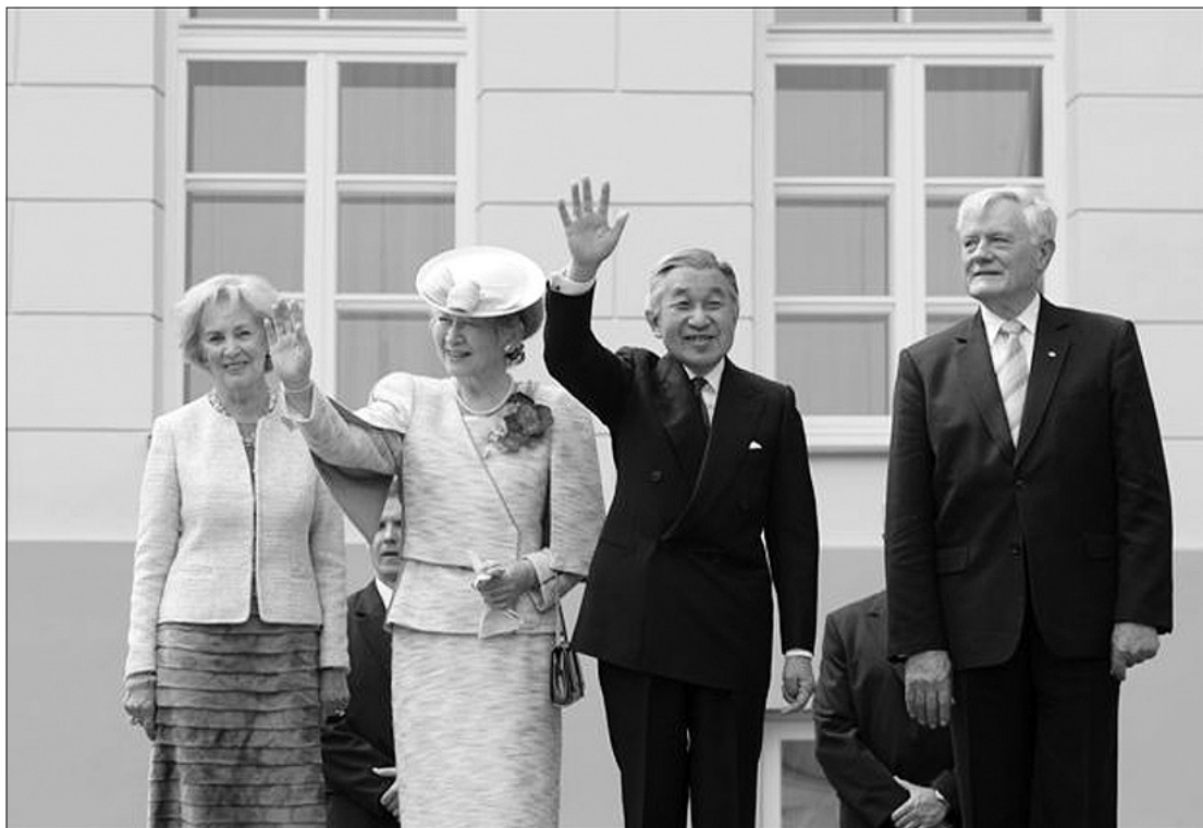
Japonijos imperatoriaus Akihito (antras iš dešinės) vizitas Lietuvoje 2007 (pirmas iš dešinės – Lietuvos prezidentas V. Adamkus).