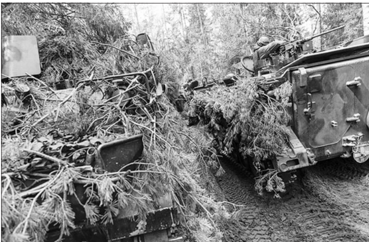
„Ugninis griausmas 2022“.