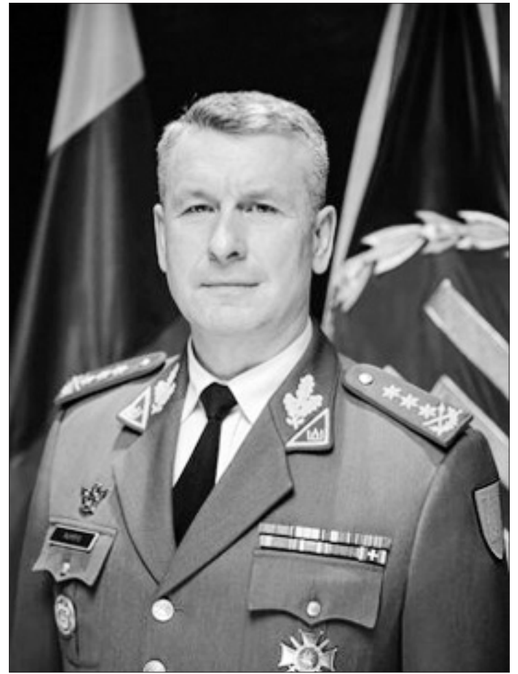
Valdemaras Rupšys – generolas leitenantas, Lietuvos kariuomenės vadas.

Mes turime geras treniravimo sąlygas: kovinio šaudymo pratyboms, manevravimui, pratyboms su mūsų Lietuvos vienetais, pratyboms su kitais sąjungininkais, dislokuotais Lietuvoje. Aš matau geras perspektyvas