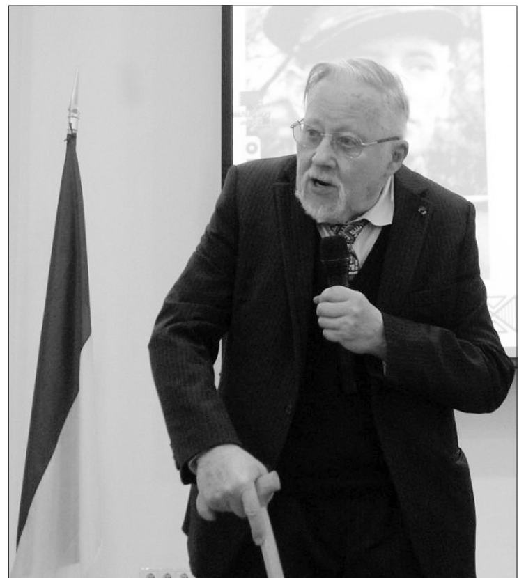
Kovo 11-osios Lietuvos Nepriklausomybės Akto signataras, Aukščiausiosios Tarybos Atkuriamojo Seimo Pirmininkas prof. Vytautas Landsbergis.