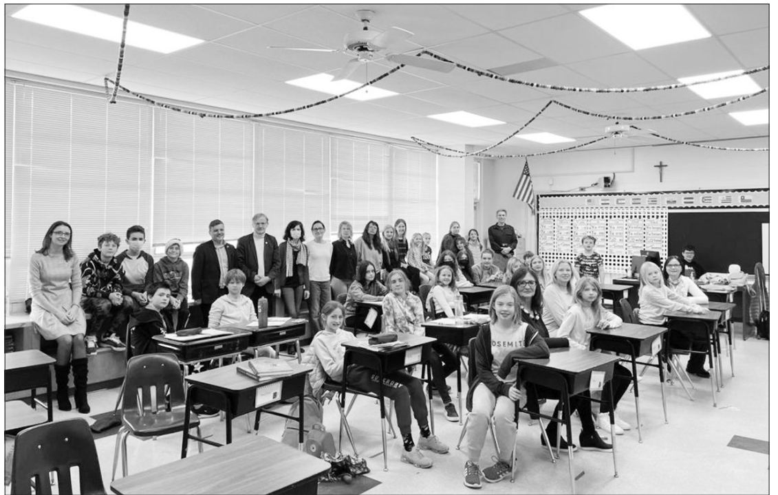
Edukacija Vašingtono Kristijono Donelaičio lituanistinė mokykloje.