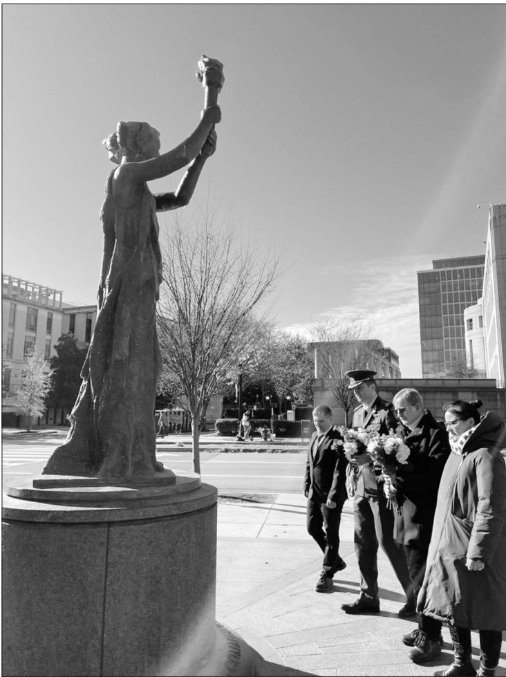
Atminimo gėlės padėtos prie Komunizmo aukų memorialo Vašingtone.