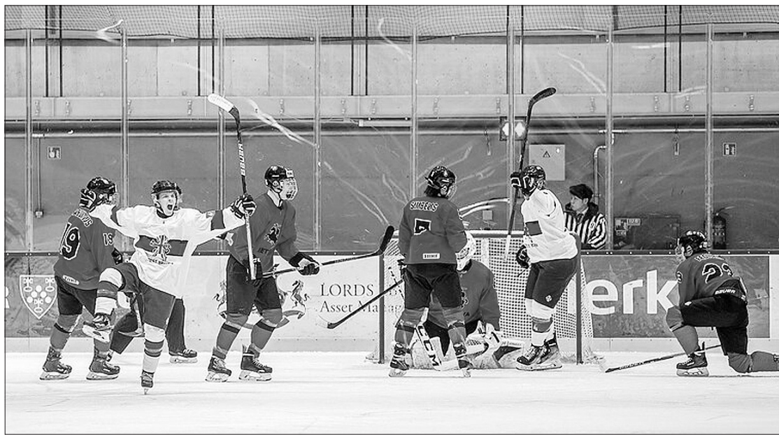
Lietuvos jaunimo ledo ritulio rinktinė.