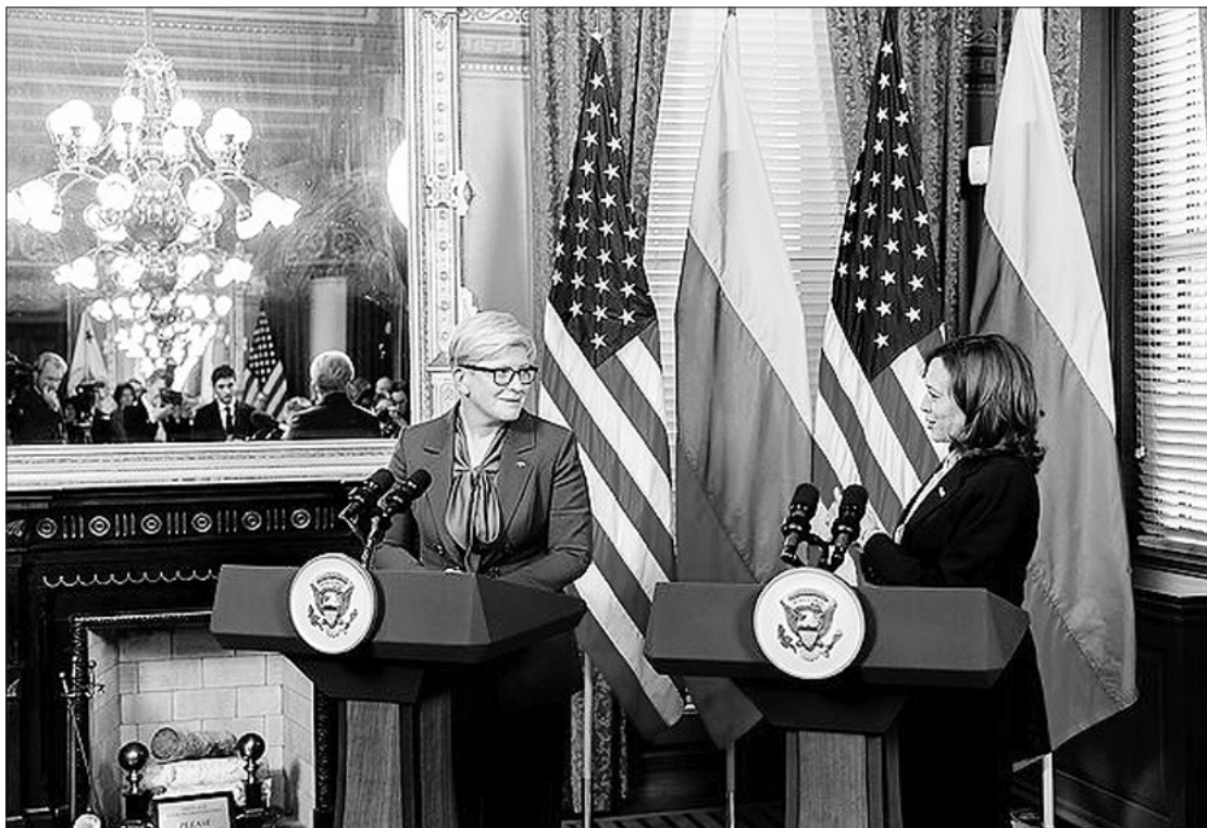
Ingridos Šimonytės ir Kamalos Harris susitikimas.