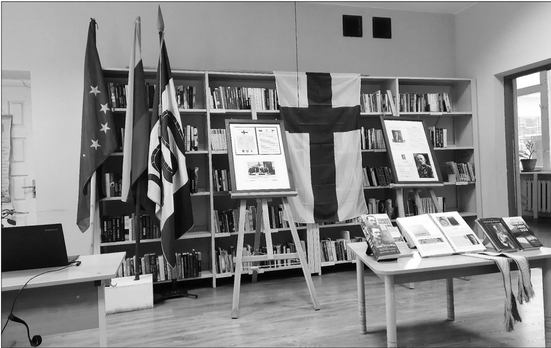
Utenos rajono savivaldybės administracijos Vyžuonų seniūnijoje vykusio iškilmingo Suomijos Nepriklausomybės ir Vėliavos dienos minėjimui skirti informaciniai standai.

2022 m. gruodžio 6 d. Utenos rajono savivaldybės administracijos Vyžuonų seniūnijoje įvyko iškilmingas Suomijos Nepriklausomybės ir Vėliavos dienos minėjimas.