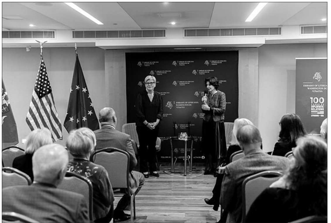
Lietuvos Premjerė Ingrida Šimonytė susitiko su Vašingtono ir Baltimorės lietuvių bendruomenėmis.

„Šiandien partnerystė su Jungtinėmis Amerikos Valstijomis yra tapusi viena pagrindinių saugumo garantų Baltijos regione, o pastaruosius tris dešimtmečius būtent Pensilvanijos Nacionalinė gvardija bendradarbiavimu su Lietuvos kariuomene labai svariai prisideda prie mūsų šalies gynybos pajėgumų stiprinimo, todėl džiaugiuosi galimybe asmeniškai padėkoti tiek valstijos Nacionalinės gvardijos vadui, tiek jos gubernatoriui už indelį stiprinant šiuos ryšius su Lietuva“, – susitikime su gubernatoriumi