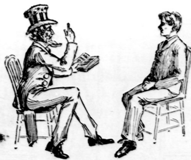
Dede Siamas mokina lietuvi Angliszkos kalbos.